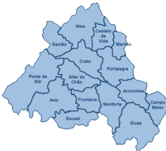
Figura 1- Concelhos do Distrito de Portalegre

Cedillo, em Espanha, até à ribeira de Alferreira no início do concelho de Gavião. (Figura 1)