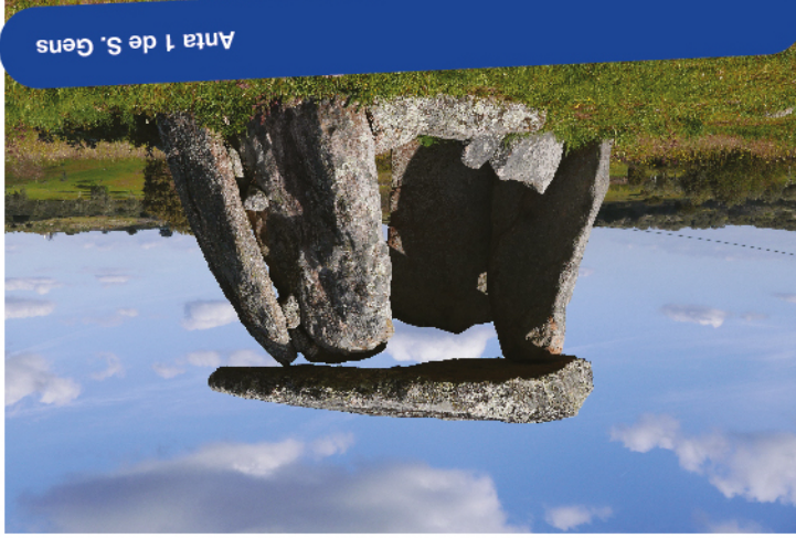
Anta 1 de S. Gens