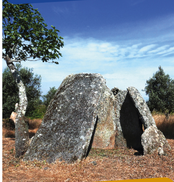
Anta de N.ª Sr.ª da Redonda