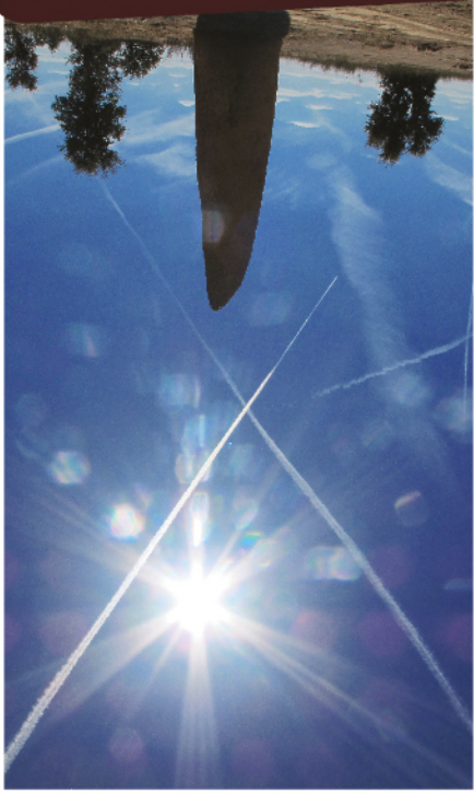
Menhir do Patalou