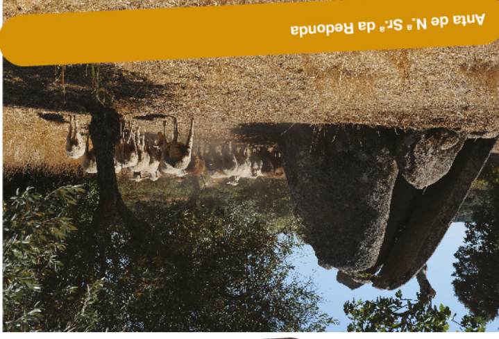
Anta de N.ª Sr.ª da Redonda