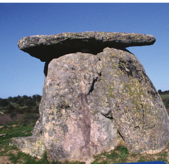
Anta 1 de S. Gens

Todos os monumentos situam-se em propriedades privadas onde poderá haver gado, pelo que se solicita ao visitante que não deixe as porteiças abertas.