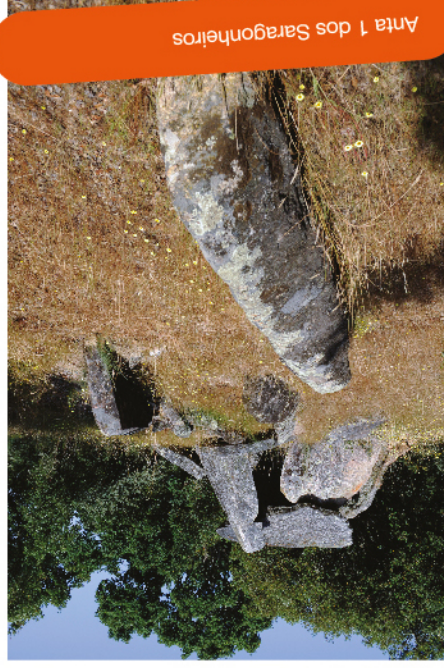
Anta 1 dos Saragoneiros

expressam-se nos singulares menhires, dos quais se destaca o