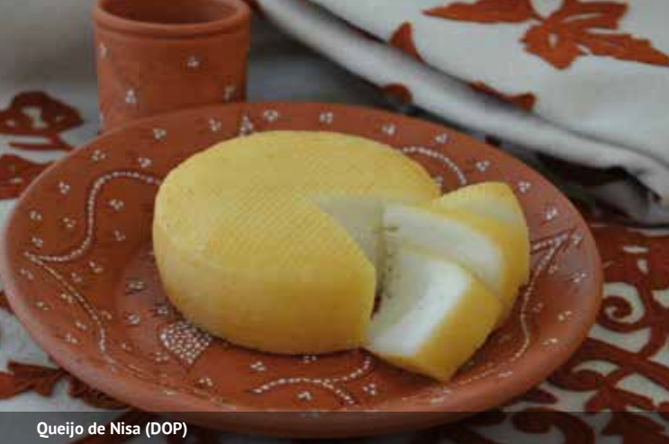
Queijo de Nisa (DOP)