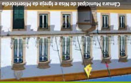
Câmara Municipal de Nisa e Igreja da Misericórdia

O grau de dificuldade é representado segundo 4 ítems diferentes, sendo cada um deles avaliado numa escala de 1 a 5 (do mais fácil ao mais difícil). 2: advertência altimétrica 2: advertência de orientação 2: tipo de terreno 5: esforço físico