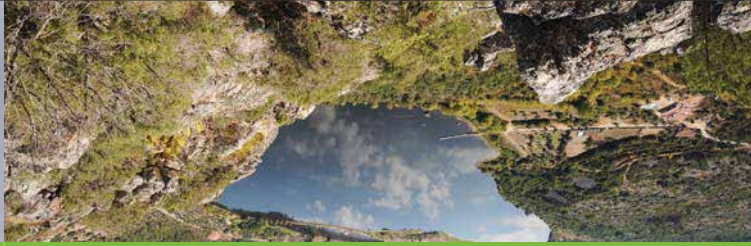
Pego das Portas, visto do Miradouro