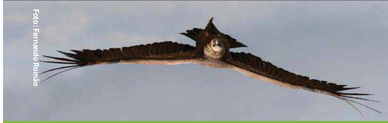
Grifo ( Gyps fulvus )