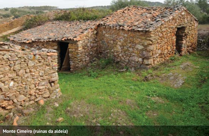
Monte Cimeiro (ruínas da aldeia)