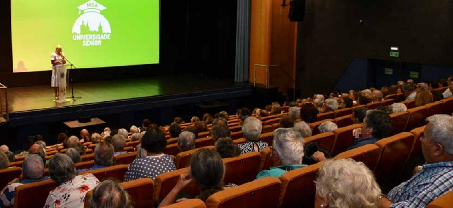
Abertura do ano letivo 2023-24 da Universidade Sénior de Nisa