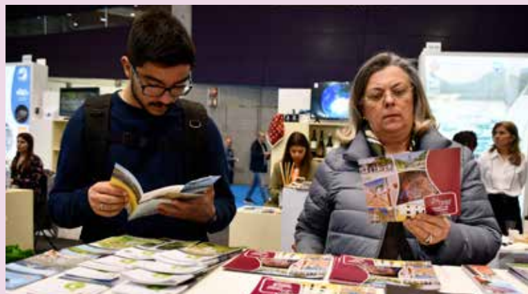
Milhares de visitantes interessados em conhecer Nisa