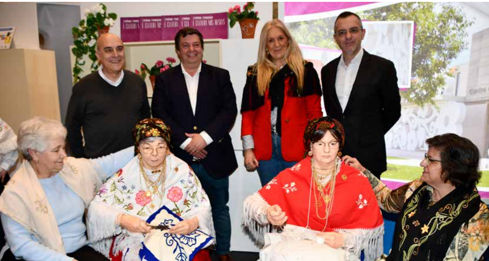
Promoção do novo espaço museológico - Centro de Artes e Ofícios

A apresentação de Nisa como um destino distinto e relevante em diversas áreas, motivou, uma vez mais, a nossa participação na grande Bolsa de Turismo de Lisboa, um espaço com relevante interesse para a potencialização e valorização do território concelhio no panorama internacional.