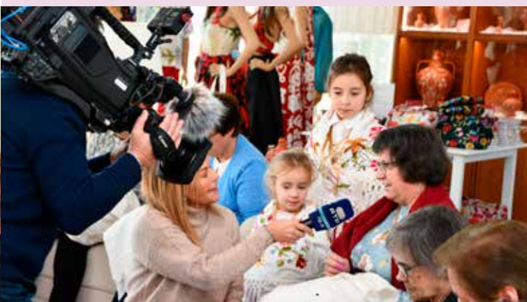
“Praça da Alegria” (RTP) em Nisa