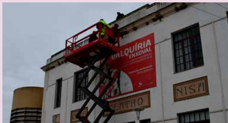
NISA Limpeza da fachada do Cine-Teatro