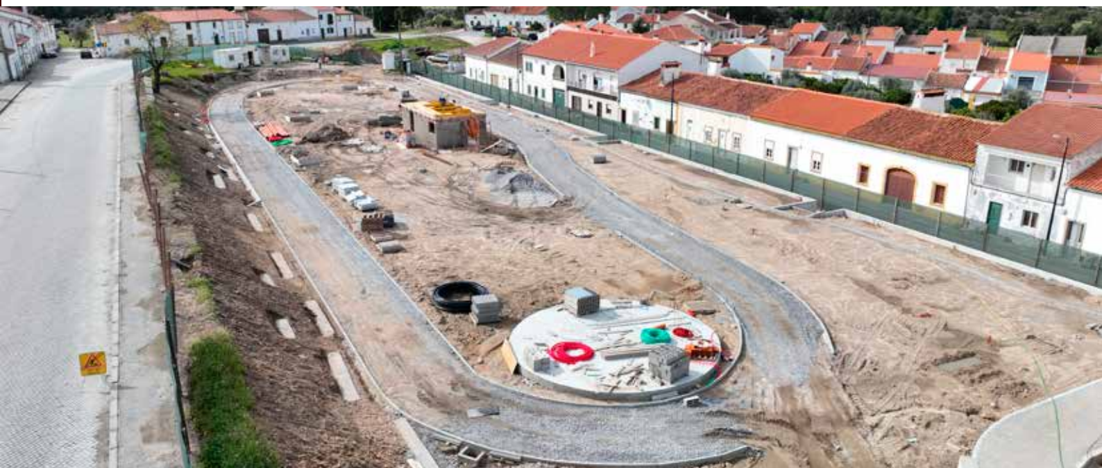
ALPALHÃO - Requalificação do Largo do Calvário (2ª fase) - Valor: 892.163,04 € + IVA