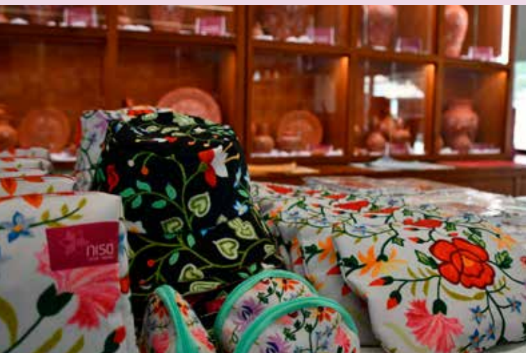
Merchandising da marca “éNisa éNosso”

É nesse sentido que mantemos a nossa estratégia de promoção territorial, na qual o Posto de Turismo e a marca “éNisa éNosso”, tem um papel de destaque em consonância com elementos turísticos como a Rua de Santa Maria, a Barca d' Amieira ou o seu magnifico “trilho de encantar” (PR11).