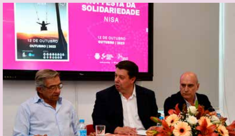
XVI Festa da Solidariedade em Nisa