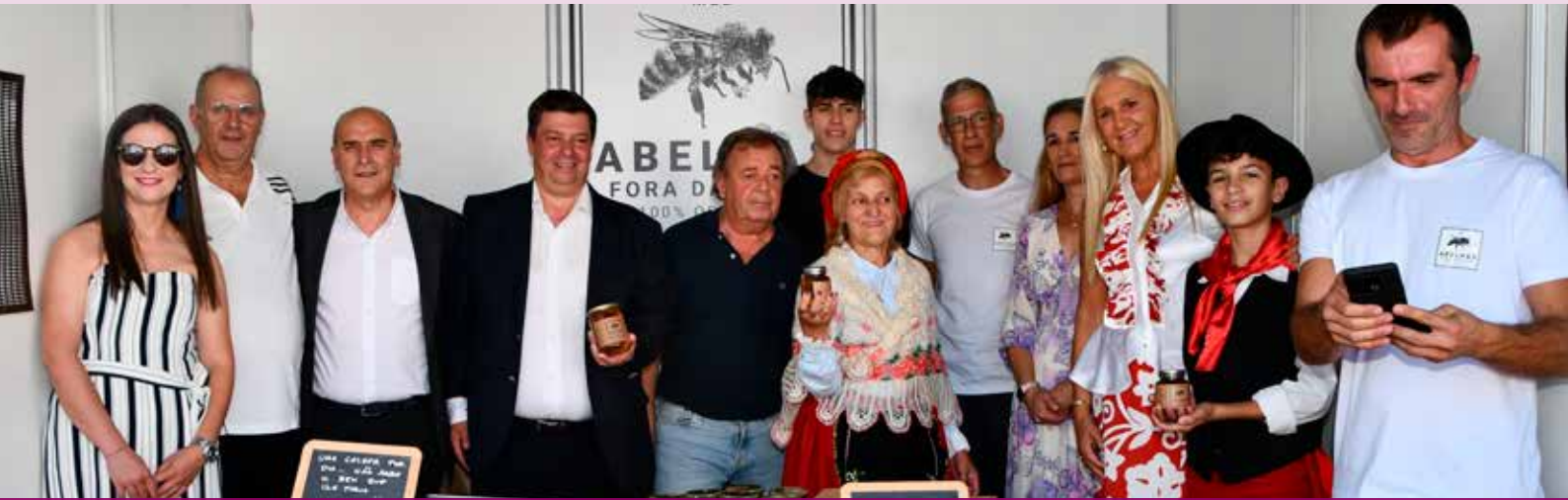
I Feira do Mel em Montalvão