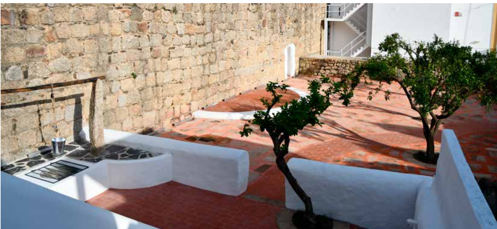
NISA - Reabilitação do logradouro da futura "Casa das Memórias" - Valor: 82.861,09 € + IVA

Empenhados na transformação do nosso Concelho, mantemos um forte investimento em obras públicas que visam tornar o Concelho de Nisa num território atrativo, bom viver e interessante para visitar.