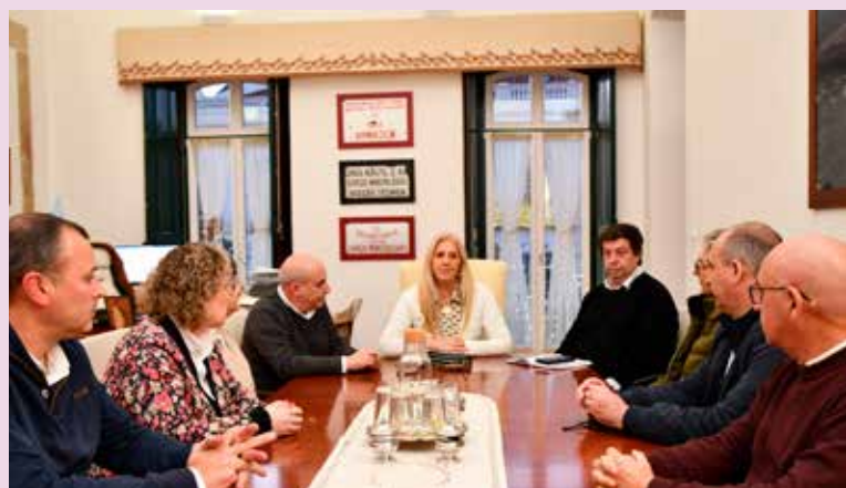
Assinatura de contratos de trabalho