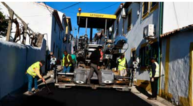
AMIEIRA DO TEJO - Pavimentação da Rua N. Sra. da Sanguinheira - Valor: 5.888,30 € + IVA