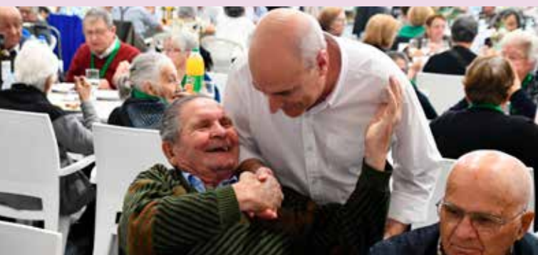
Dia do Respeito pela Pessoa Idosa