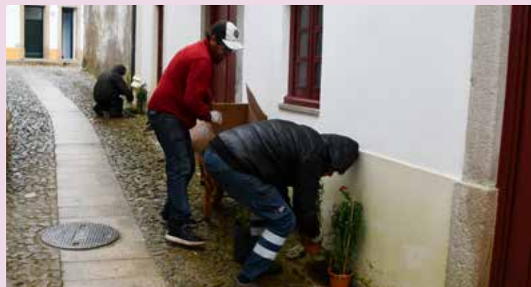
NISA Plantação de flores na Rua da Cadeia