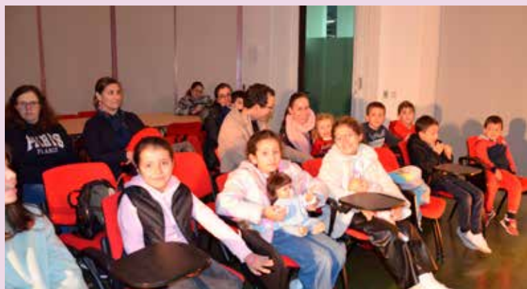
Sábados com Histórias