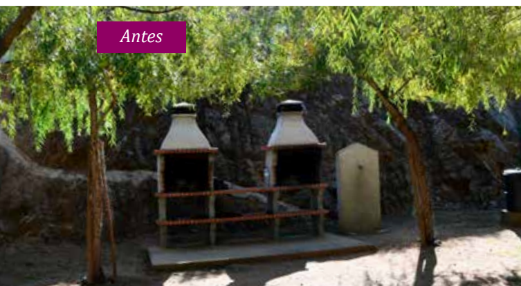
AMIEIRA DO TEJO - Beneficiação da zona de lazer - Valor: 20.089,00 € + IVA