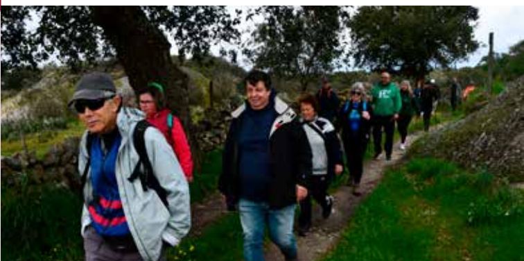
Caminhada "À Descoberta do Menhir do Patalou" em Nisa

Parte dessa promoção concretiza-se no programa "Caminhos de Nisa ao Encontro do Património" que desenvolve diversas caminhadas em vários pontos do território concelhio, promovendo não só a atividade física, como as nossas distintas e maravilhosas paisagens e o tanto património que temos em cada lugar ou localidade.