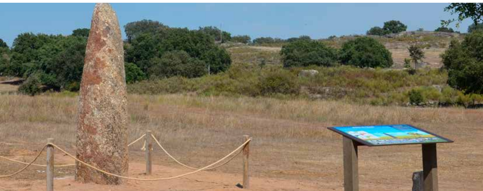
Menir do Patalou

agora classificado, pela Secretaria de Estado da Cultura, como Monumento de Interesse Público, enriquecendo ainda mais o valor de monumento megalítico localizado na Tapada da Bajanca.