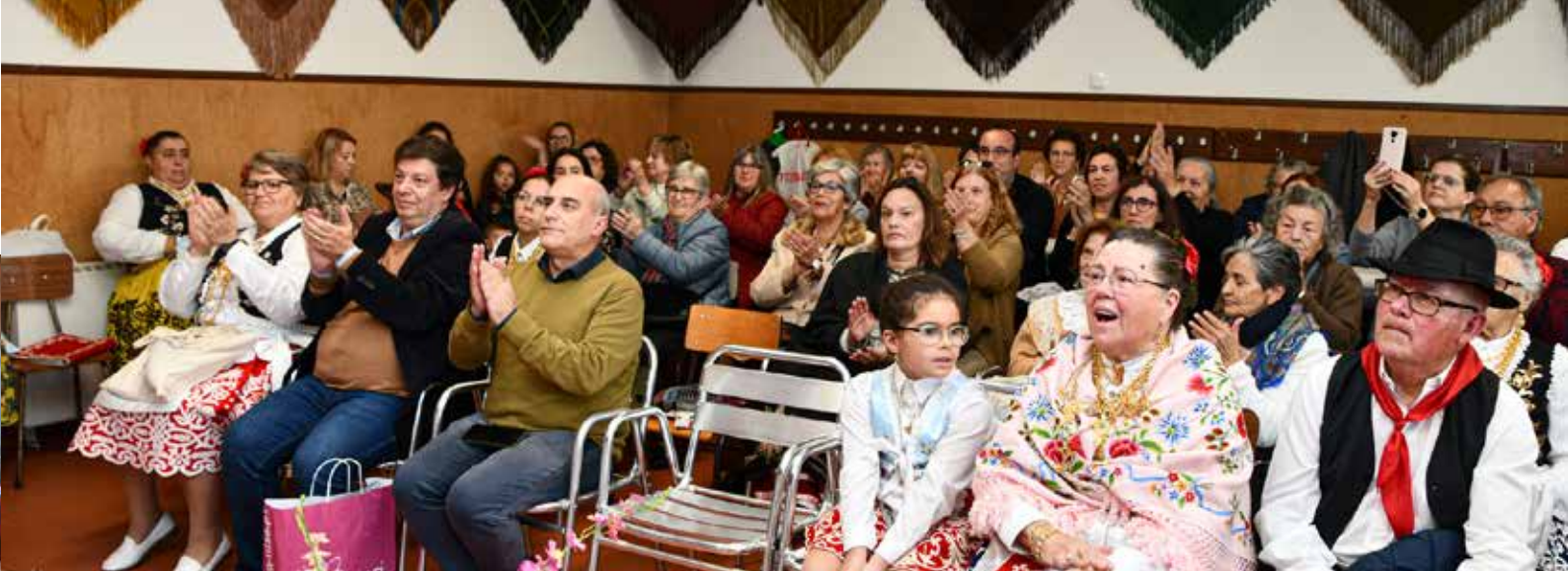
III Encontro de Cantares de Saias do Rancho das Cantarinhas de Nisa