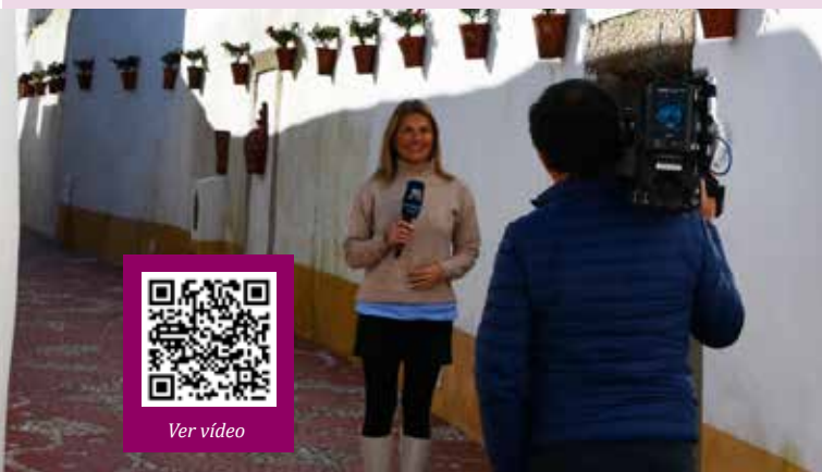
“Praça da Alegria” (RTP) em Nisa