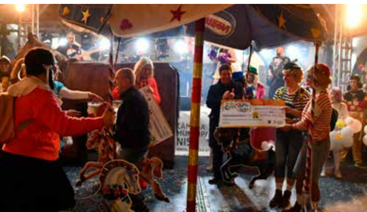
Concurso de Máscaras 2º Prémio "Carrossel"