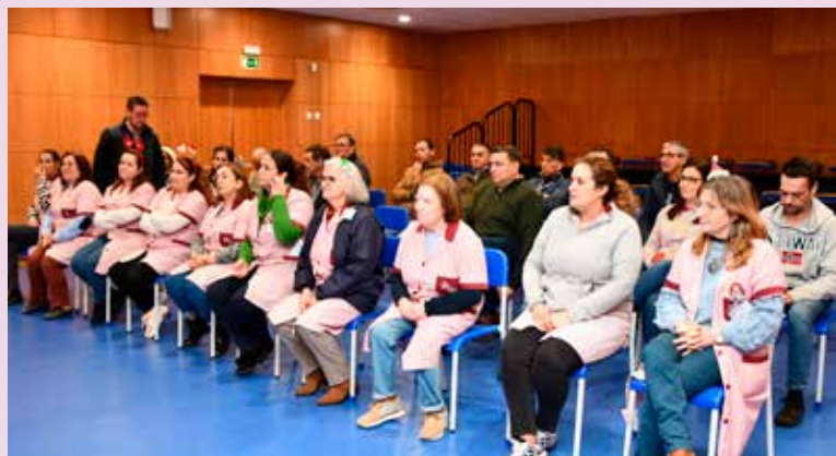
Entrega de cabazes de Natal aos funcionários municipais