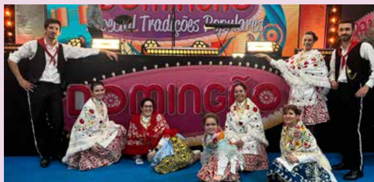
Grupo de Contradanças de Alpalhão no “Domingão” (SIC)