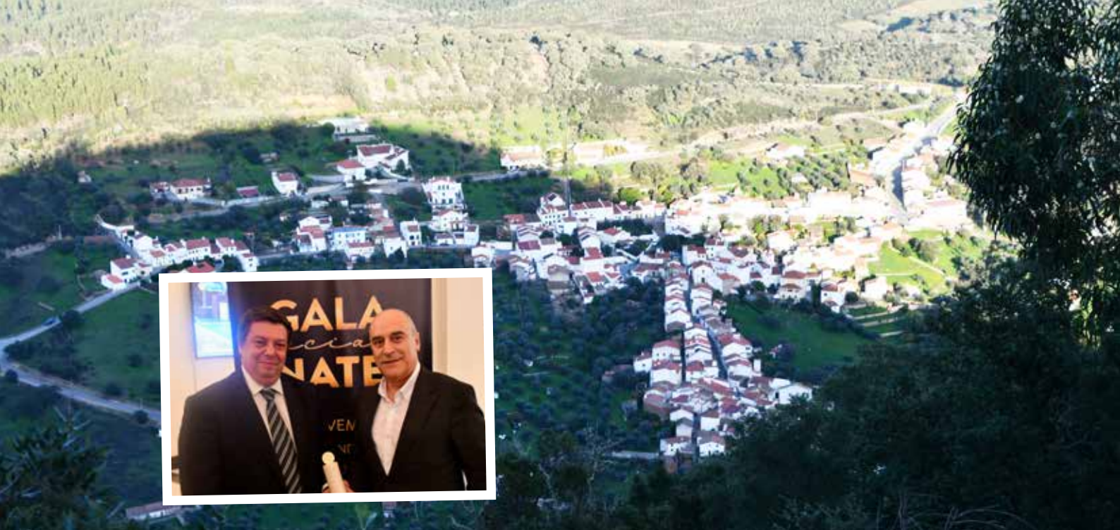
Município de Nisa na Gala Social Inatel 2023