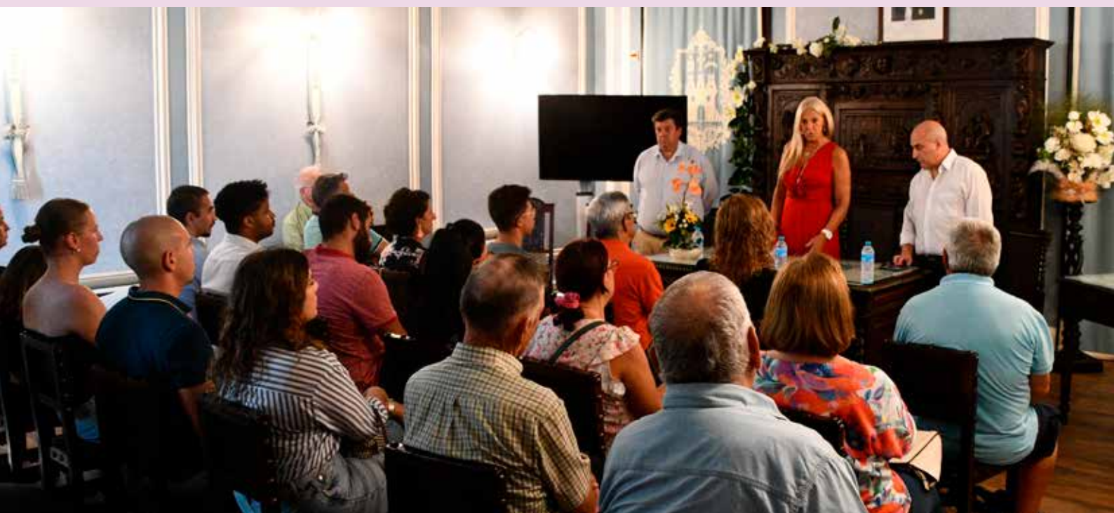
Entrega de subsídios às associações do Concelho