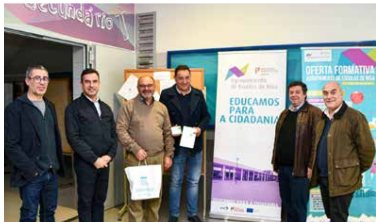
Apresentação do projeto “Hidricamente Pougando” no Agrupamento de Escolas de Nisa