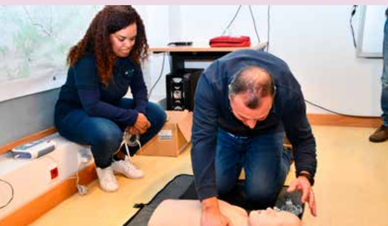
Formação em Suporte Básico de Vida