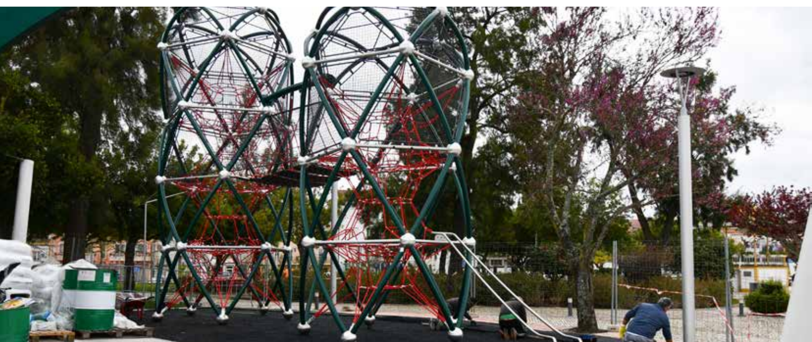
NISA Beneficiação do Parque Infantil - Valor: 174.157,60 € + IVA