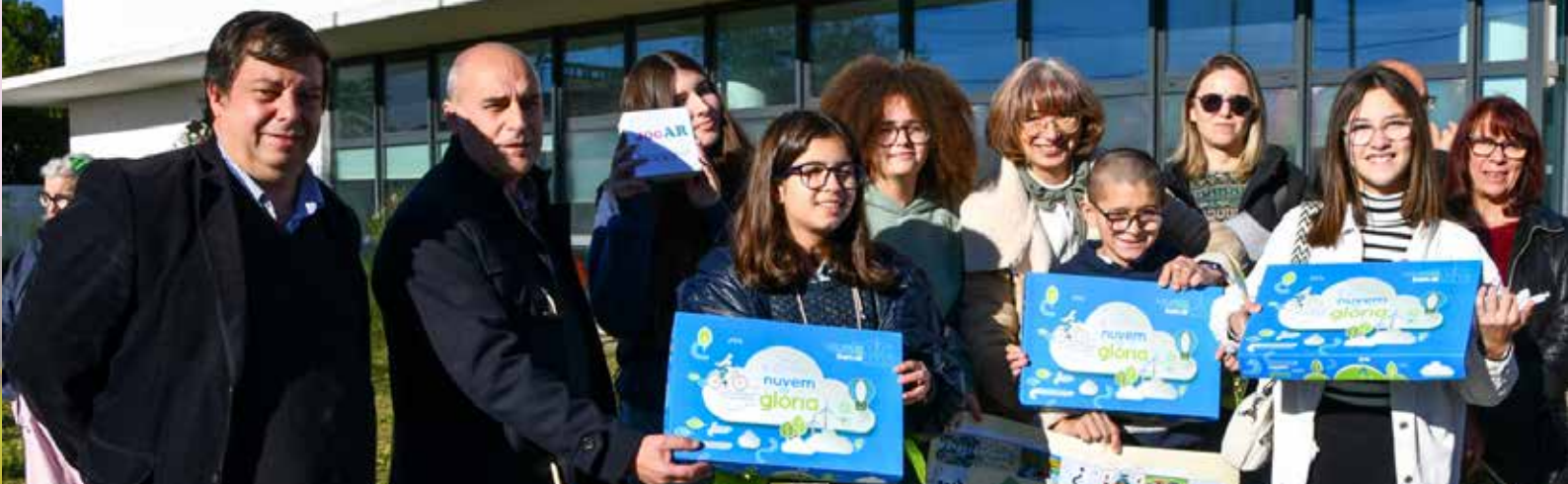
Programa Eco Escolas no Centro Escolar de Nisa