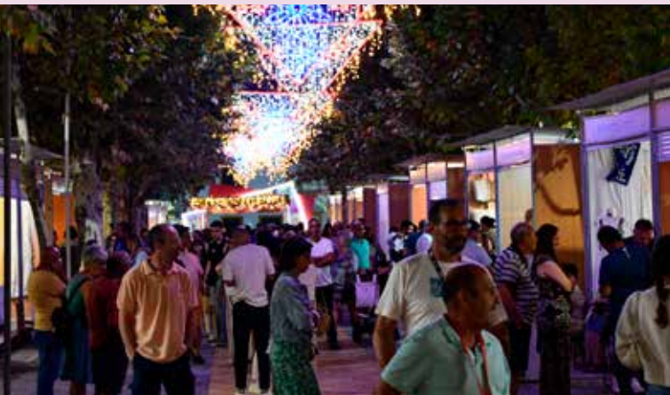
Zona de expositores