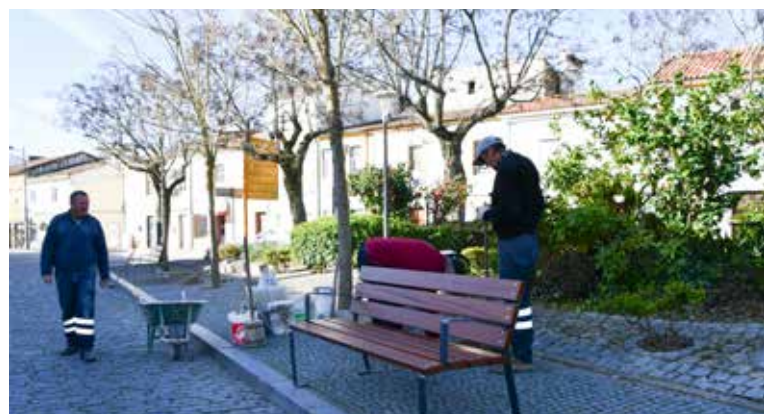
NISA Instalação de mobiliário urbano