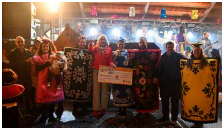
Concurso de Máscaras 1º Prémio "Cobertores de Nisa"