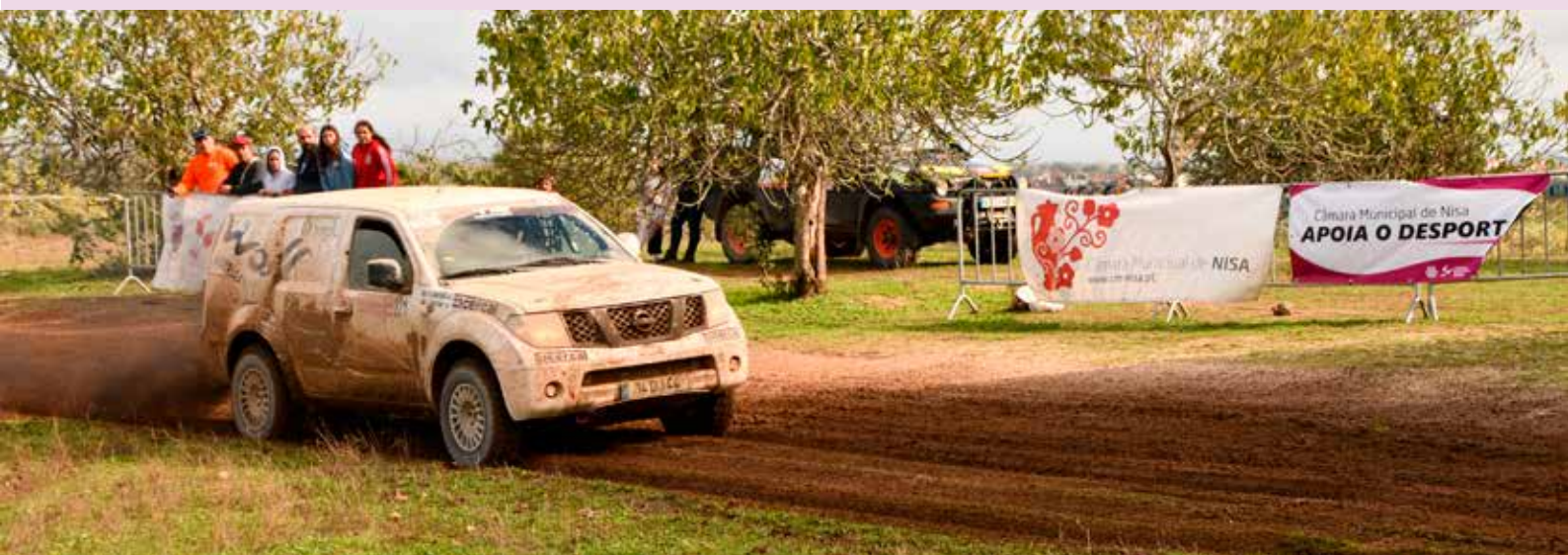
37ª Baja Portalegre no Concelho de Nisa