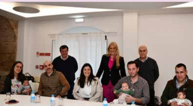
Entrega de cheques no âmbito do programa “Nascer em Nisa”

Desde 2018, ano em que criámos este programa municipal de incentivo à natalidade, já entregámos quase 130 cheques, 66 no valor de 500 euros (destinados ao 1º filho) e 63 no valor de 750 euros (destinados ao 2º filho).