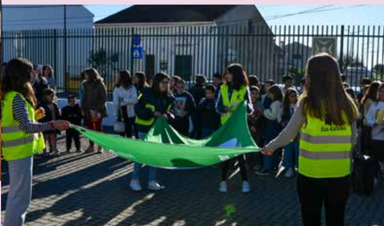
Programa Eco Escolas no Centro Escolar de Nisa