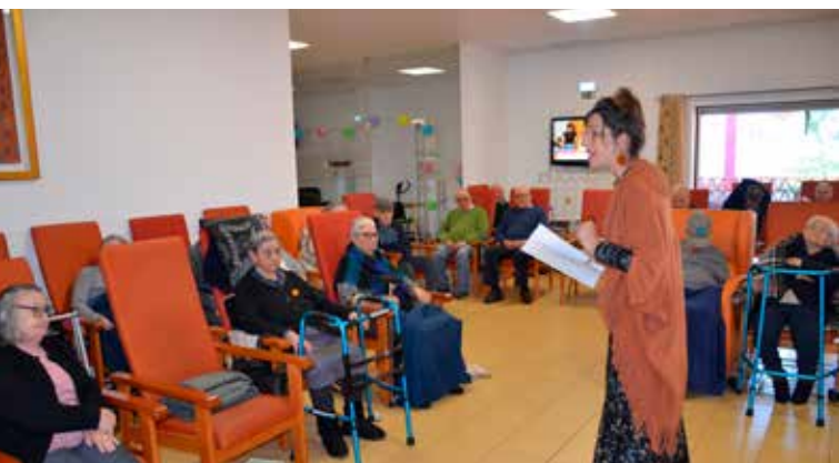
Leituras e Memórias