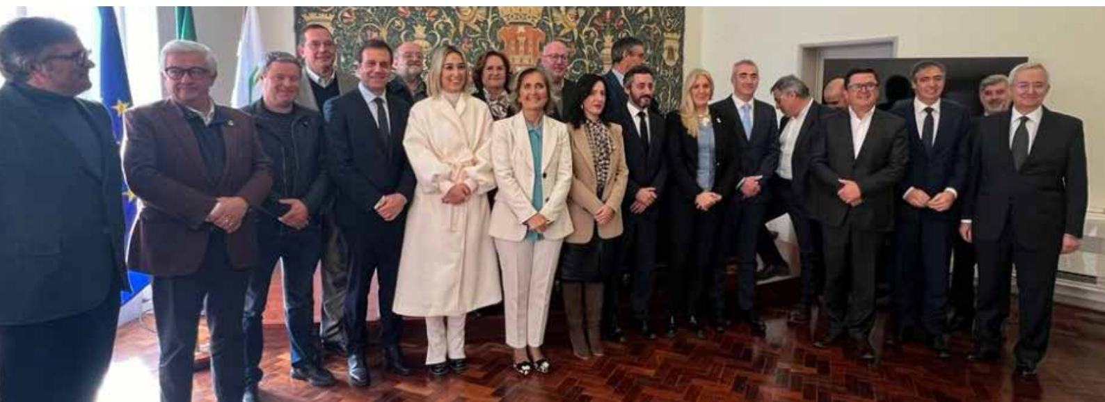
Assinatura das Adendas ao Contrato de Financiamento pelo Programa de Recuperação e Resiliência (PRR)