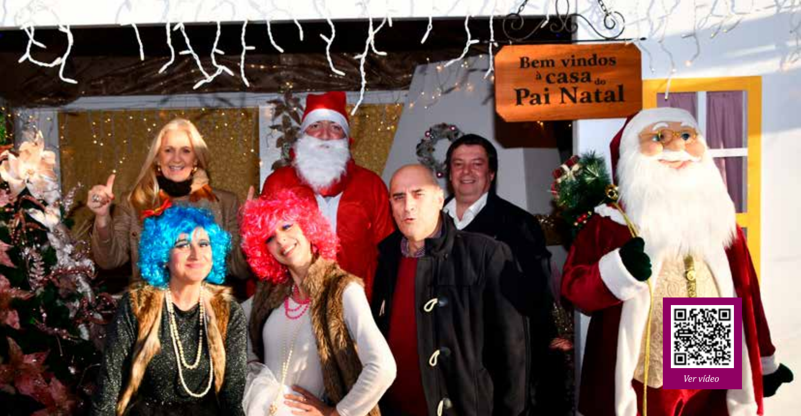
Casa do Pai Natal na Praça da República