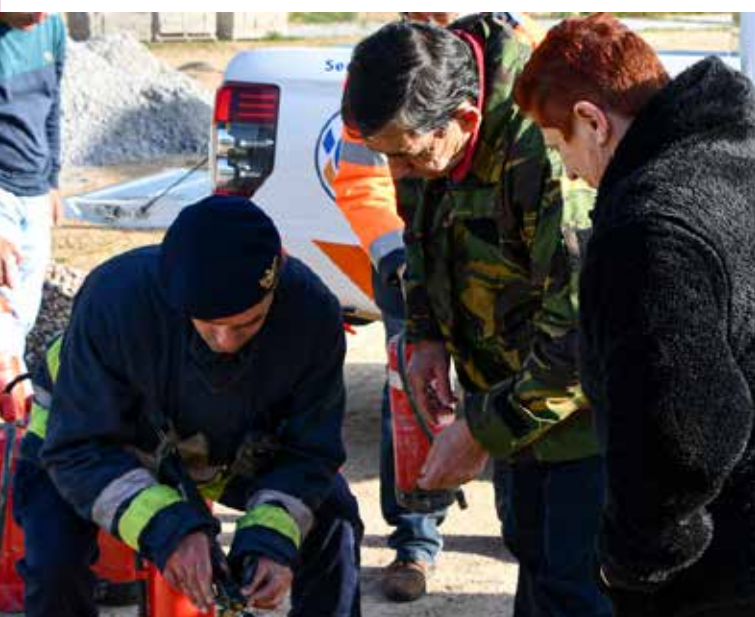
Formação para manuseamento de extintores