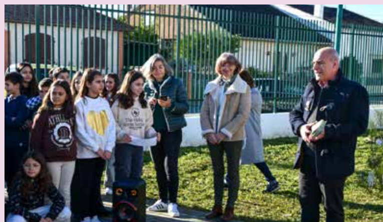
Programa Eco Escolas no Centro Escolar de Nisa