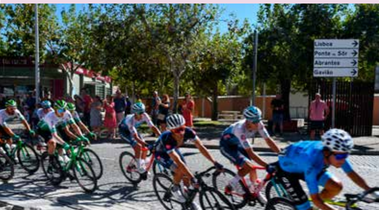
83ª Volta a Portugal em Nisa