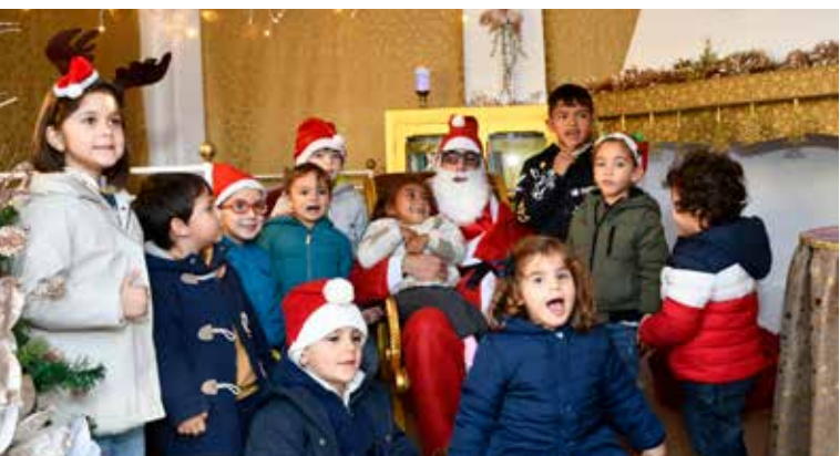
Academia de Férias de Natal Visita à casa do Pai Natal