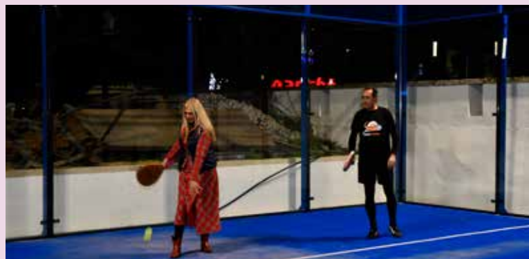
Inauguração dos Campos de Padel em Nisa