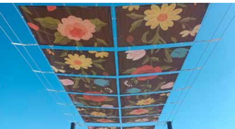
NISA - Construção de sombreamento identitário na Praça da República