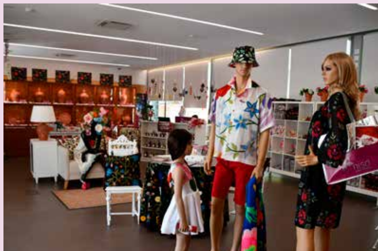
Posto de Turismo de Nisa