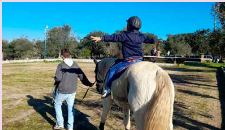
Aulas de hipoterapia em Nisa