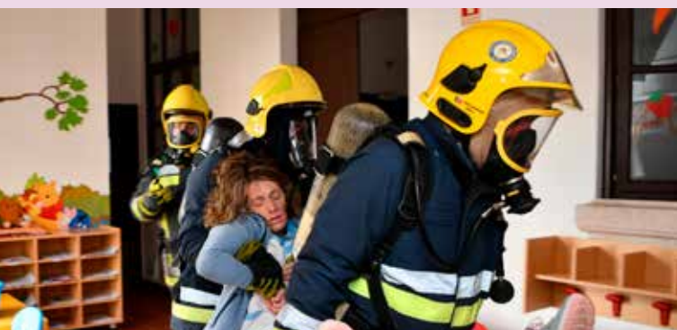
Simulacro na Creche em Alpalhão