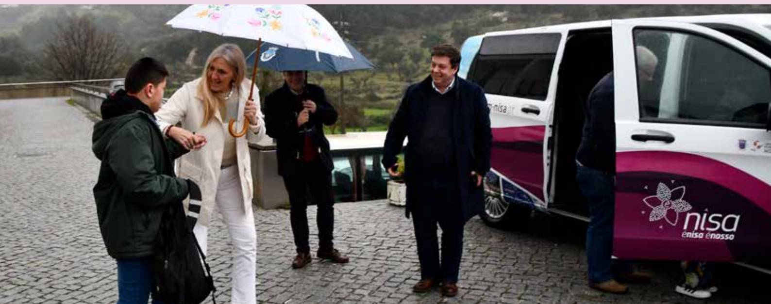
Visita à CERCÍ Portalegre na estreia da nova viatura elétrica

Assegurar o transporte de todos os alunos é uma das garantias que assumimos em matéria de educação, seja através do financiamento de passes, do recurso a empresas de transporte ou da disponibilização de viaturas municipais, para alunos que frequentam o Agrupamento de Escolas de Nisa e escolas em Portalegre.