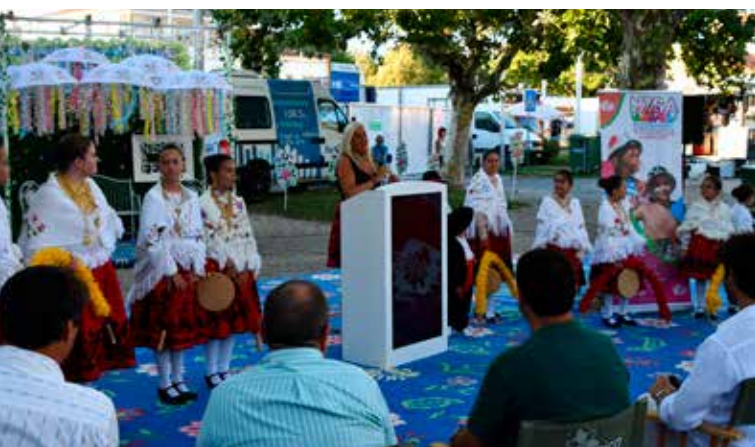
Inauguração do Nisa em Festa