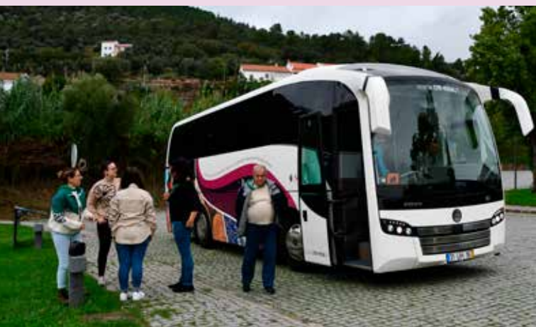
Transporte de idosos para a estação de comboios