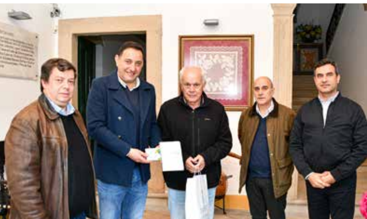
Apresentação do projeto “Hidricamente Pougando” na SCMN

água e distribuição de kits redutores de caudal, bem como outros materiais de sensibilização, que levámos a algumas instituições do nosso Concelho, nomeadamente ao Agrupamento de Escolas e à Santa Casa da Misericórdia de Nisa.