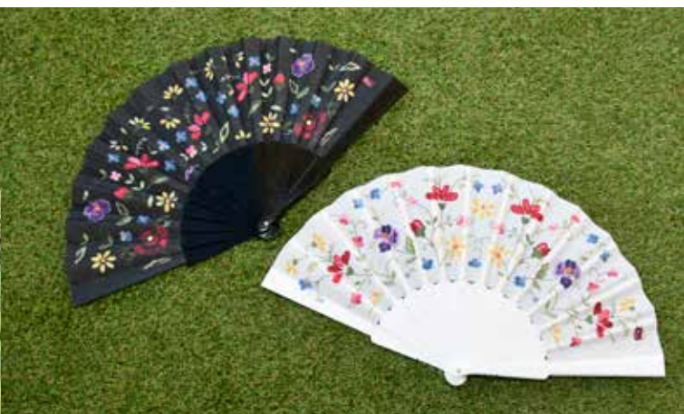
Novo merchandising da marca "éNisa éNosso"