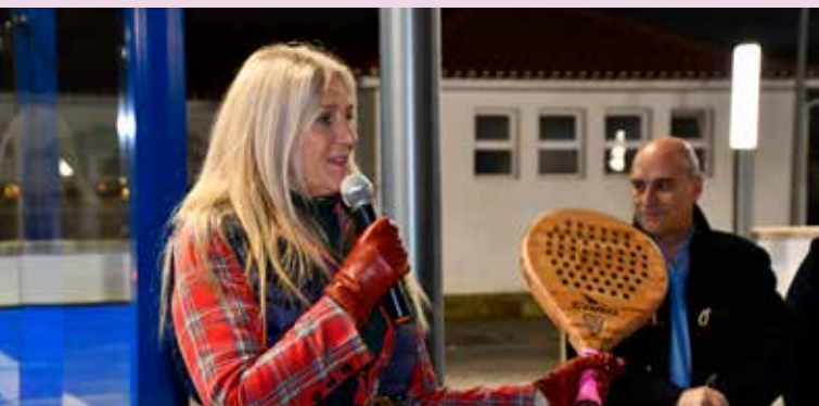
Inauguração dos Campos de Padel em Nisa

Foi com esse objetivo que investimos na construção de dois Campos de Padel, junto ao Mercado Municipal de Nisa, no âmbito do projeto de revitalização da zona onde irá nascer o éNisa Tech - Parque Cultural, garantindo o alargamento da oferta desportiva no nosso Concelho.