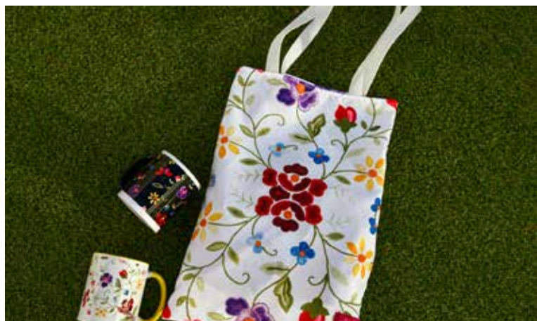
Novo merchandising da marca "éNisa éNosso"