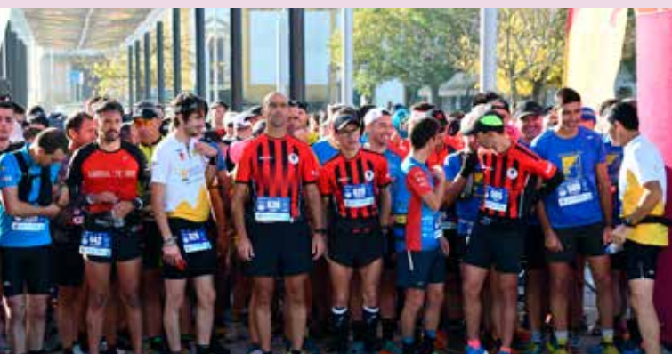
VII Trail da Vila de Nisa da Inijovem