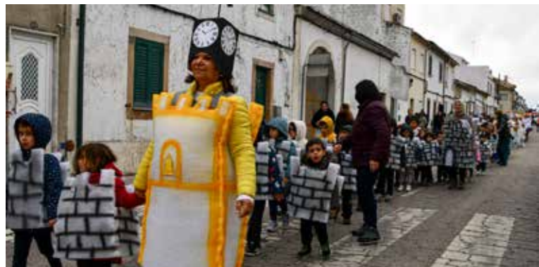
Agrupamento de Escolas no Desfile de Carnaval