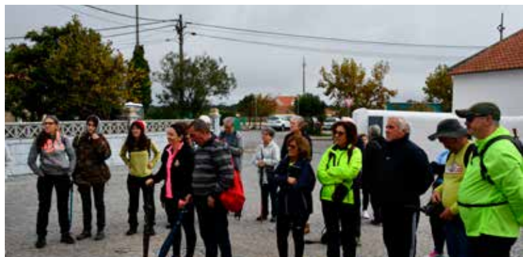
Caminhada "À Descoberta de Santo Amaro" em Tolosa