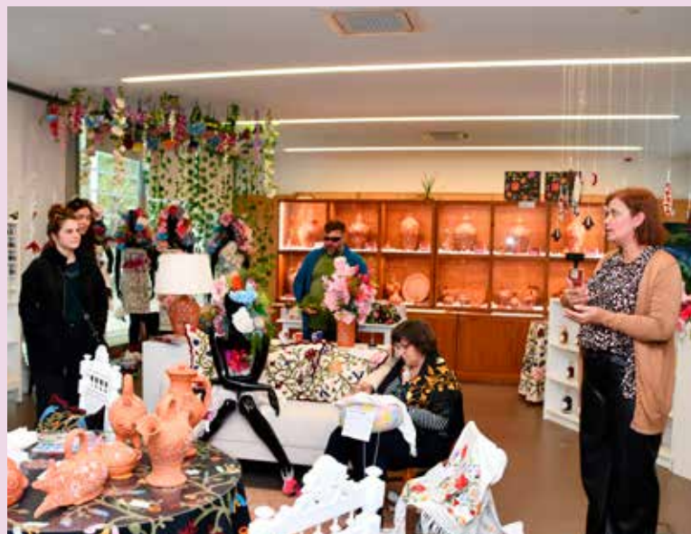
Visita ao Posto de Turismo de Nisa