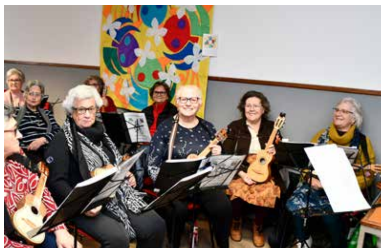
Aulas de músicas na nova sede da Universidade Sénior de Nisa