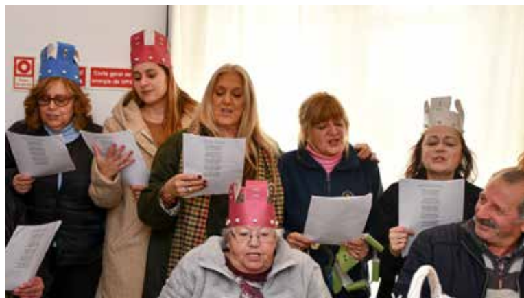
Janeiras na Câmara Municipal