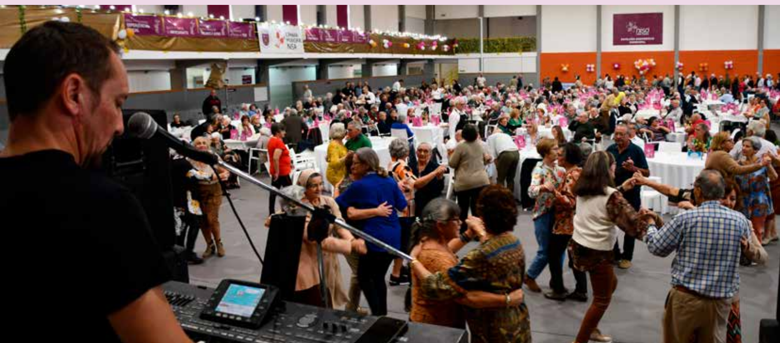
Dia do Respeito pela Pessoa Idosa