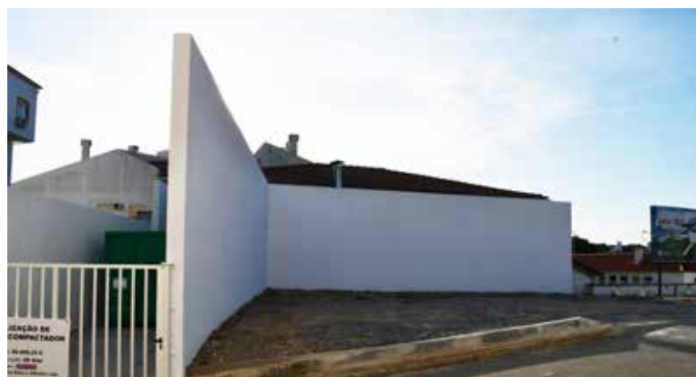
NISA - Relocalização de contentor compactador - Valor: 56.895,25 € + IVA