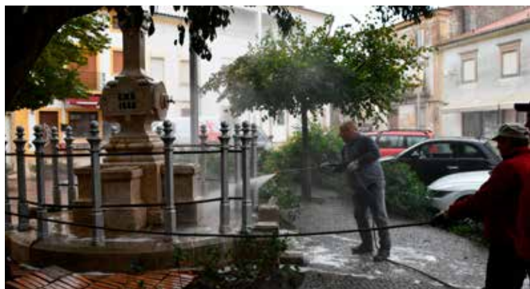
NISA - Limpeza da Fonte do Rossio