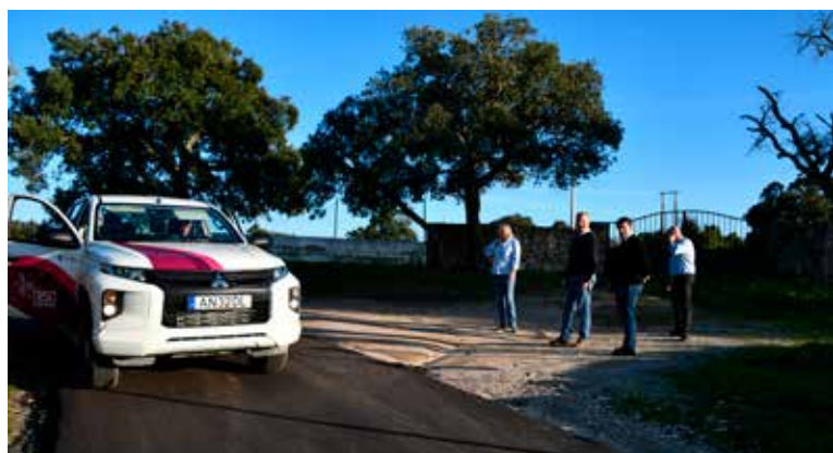
ALPALHÃO - Pavimentação do Caminho da Sra da Redonda - Valor: 48.325,60 € + IVA