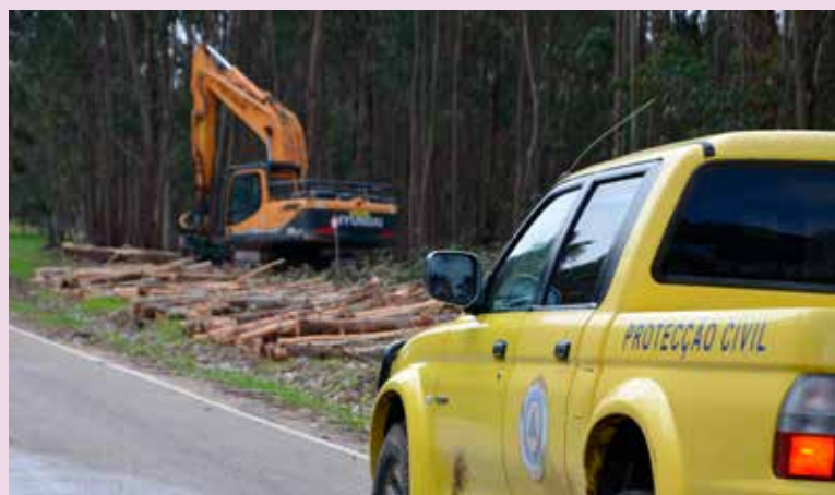
Execução de faixas de gestão de combustível