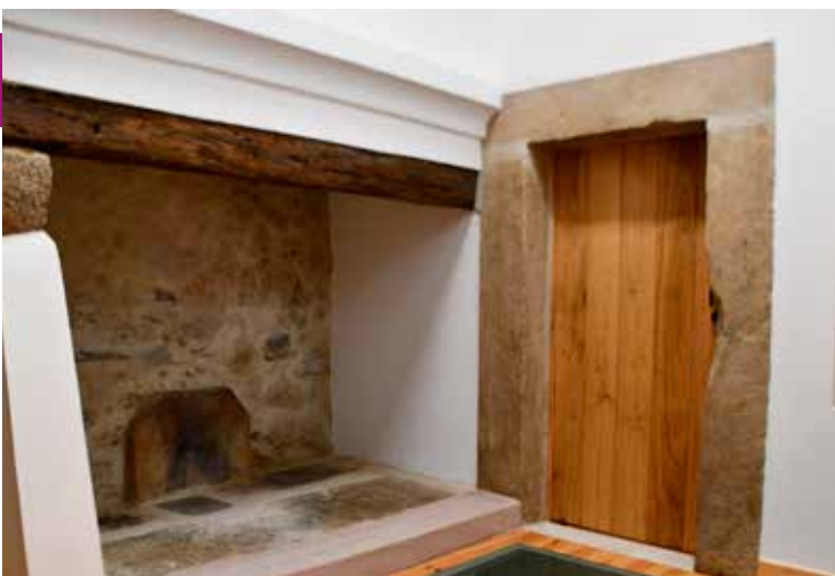
NISA - Interior da "Casa das Memórias" (Cadeia Velha) - Valor: 535.201,97 € + IVA