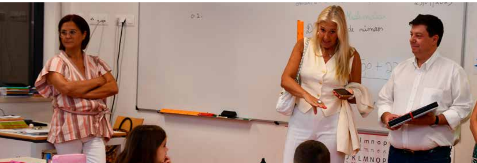
Oferta de Cadernos de Atividades Escolares

Facultados os meios, cabe a cada aluno, a dedicação e empenho pela conquista de bons resultados e também aí têm o nosso incentivo através dos Prémios de Mérito Escolar, com valores entre os 50 e os 300 euros, que atribuímos anualmente aos melhores alunos de cada ciclo e curso do ano letivo anterior.