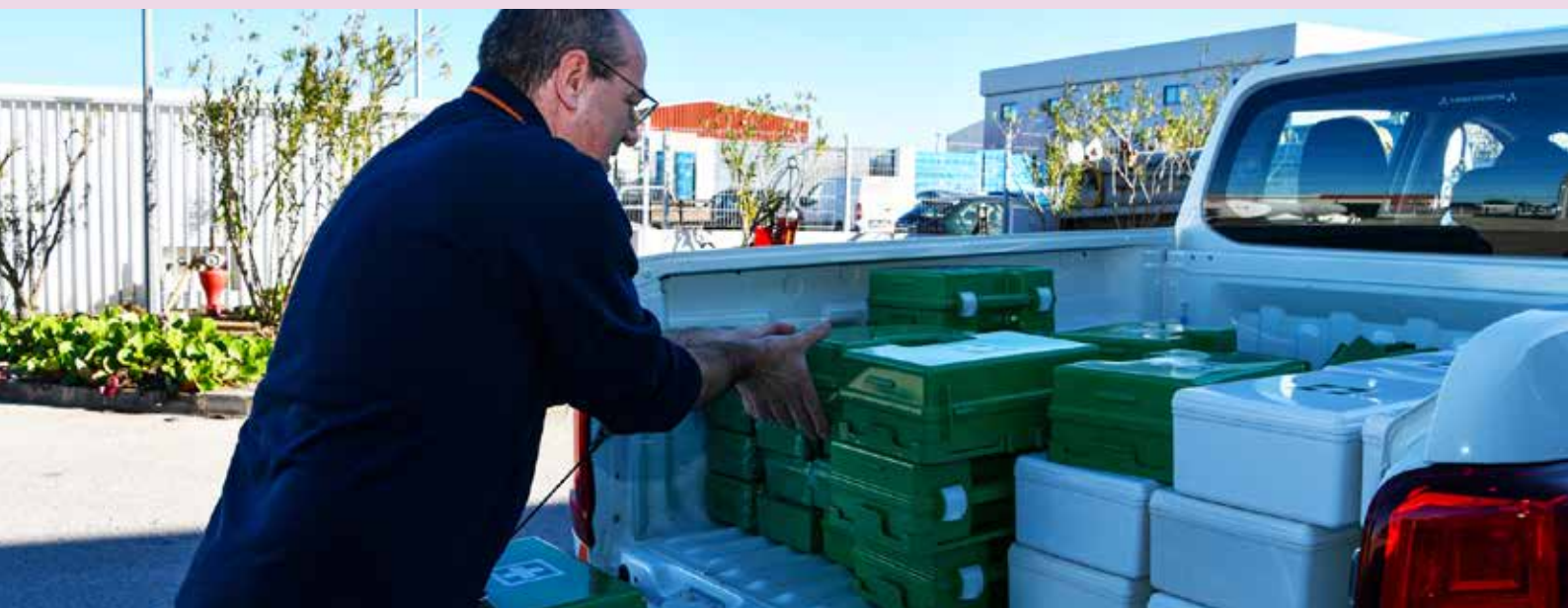
Reforço de equipamentos de primeiros socorros nos edifícios municipais