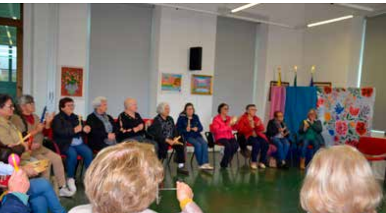
Chá com Letras em Nisa

“Sábados com Histórias” para crianças, o “Chá com Letras” para toda a população, e o “Leituras e Memórias” para utentes das IPSS's.