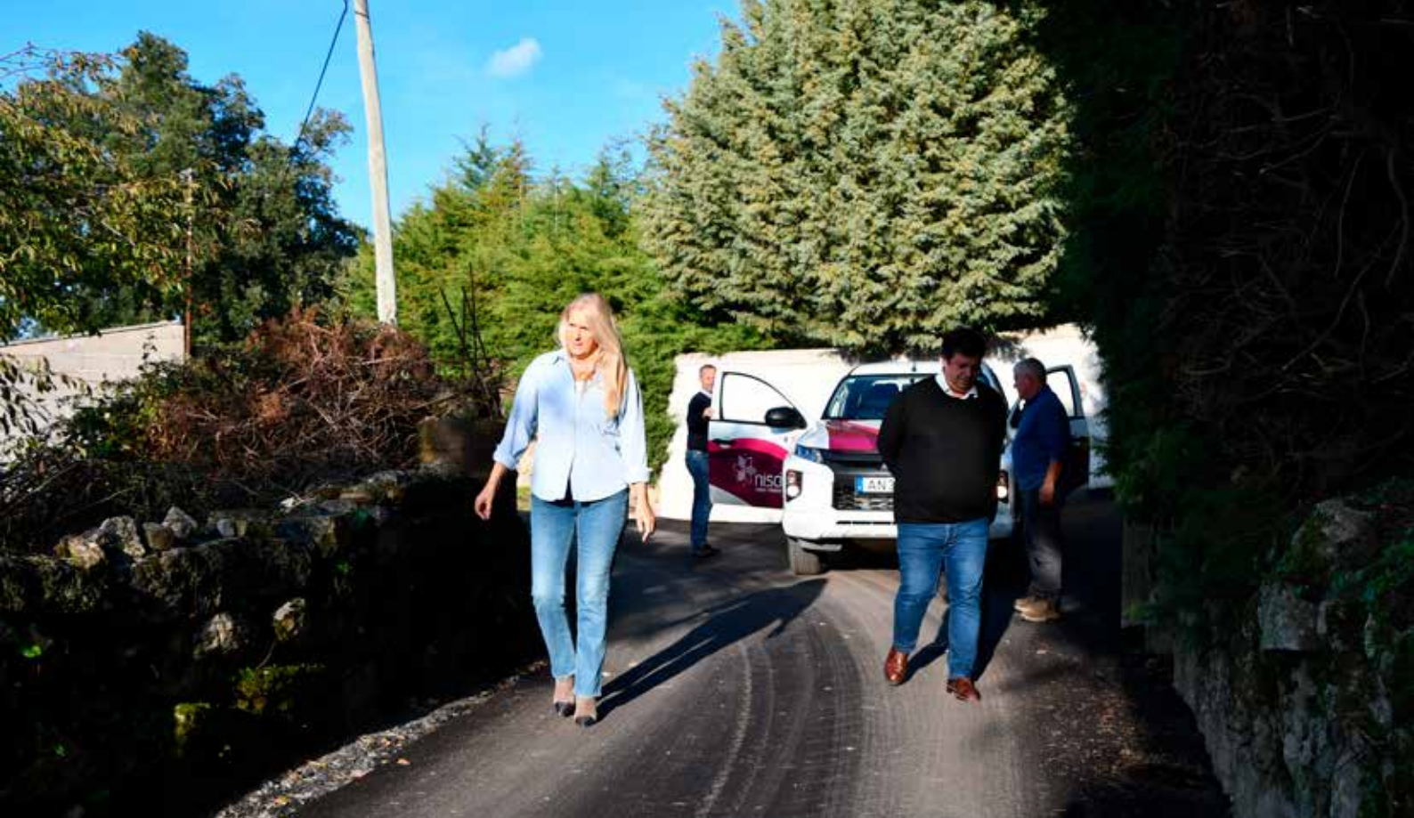
NISA Pavimentação da Azinhaga da Fonte do Cão e Azinhaga da Água - Valor: 40.105,88 € + IVA