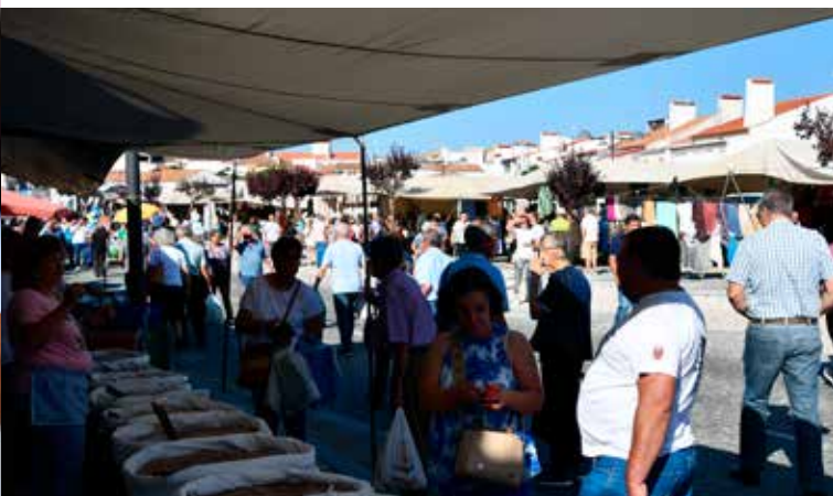
Feira no Largo da Devesa em Nisa