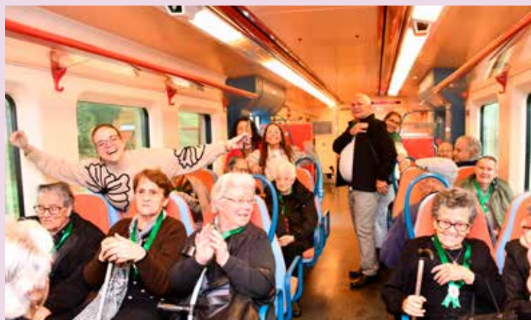
Viagem de comboio dos idosos do C. S. de Santana