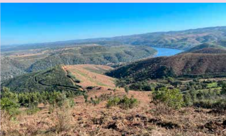
Reabilitação de ecossistemas