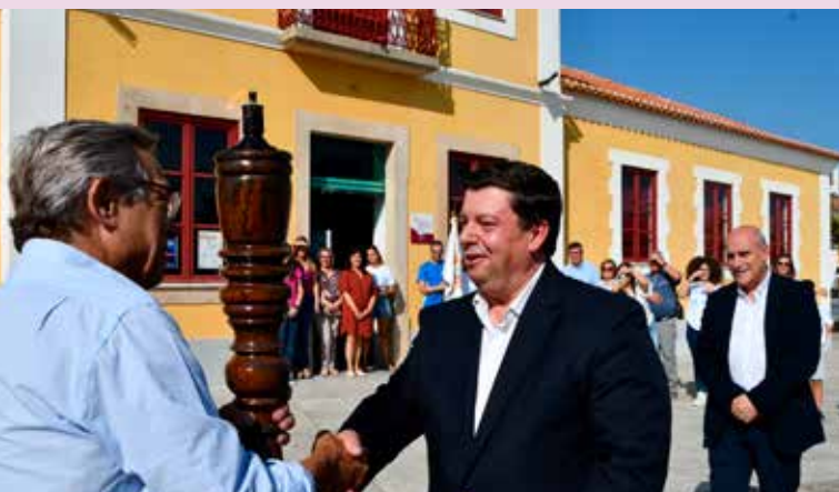
XVI Festa da Solidariedade em Nisa

e colaboradores das IPSS's do concelho, bem como de alunos do Agrupamento de Escolas de Nisa que se juntaram a esta ação solidária.