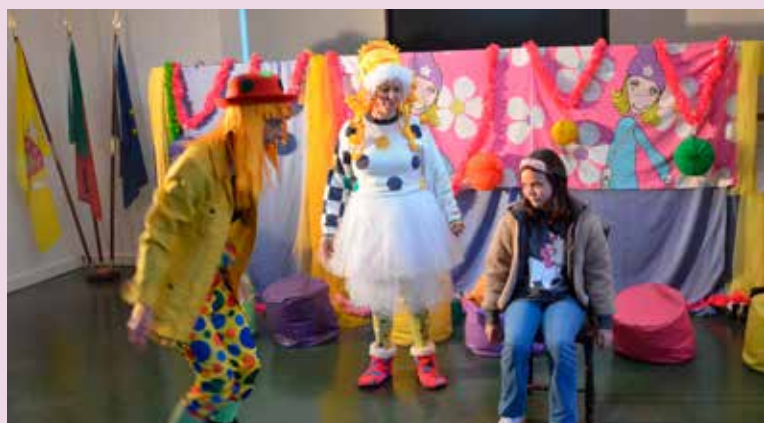
Sábados com Histórias