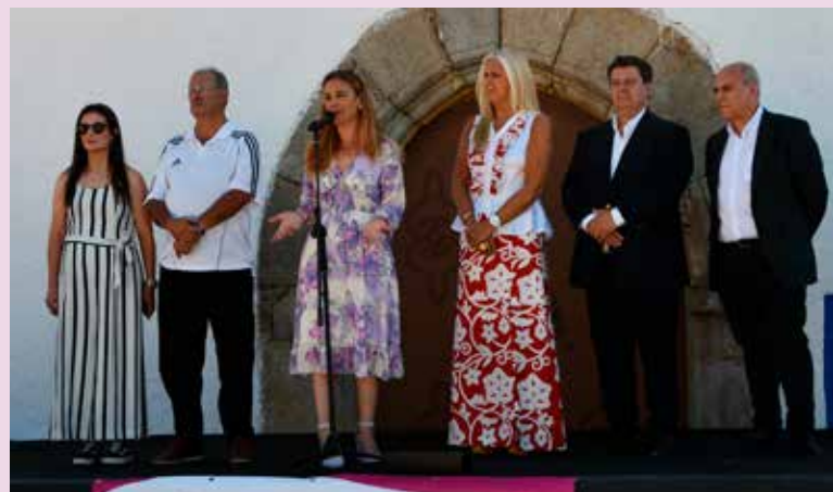
I Feira do Mel em Montalvão