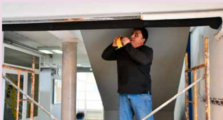
NISA - Substituição de canalização no Pavilhão Desportivo