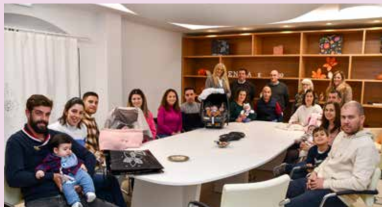
Entrega de cheques no âmbito do programa “Nascer em Nisa”