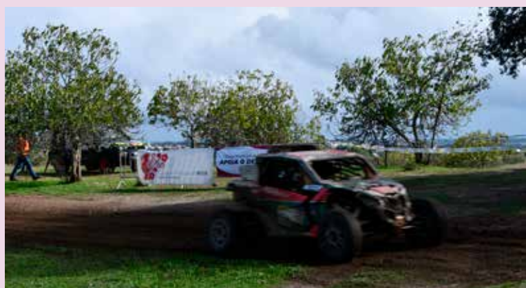
37ª Baja Portalegre no Concelho de Nisa