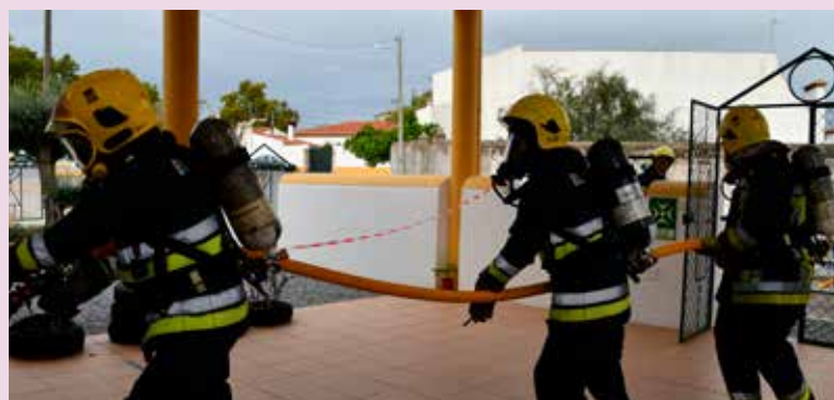
Simulacro na Creche em Alpalhão