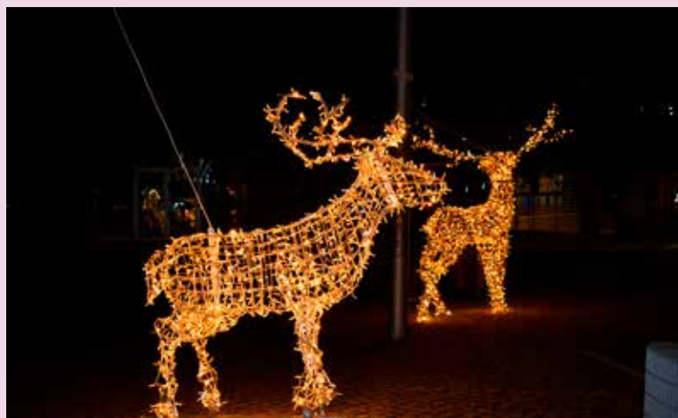
Iluminações na Praça da República