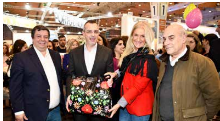
Oferta ao Presidente da ERTAentejo