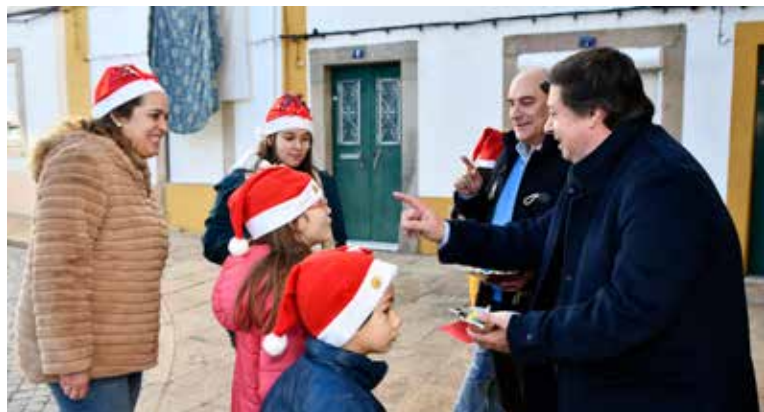
Academia de Férias de Natal Distribuição de postais de Natal