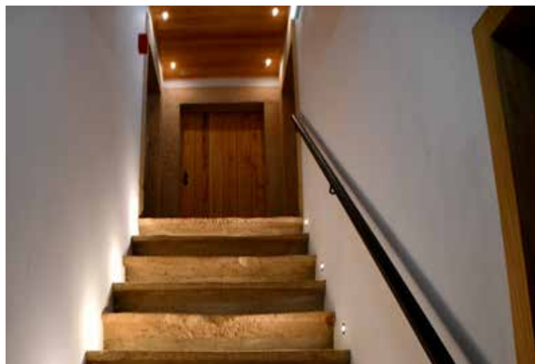
NISA - Interior da "Casa das Memórias" (Cadeia Velha) - Valor: 535.201,97 € + IVA