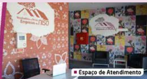
■ Espaço de Atendimento