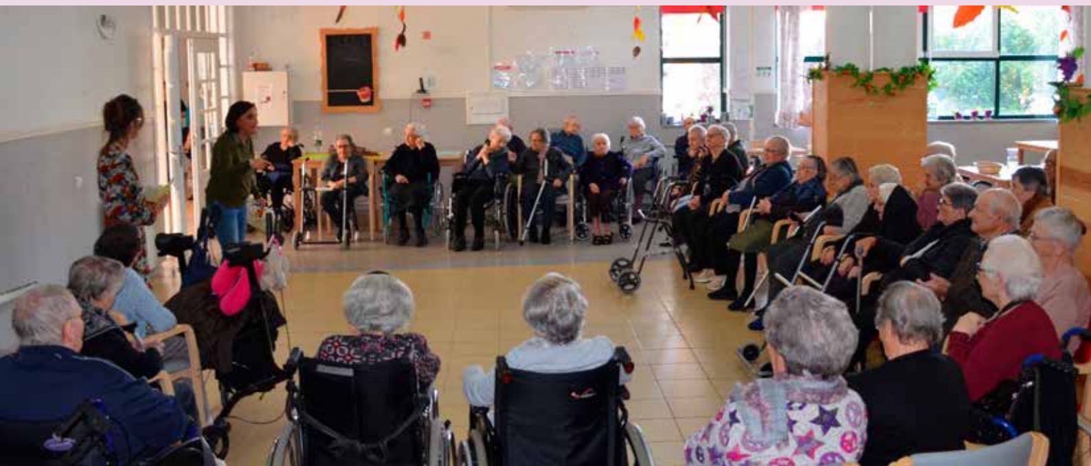
Leituras e Memórias