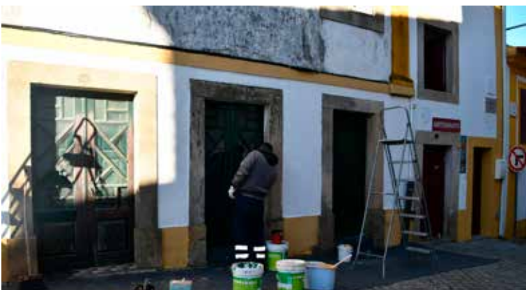
NISA - Pintura de edifício no Centro Histórico