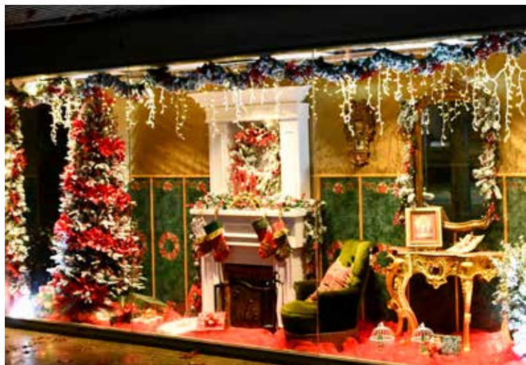
Montra do Posto de Turismo de Nisa