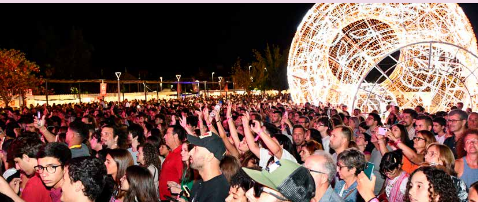
Milhares de visitantes no Nisa em Festa