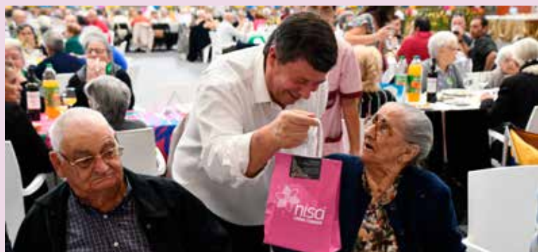
Dia do Respeito pela Pessoa Idosa