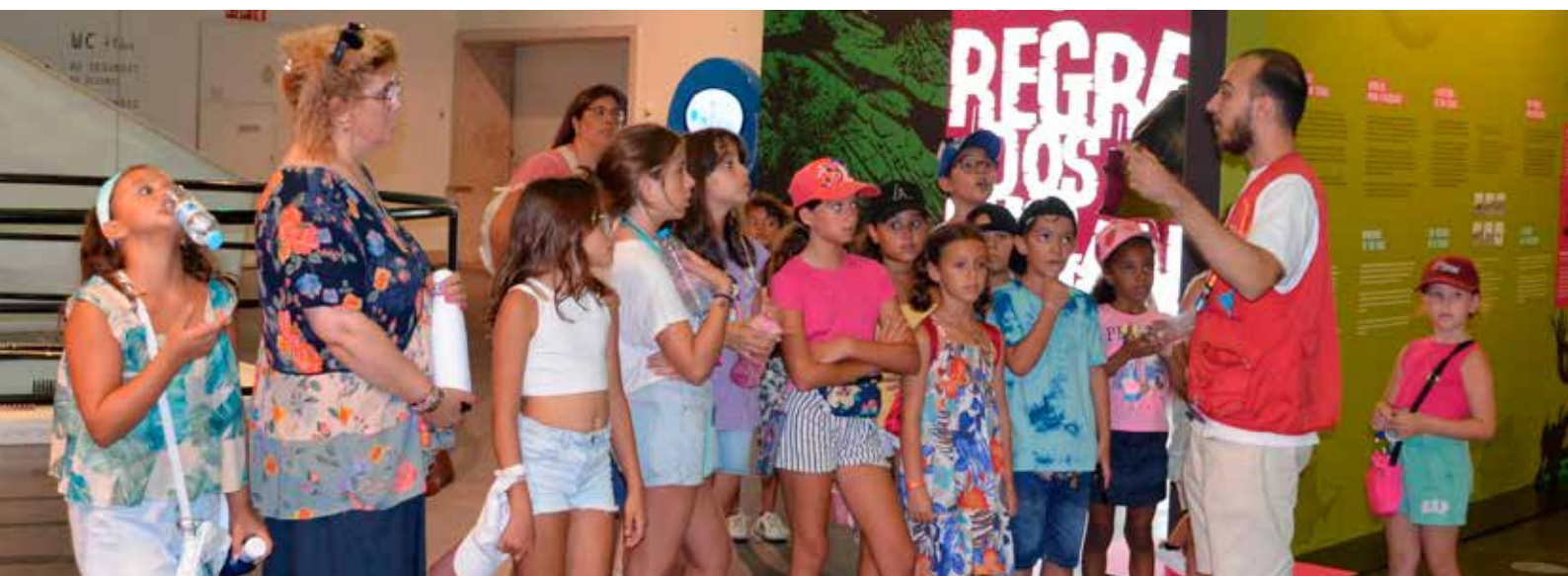
Academia de Férias de Verão - Visita aos Dino Parque