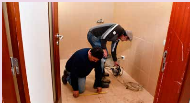
NISA Intervenção no Complexo Termal