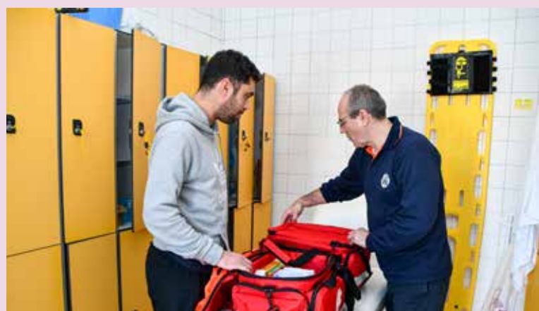
Reforço de equipamentos de primeiros socorros