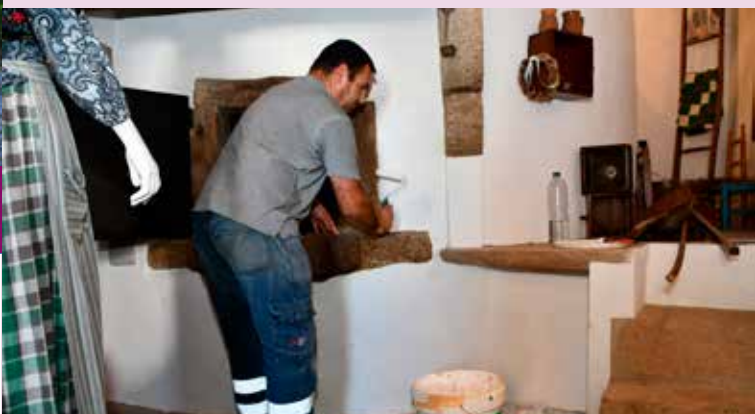
NISA Pintura da Casa do Forno