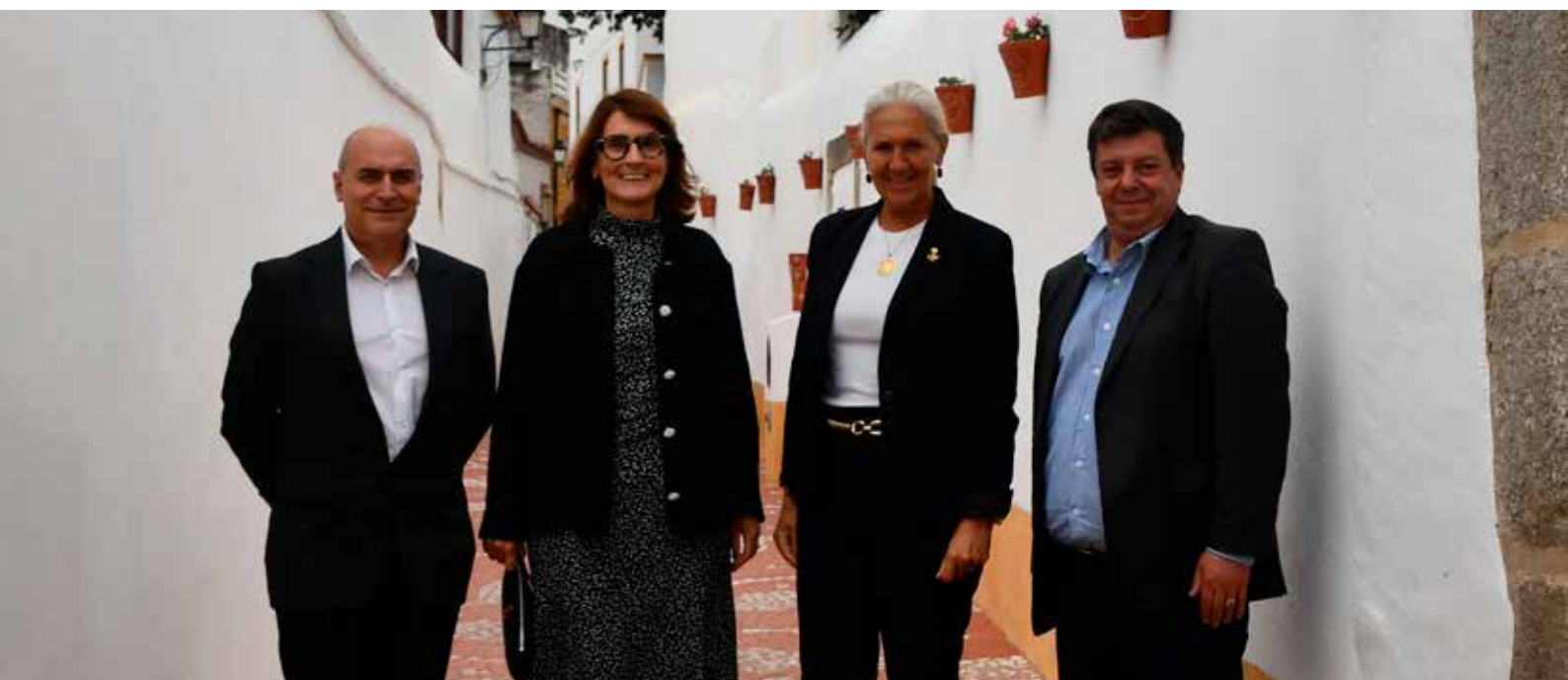
Visita da Ministra da Justiça a Nisa

Justiça, Professora Doutora Catarina Sarmento e Castro, no âmbito da reabilitação do Tribunal de Nisa, e o Senhor Ministro da Saúde, Dr. Manuel Pizarro, junto do qual reclamámos algumas medidas para a melhoria da condição de vida da população do Concelho.