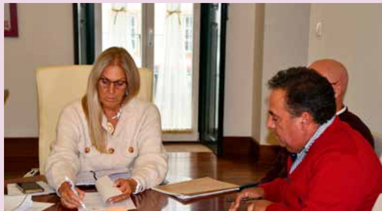
Assinatura de protocolo com a SMN