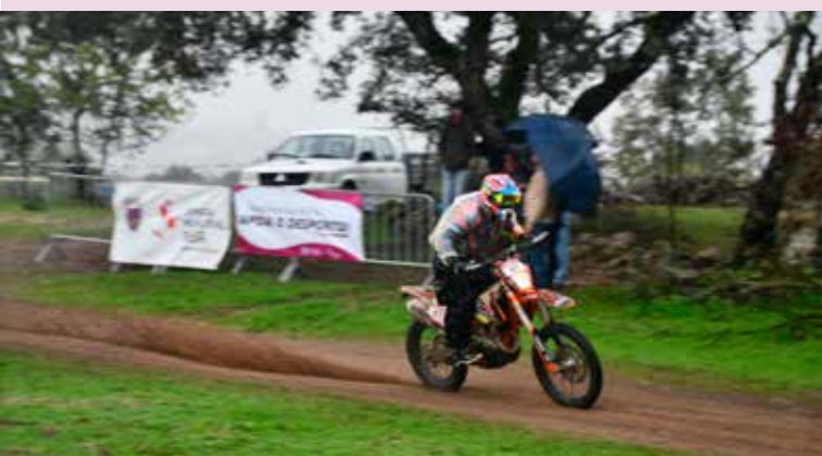
37ª Baja Portalegre no Concelho de Nisa