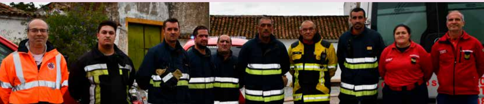
Simulacro na Creche em Alpalhão

É também com o objetivo de robustecer o Serviço de Proteção Civil do nosso Concelho que nos mantemos ao lado dos nossos bombeiros aos quais oferecemos uma nova ambulância, fruto de um investimento superior a 88 mil euros.