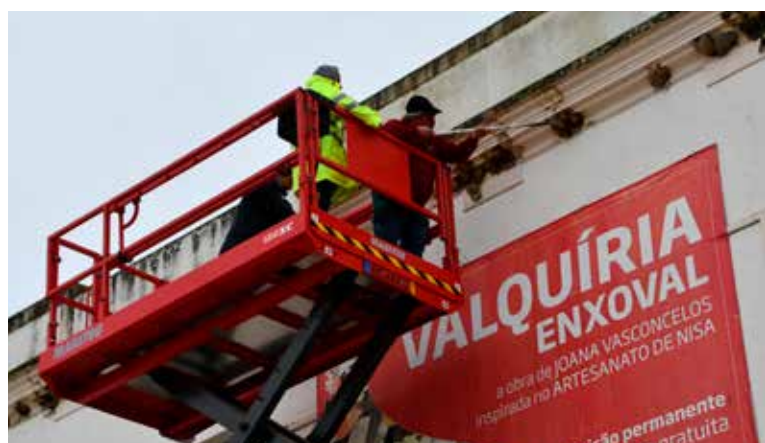
Nova plataforma elevatória em funcionamento