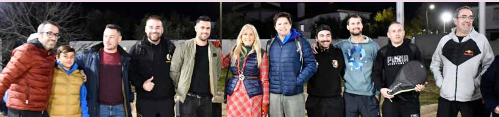
Inauguração dos Campos de Padel em Nisa