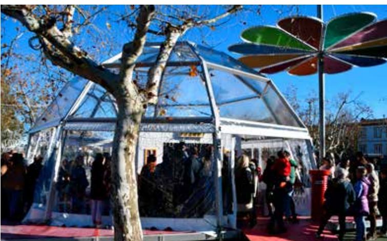
Igloo na Praça da República