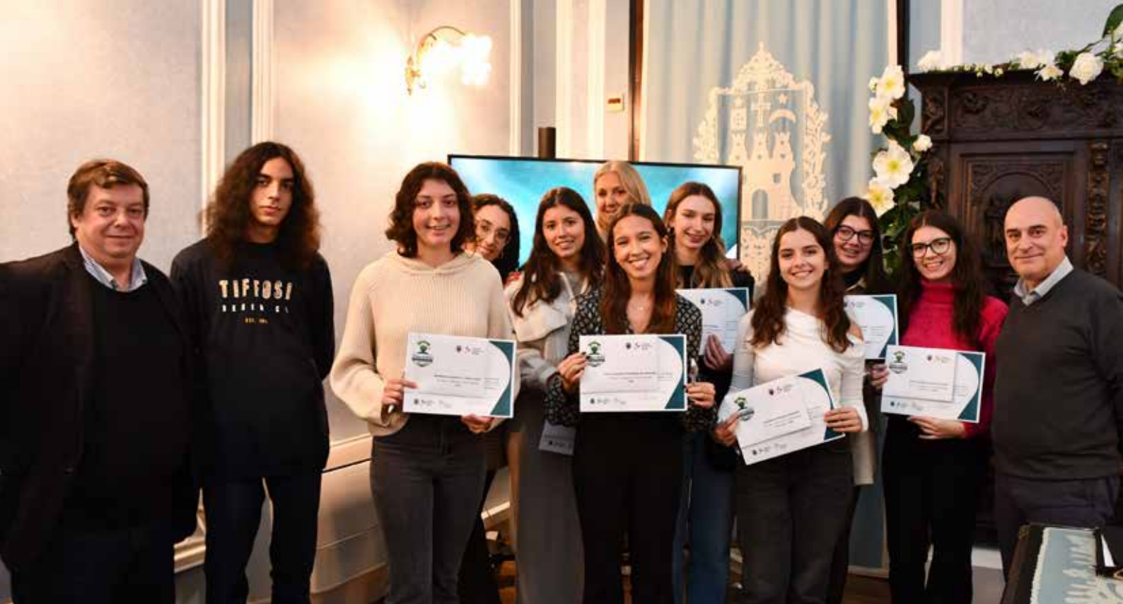
Entrega de Prémios de Mérito Escolar 2022/2023