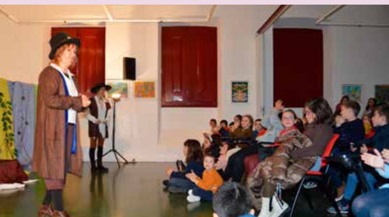
Sábados com Histórias