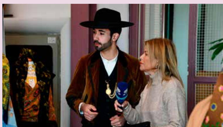
“Praça da Alegria” (RTP) em Nisa