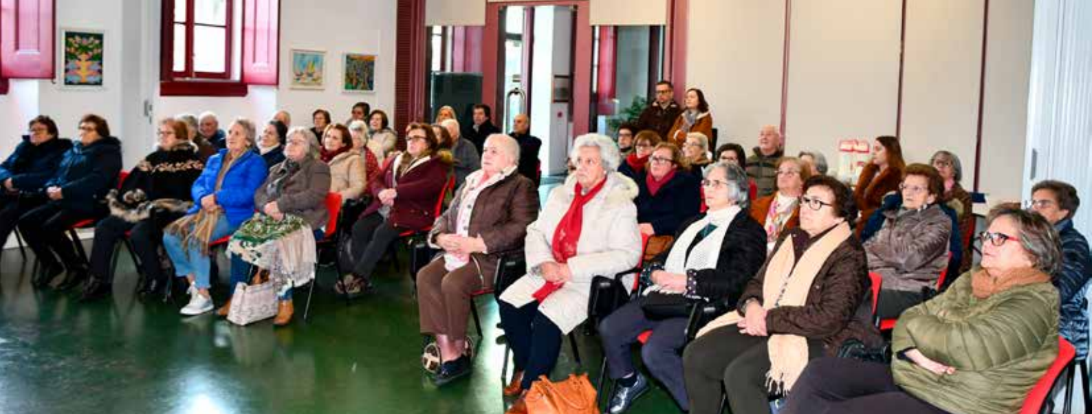
Chá com Letras