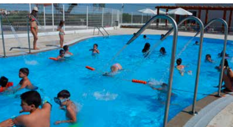
Academia de Férias de Verão - Piscina de Tolosa