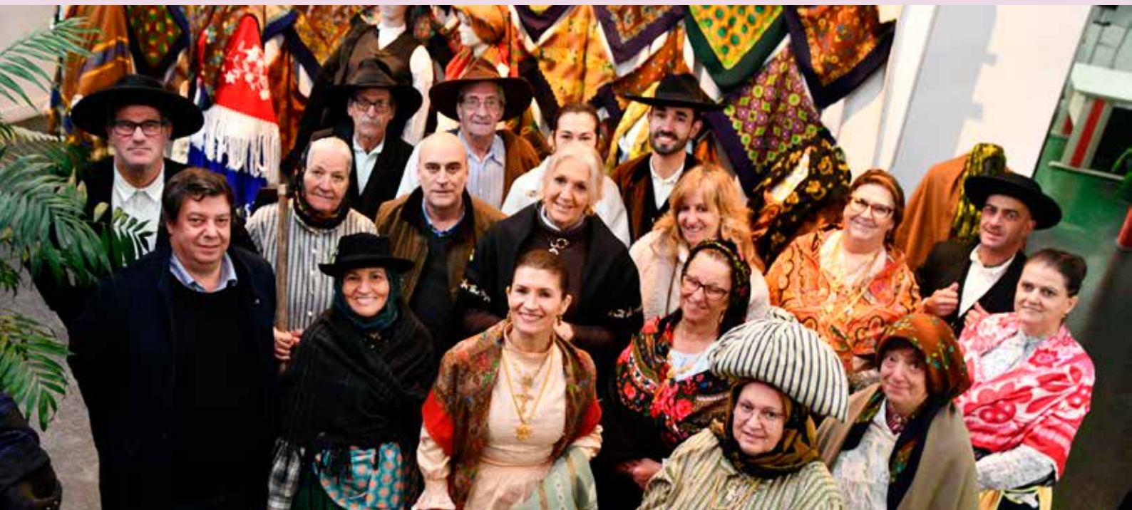
Inauguração da Exposição “A riqueza do nosso traje”