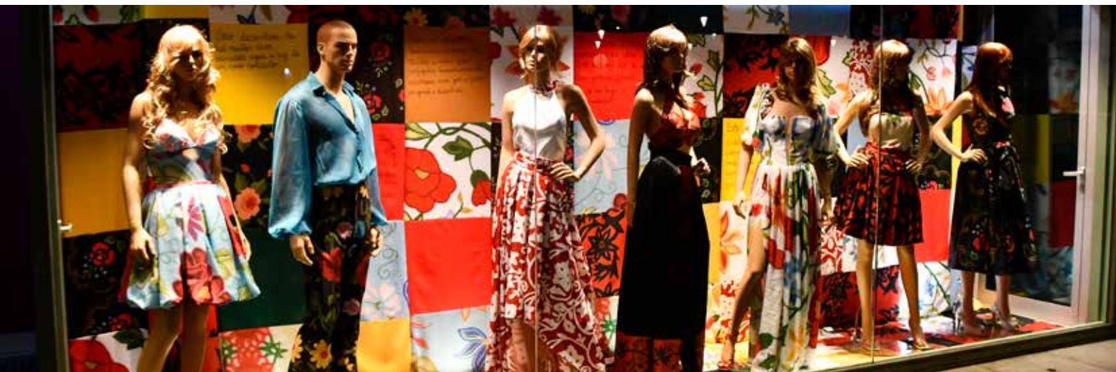
Montra do Posto de Turismo de Nisa