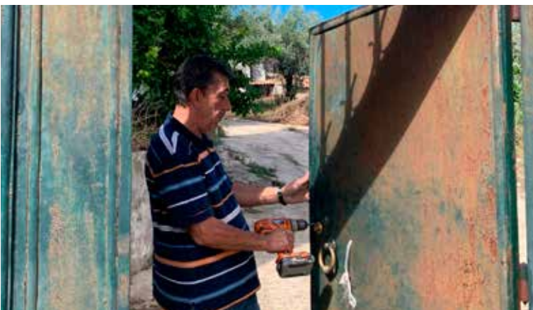
Oficina Móvel Social

particularmente para os mais vulneráveis, para as pessoas com mais de 65 anos, portadores de deficiência, indivíduos isolados ou inseridos em agregados familiares em situação socioeconómica precária.