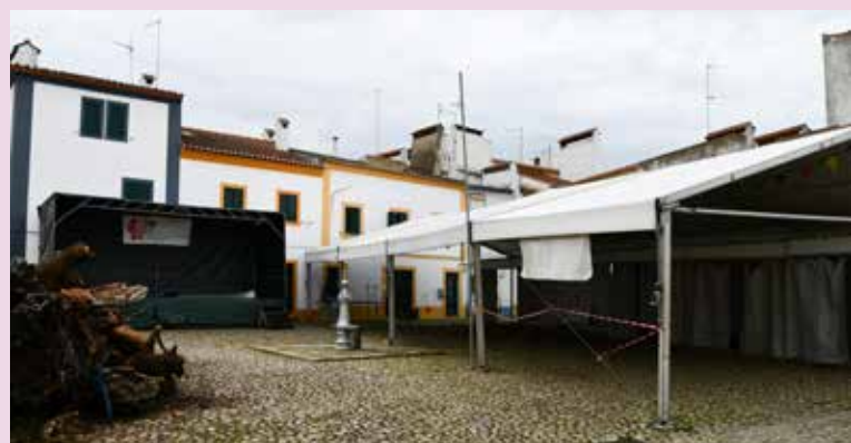
Festa do Mártir Santo em Nisa