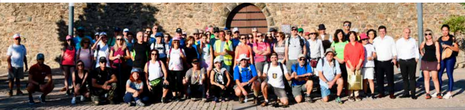
Caminhada "Do Castelo de Amieira ao Miradouro Transparente" em Amieira do Tejo