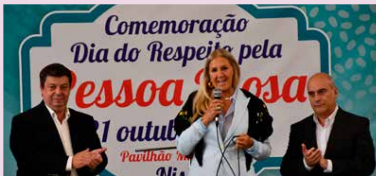
Dia do Respeito pela Pessoa Idosa