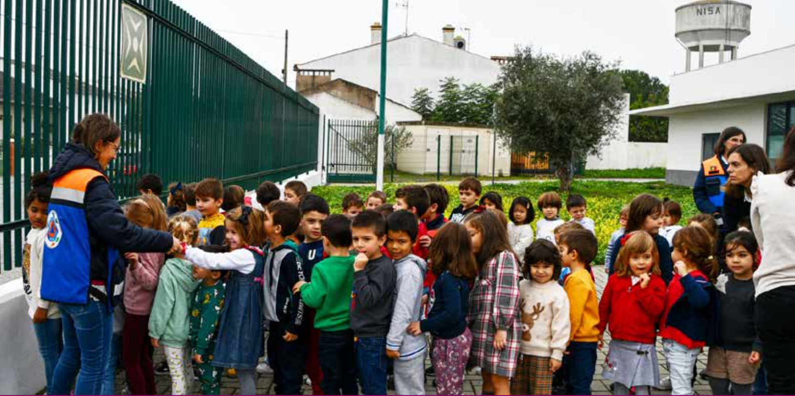
Exercício de simulacro sísmico "A Terra Treme"