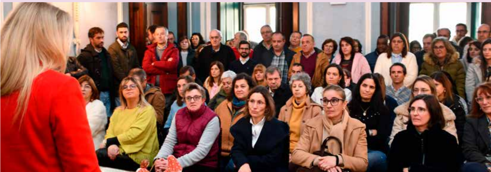
Entrega de cabazes de Natal aos funcionários municipais

trabalho diário dos funcionários municipais, nomeadamente através da renovação do parque de viaturas que pelo desgaste ou impedimentos legais perdem a utilidade, ou na aquisição de equipamentos que tornam o parque municipal mais versátil e autónomo, assegurando a formação técnica essencial ao desenvolvimento dos serviços.