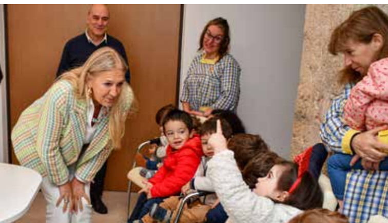
Oferta dos Santinhos