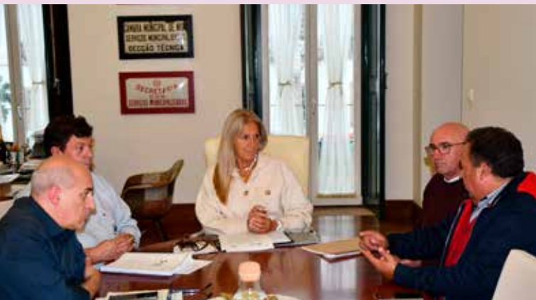
Assinatura de protocolo com a SMN