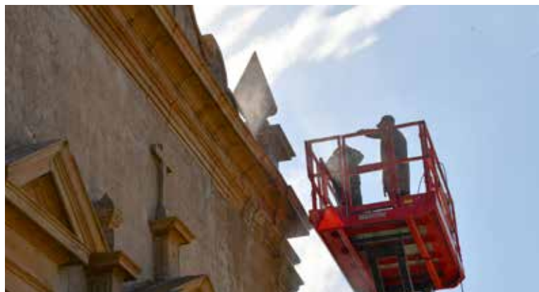
AMIEIRA DO TEJO Limpeza da Capela do Calvário