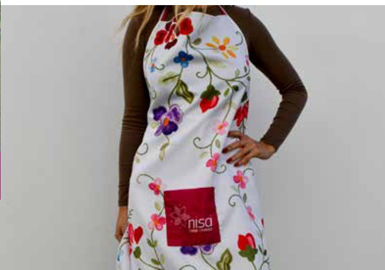
Novo merchandising da marca "éNisa éNosso"