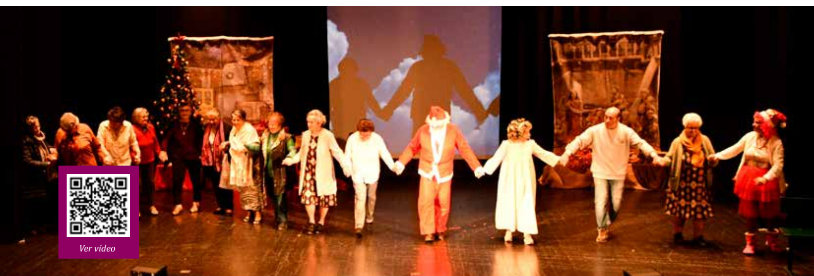
Peça de teatro da Universidade Sénior de Nisa