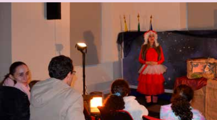
Sábados com Histórias