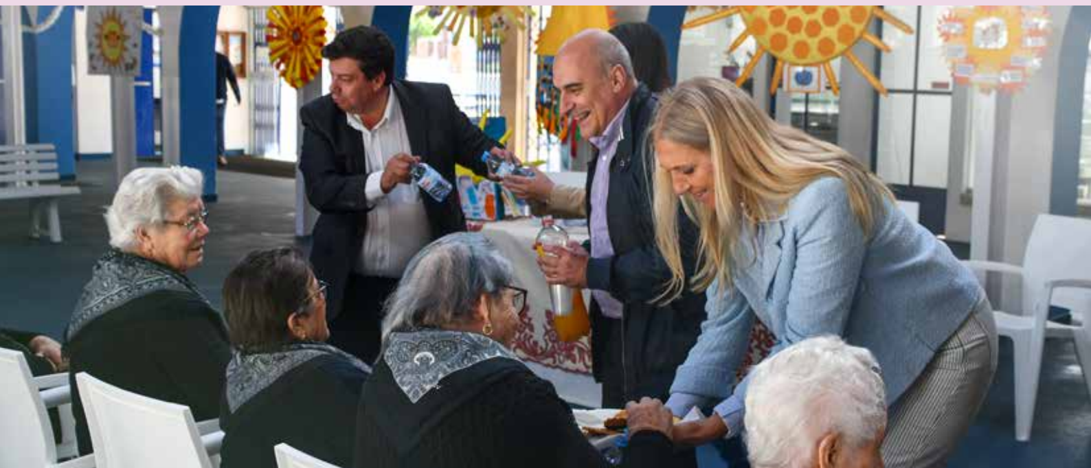
Celebração do Dia da Igualdade e o Dia da Erradicação da Pobreza