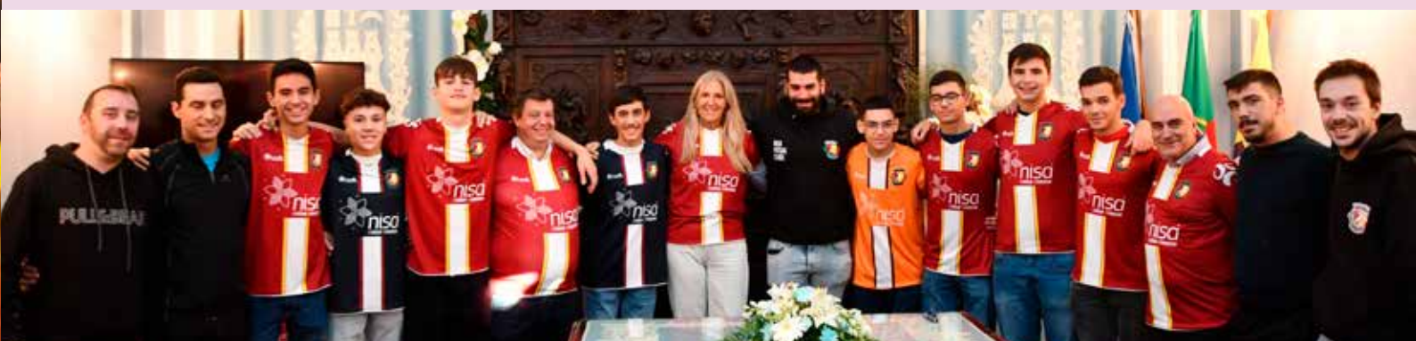
Entrega de equipamentos ao Nisa Futsal Clube