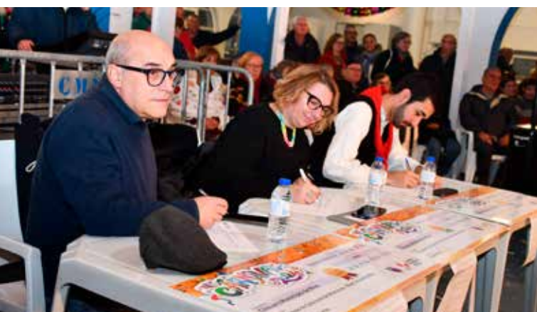
Concurso de Máscaras - Júri