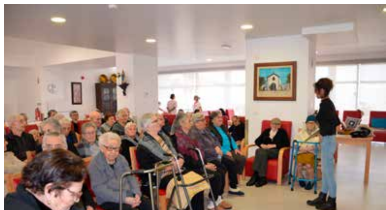
Leituras e Memórias