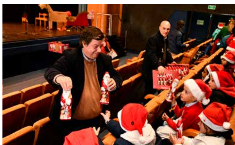
Festas de Natal do Agrupamento de Escolas