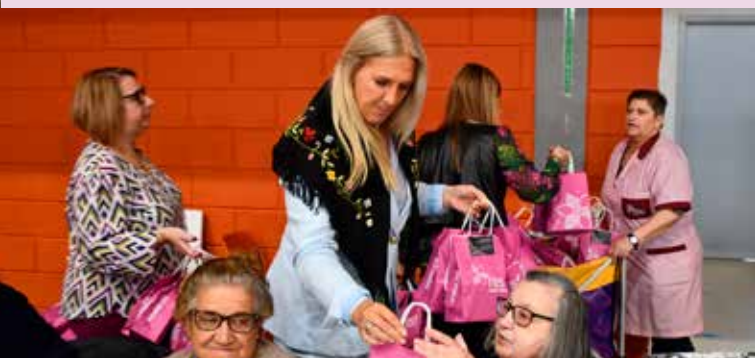
Dia do Respeito pela Pessoa Idosa