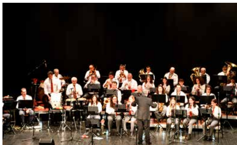
Concerto de Boas Festas da SMN