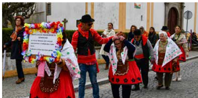
IPSS's no Desfile de Carnaval