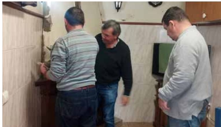
Oficina Móvel Social