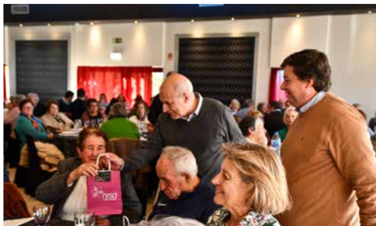
Almoço de Natal da Universidade Sénior de Nisa