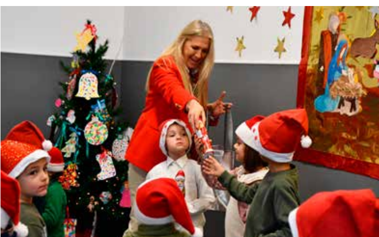
Festas de Natal do Agrupamento de Escolas