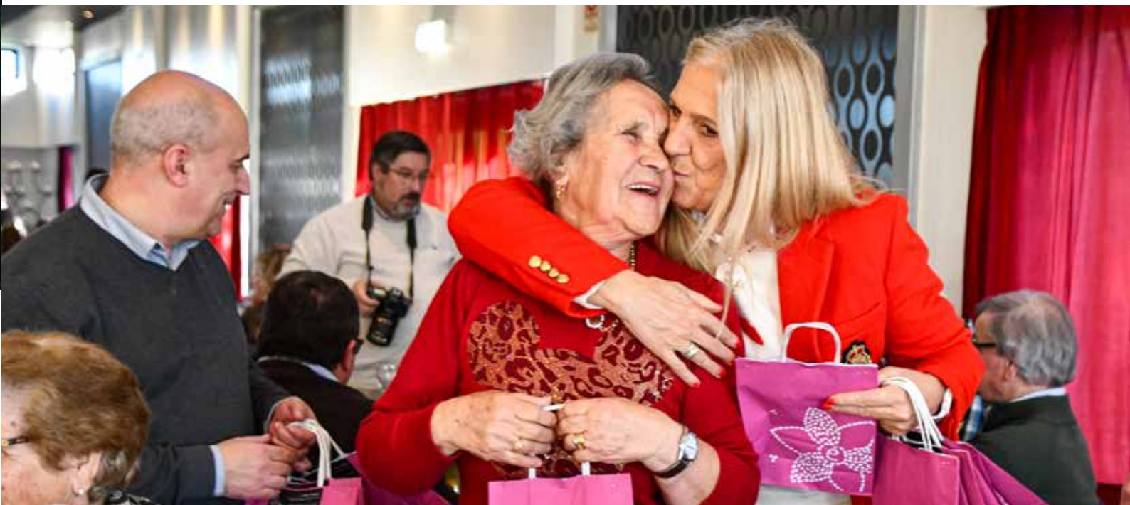
Almoço de Natal da Universidade Sénior de Nisa

Com mais de duas centenas de alunos, a Universidade Sénior de Nisa mantém a sua missão de gerar uma ocupação saudável de pessoas do Concelho com 55 e mais anos, que frequentam aulas de música, teatro, ginástica, informática, entre outras.