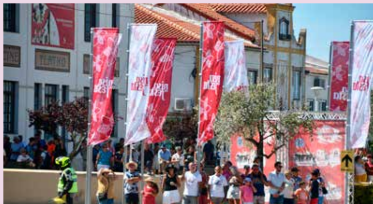
83ª Volta a Portugal em Nisa