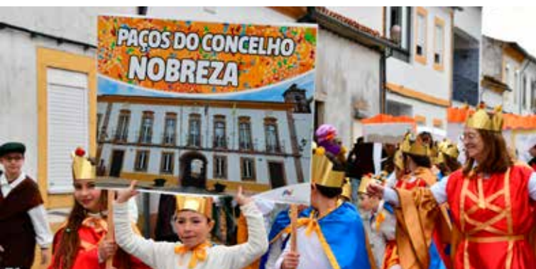
Agrupamento de Escolas no Desfile de Carnaval