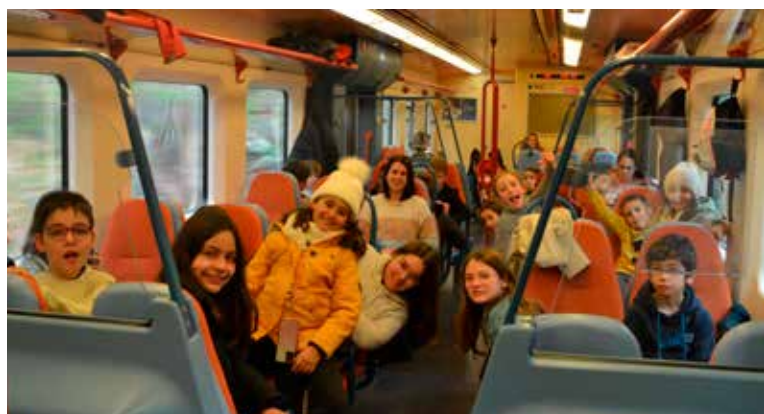
Academia de Férias de Natal - Viagem de comboio