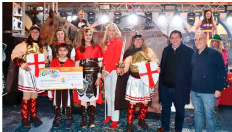
Concurso de Máscaras 3º Prémio "Cavalo de Tróia"