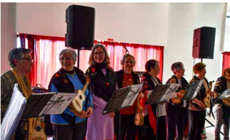
Grupo de Música no almoço de Natal da Universidade Sénior de Nisa

equipamentos de imagem, mobiliário adequado ao funcionamento das aulas e beneficiação com decoração a preceito, por forma a torná-las agradáveis e confortáveis.