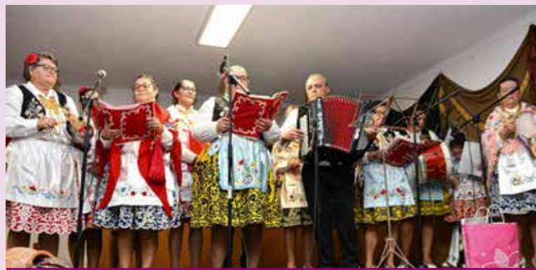
III Encontro de Cantares de Saias do Rancho das Cantarinhas de Nisa