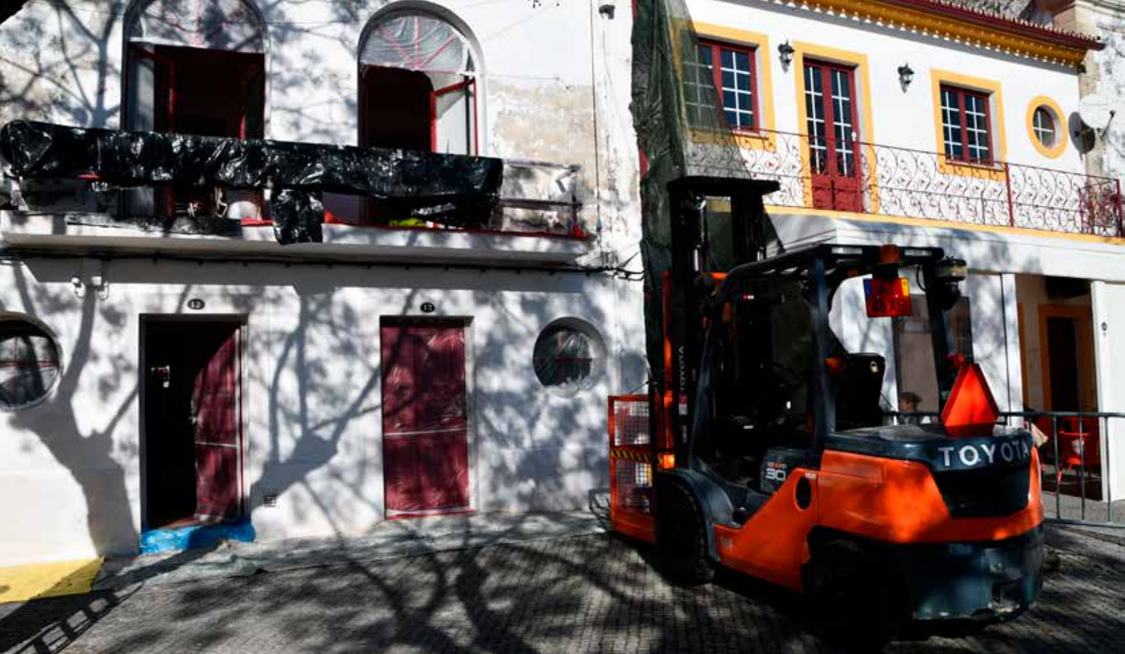
NISA Beneficiação da sede da Universidade Sénior de Nisa