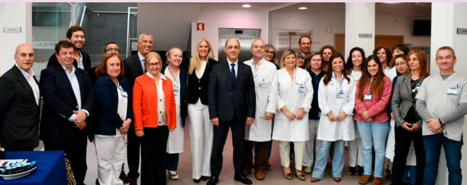
Ministro da Saúde conheceu a realidade do Centro de Saúde de Nisa

A saúde ganhou papel de destaque na política municipal, através da comparticipação em 50% dos medicamentos através do Cartão Municipal do Idoso ou, mais recentemente, com a implementação de um Seguro Municipal de Saúde gratuito para todos os munícipes com mais de 18 anos.