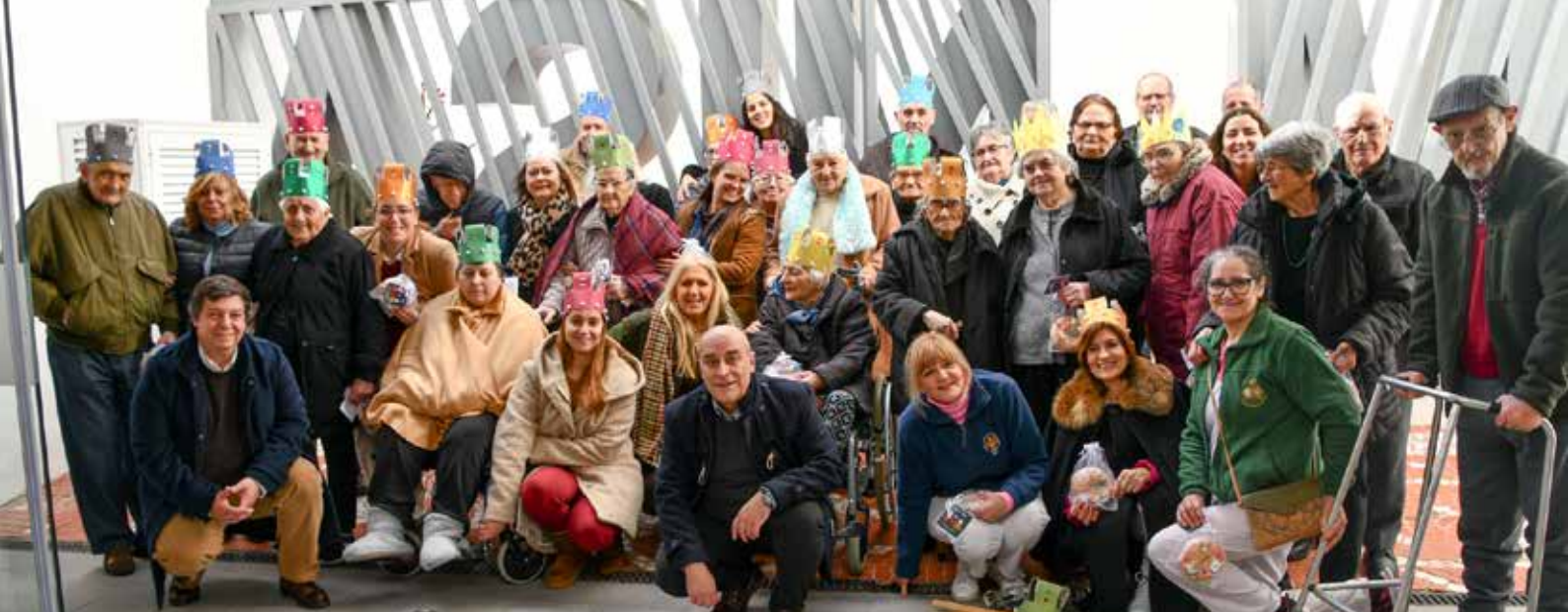
Santas Casas da Misericórdia de Nisa e Alpalhão cantam as "Janeiras" na Câmara Municipal