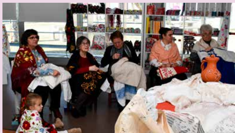
“Praça da Alegria” (RTP) em Nisa