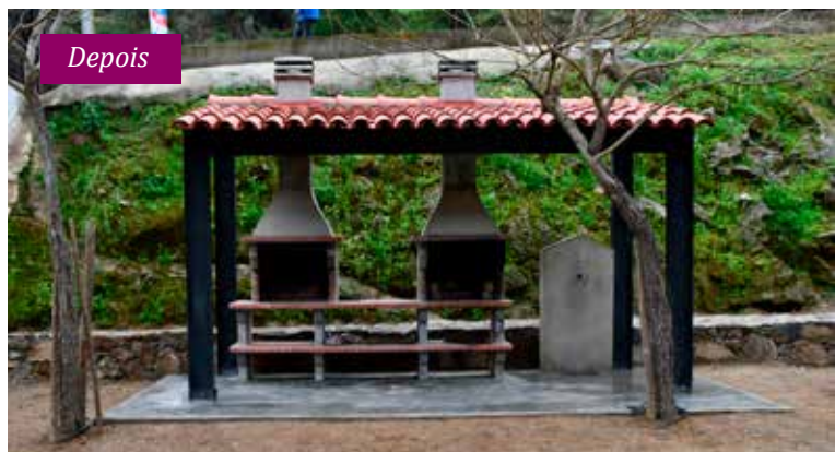
AMIEIRA DO TEJO - Beneficiação da zona de lazer - Valor: 20.089,00 € + IVA