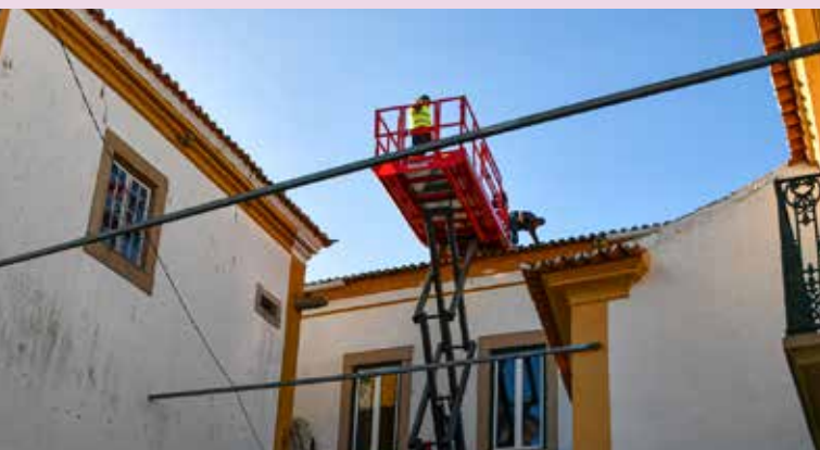
NISA - Limpeza do telhado dos Paços do Concelho