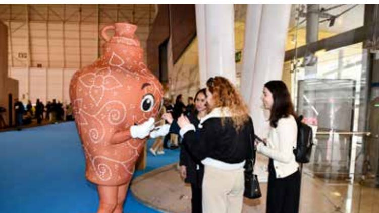
Bilhas encanta visitantes da BTL