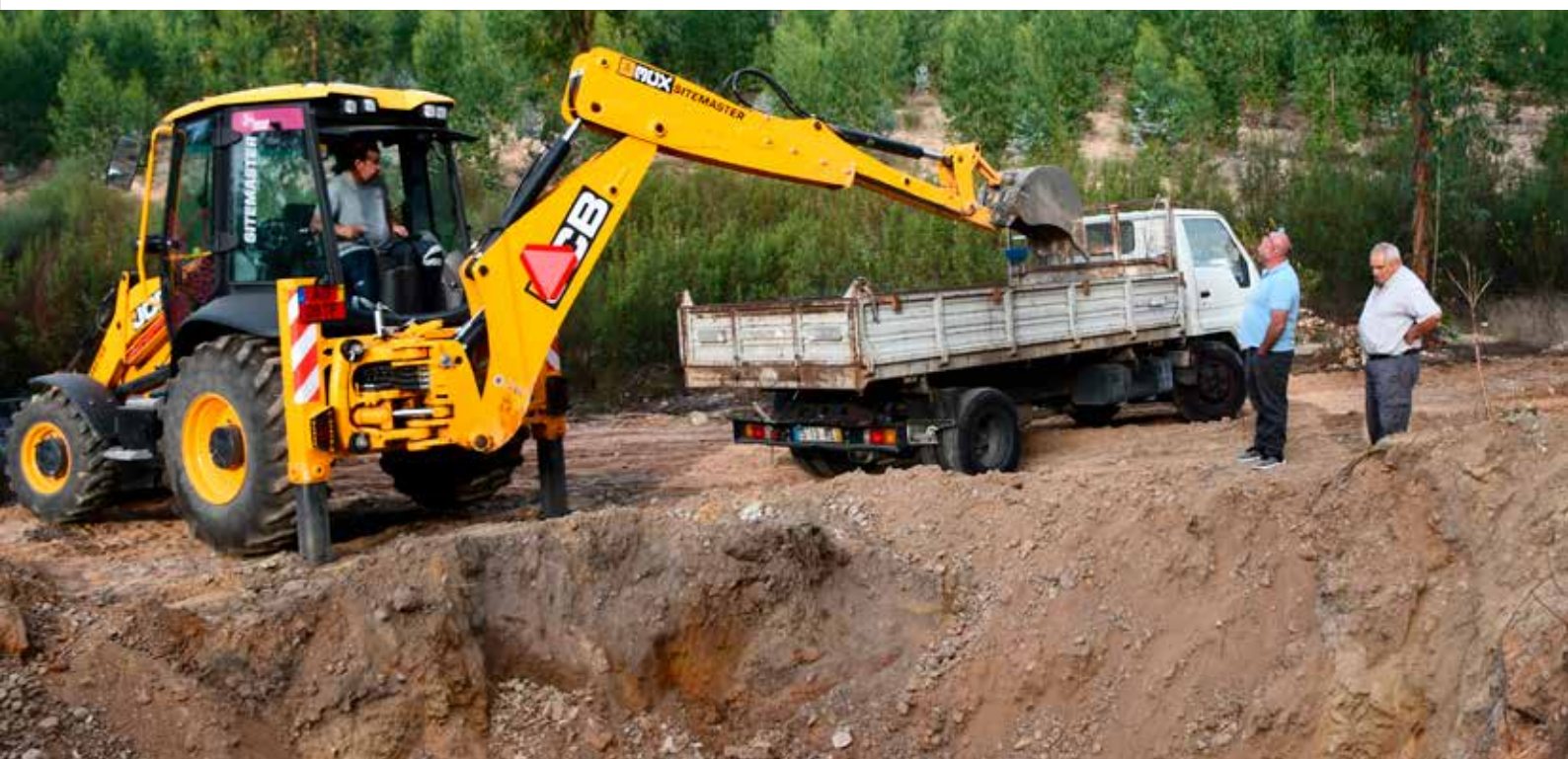
Extração de barro

disponibilizamos apoio logístico na extração de barro dando-lhe todas as condições para executar um trabalho único e diferenciador.