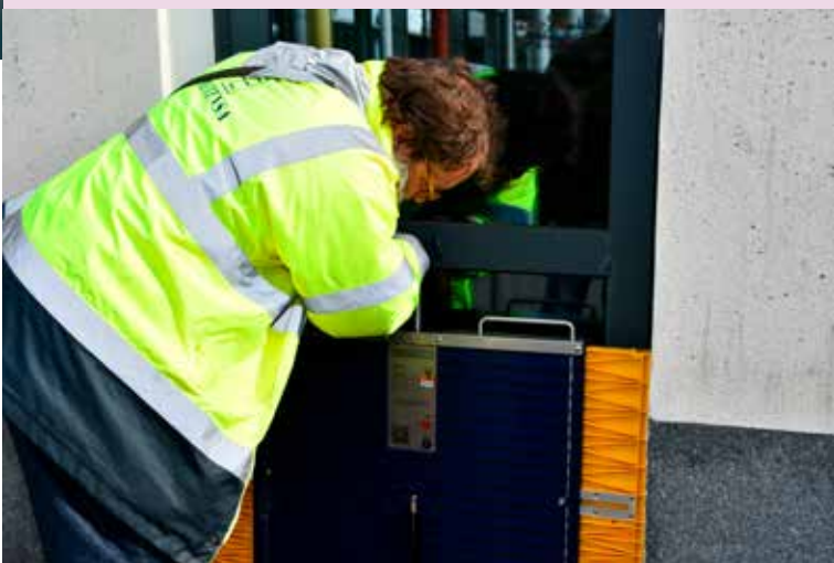
Instalação de Barreira Anti Inundação

da Pré-Primária de modo a impedir prejuízos associados a períodos de pluviosidade intensa e realizámos o habitual exercício cívico "A Terra Treme" que prevê a medidas de segurança a adotar em caso de sismo.