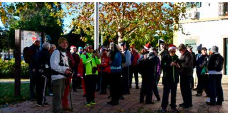
Caminhada "Roteiro das Fontes" em Nisa