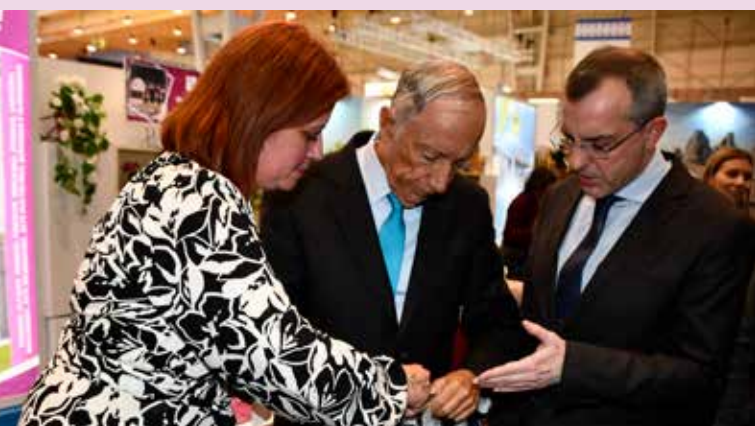
Presidente da República no stand de Nisa