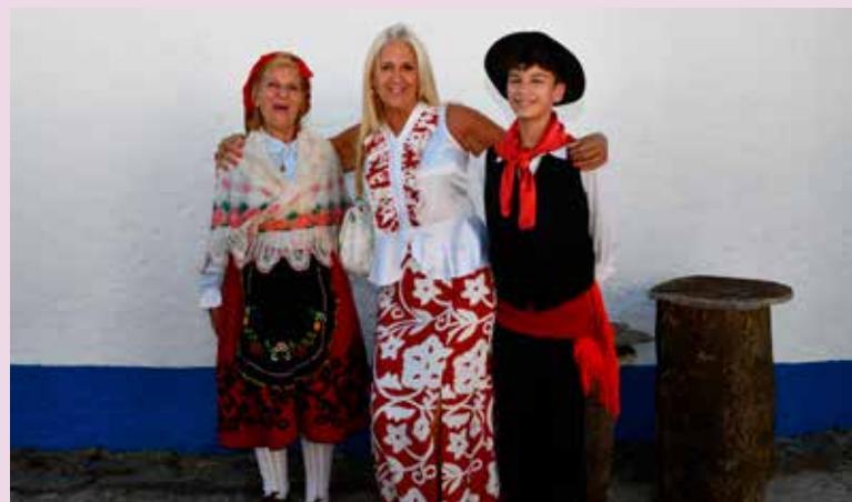
I Feira do Mel em Montalvão