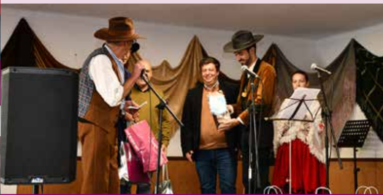
III Encontro de Cantares de Saias do Rancho das Cantarinhas de Nisa

A estes apoios diversificados acresce a anual oferta de subsídios às associações cujo plano de atividades o justifique, contribuindo desde logo para o desempenho dessas mesmas atividades.