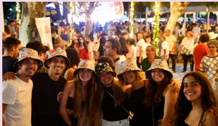
Oferta de panamás no Dia da Juventude