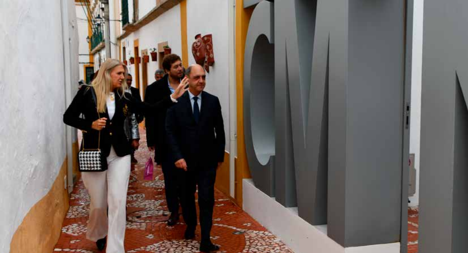
Visita do Ministro da Saúde a Nisa