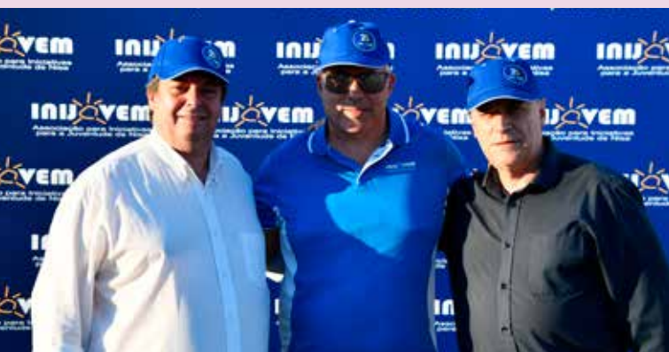
VII Trail da Vila de Nisa da Inijovem