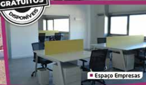
■ Espaço Empresas