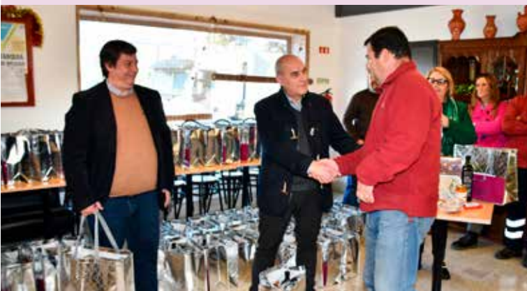
Entrega de cabazes de Natal aos funcionários municipais