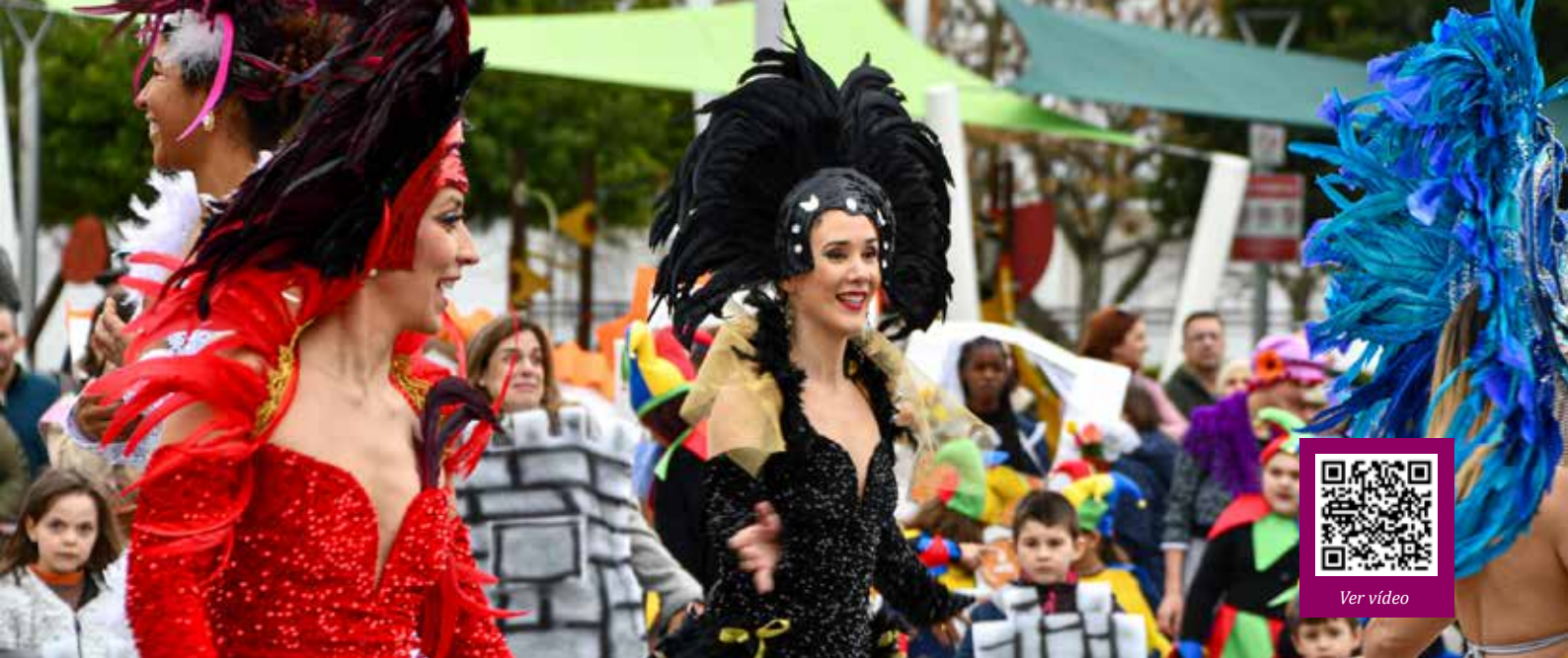
Animação de Carnaval na Praça da República