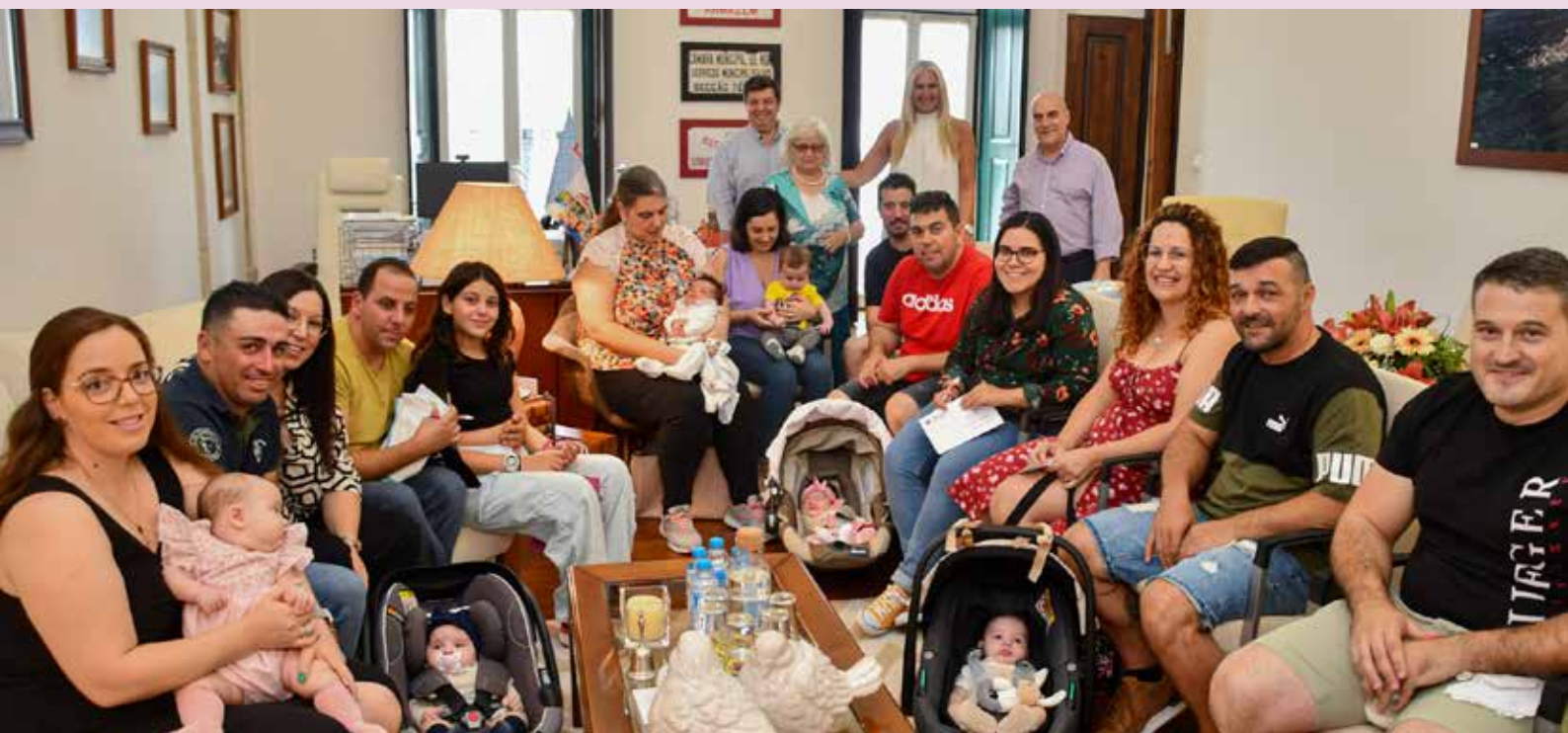
Entrega de cheques no âmbito do programa “Nascer em Nisa”