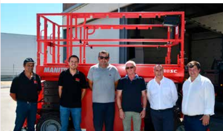
Aquisição de plataforma elevatória