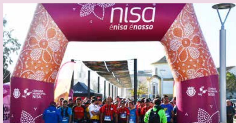
VII Trail da Vila de Nisa da Inijovem