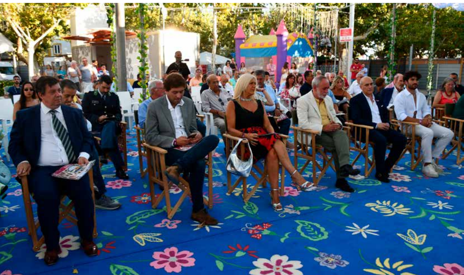
Inauguração do Nisa em Festa 2023

Um cartaz de luxo e o melhor de Nisa sob a égide da marca “éNisa éNosso” fizeram a melhor festa do verão – Nisa em Festa – que levou milhares à Praça da República, no coração da vila de Nisa, para assistir a concertos de luxo, degustar a melhor gastronomia e apreciar o nosso artesanato.