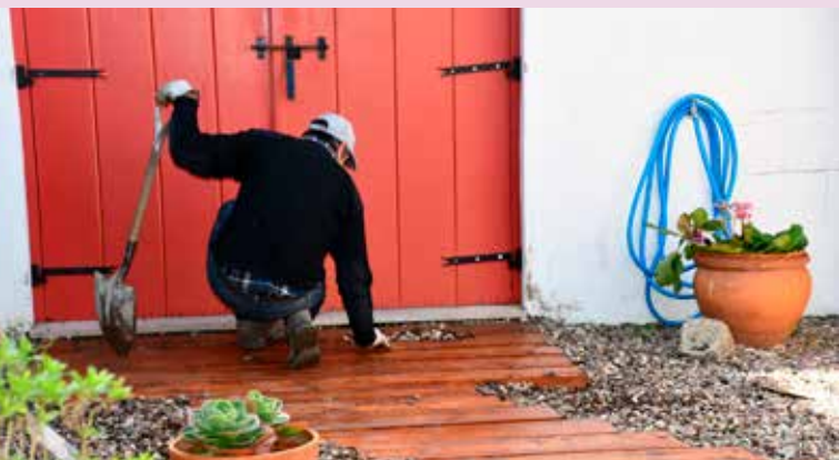
NISA - Substituição de passadiço no Núcleo do Bordado