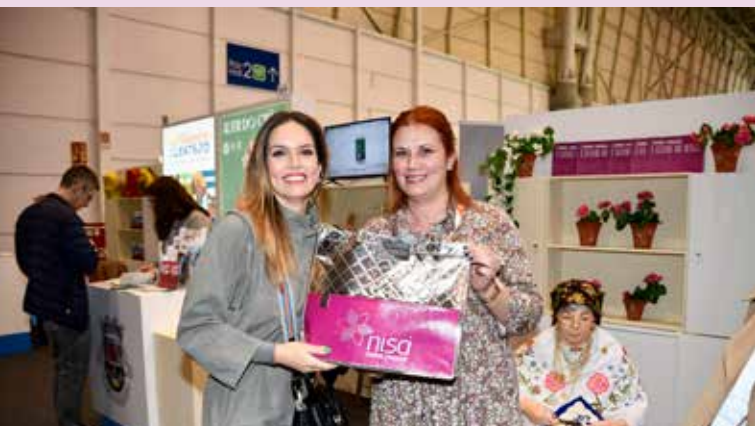
Stand de Nisa recebe figuras públicas