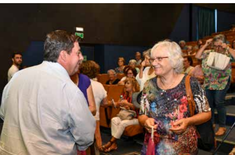
Abertura do ano letivo 2023-24 da Universidade Sénior de Nisa