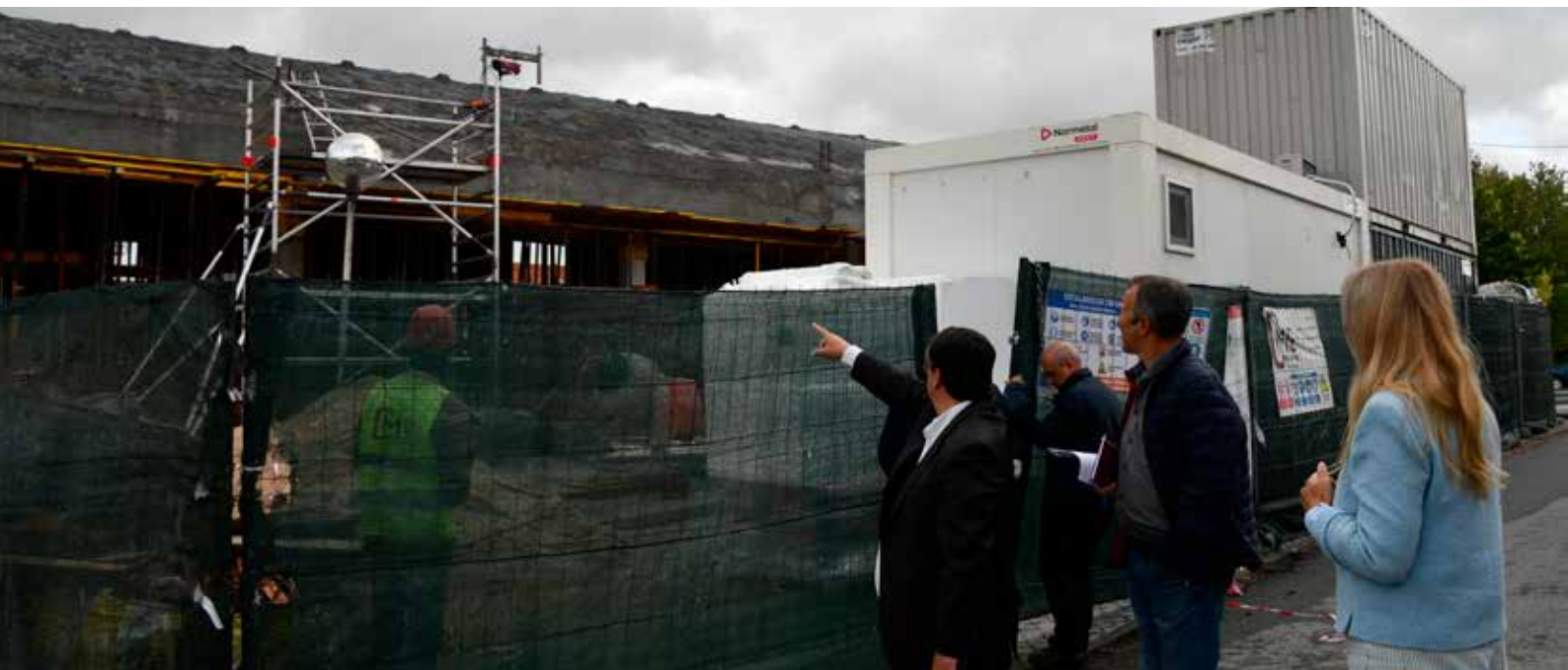
ALPALHÃO - Construção da Nova Extensão de Saúde - Valor: 377.810,73 € + IVA