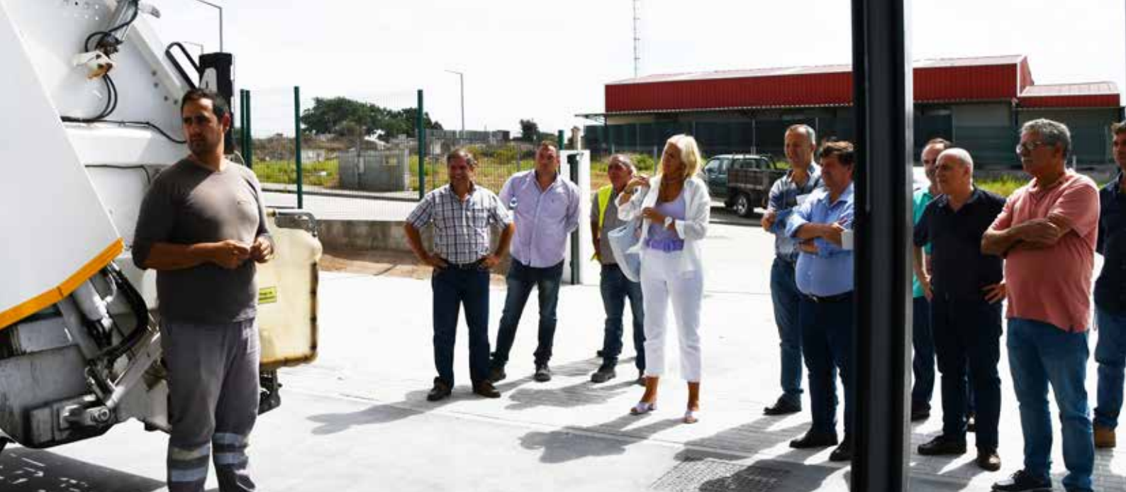
Formação sobre o novo Centro de Lavagem de Viaturas Municipais