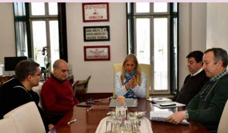
Assinatura de contrato de trabalho