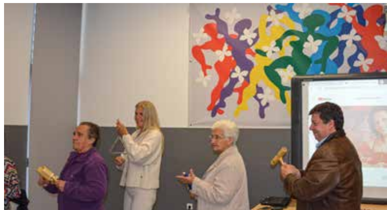
Chá com Letras em Alpalhão