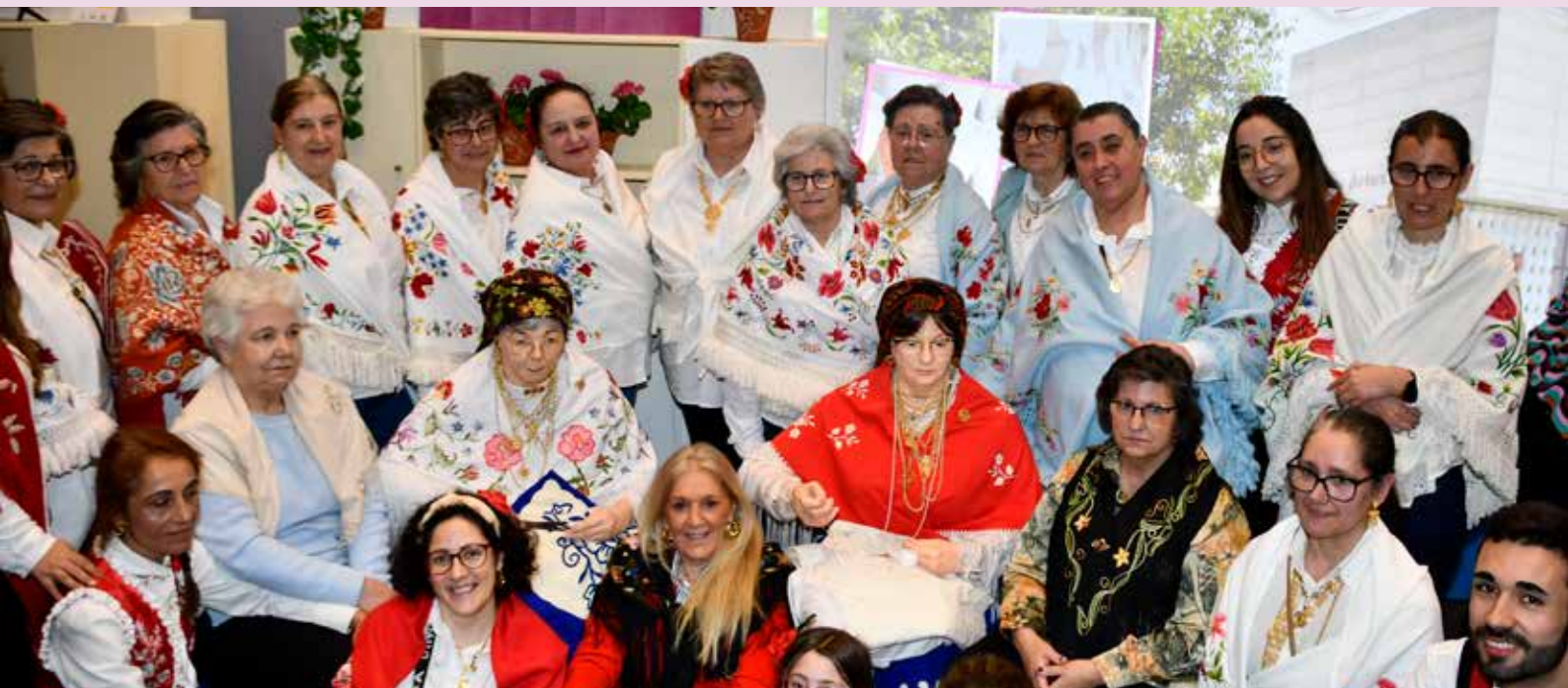
Grupo de Contradanças de Alpalhão canta e encanta na BTL