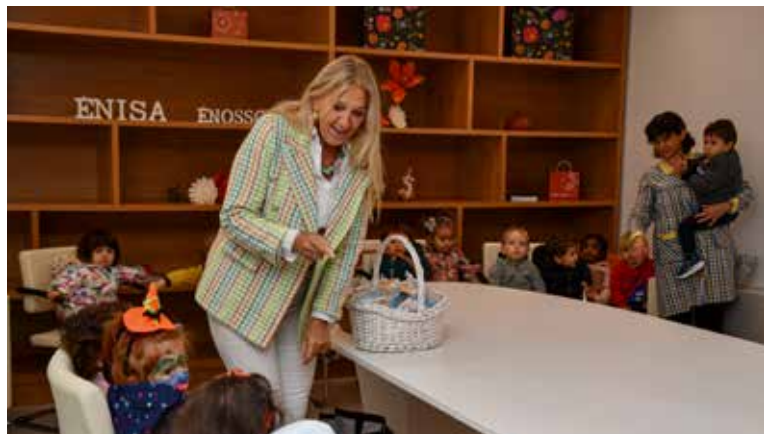
Oferta dos Santinhos