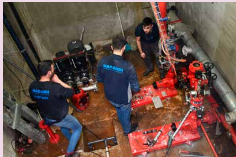
Renovação da Rede de Proteção de Incêndios