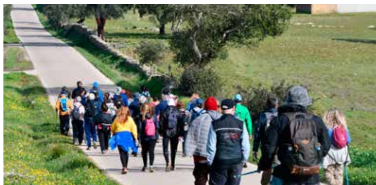
Caminhada "Rota das Ermidas, Capelas e Igrejas" em Montalvão