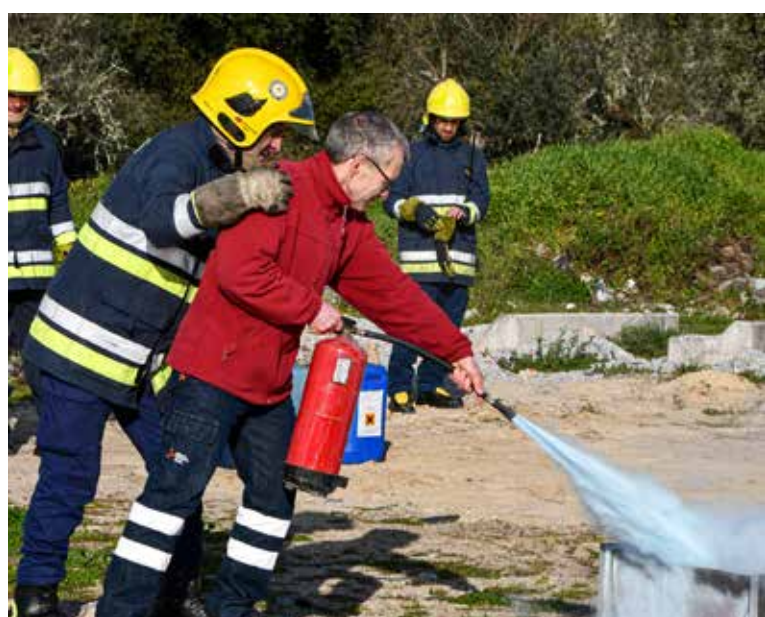
Formação para manuseamento de extintores