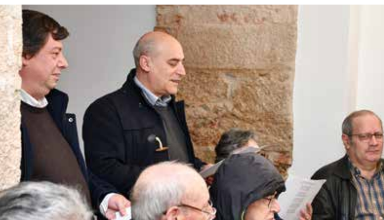
Janeiras na Câmara Municipal

As tradições são um vínculo forte da cultura de um povo, por isso fazemos questão de assinalar datas que, pelo seu caráter tradicional, não devem cair em desuso, como os "Santinhos" e das "Janeiras".