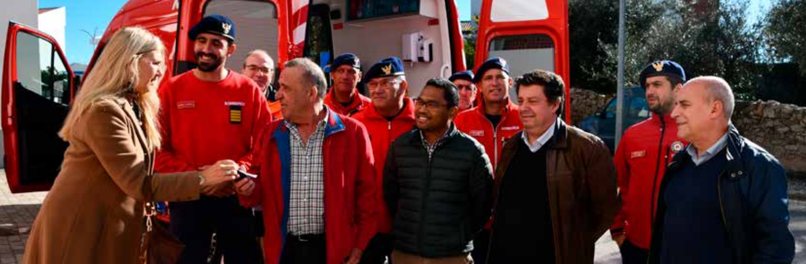
Oferta de ambulância à Associação Humanitária dos Bombeiros Voluntários de Nisa