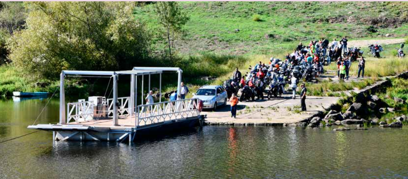
Passagem de veículos na Barca d'Amieira

É inegável a forma como o turismo no Concelho de Nisa tem crescido nos últimos anos, contribuindo para o impulso da economia local e, conseqüentemente, para a sua afirmação como um território válido para se viver e investir.