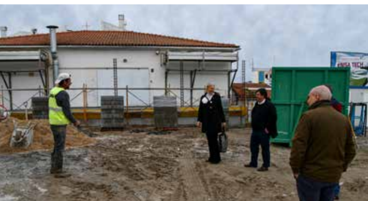
NISA - Relocalização de contentor compactador - Valor: 56.895,25 € + IVA