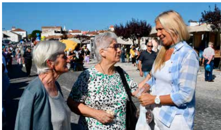
Feira no Largo da Devesa em Nisa