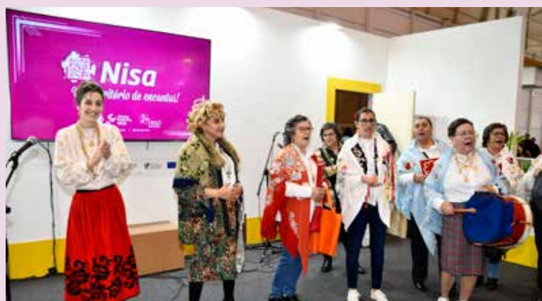
Comadres de Nisa e Contradanças de Alpalhão