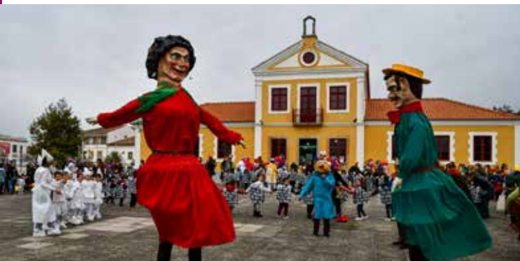
Cabeçudos no Desfile de Carnaval

O programa Nisa Carnaval 2024, promovido pela Câmara Municipal de Nisa, contou também com o habitual Baile de Domingo Gordo, no Mercado Municipal, no qual decorreu um Concurso de Máscaras cheio de originalidade e muita animação.