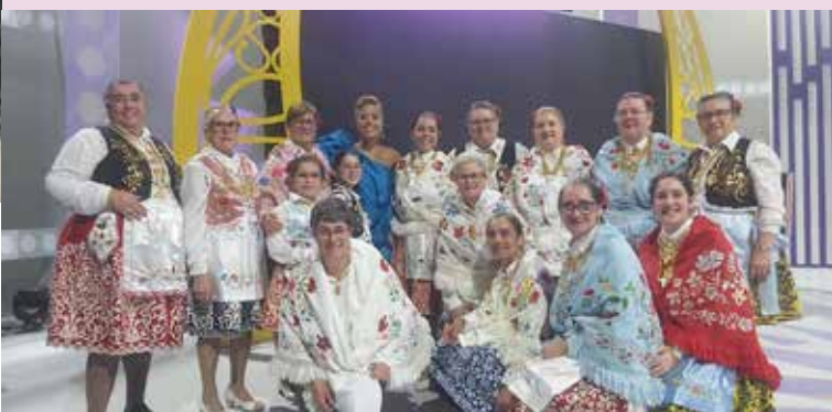
Grupo de Contradanças de Alpalhão no “Estrelas ao Sábado” (RTP)