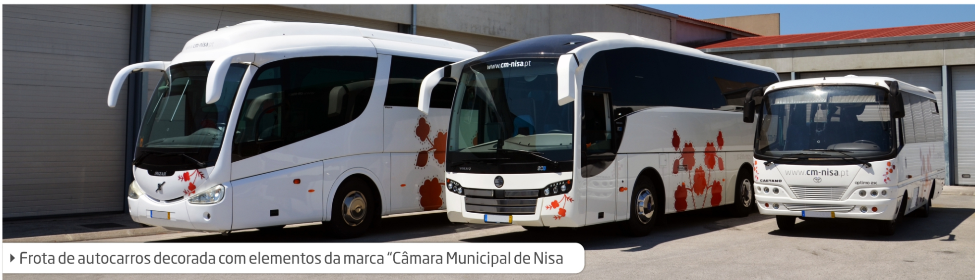
► Frota de autocarros decorada com elementos da marca "Câmara Municipal de Nisa"

*Salvo em raras exceções, onde será mais complicado reproduzir o brasão devido aos seus altos detalhes (como por exemplo no bordado), o logótipo será aplicado sem a sua presença.