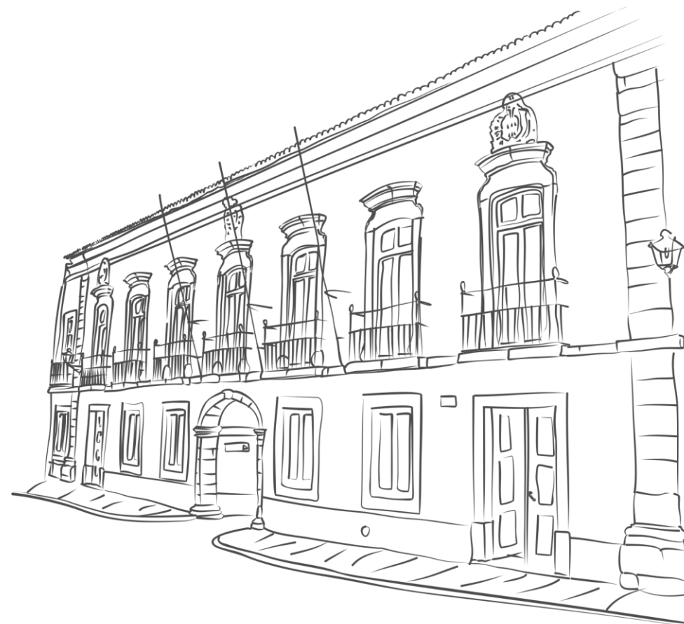
Edifício Paços do Concelho - Câmara Municipal de Nisa