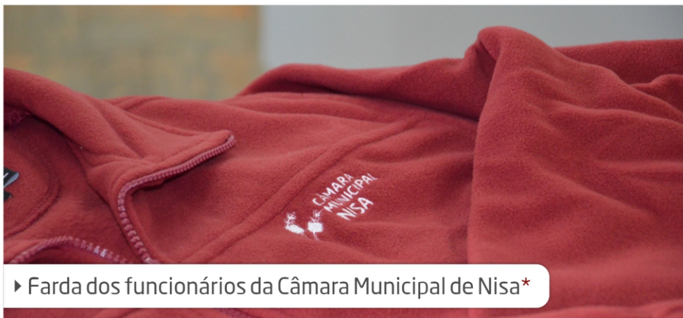
► Farda dos funcionários da Câmara Municipal de Nisa*