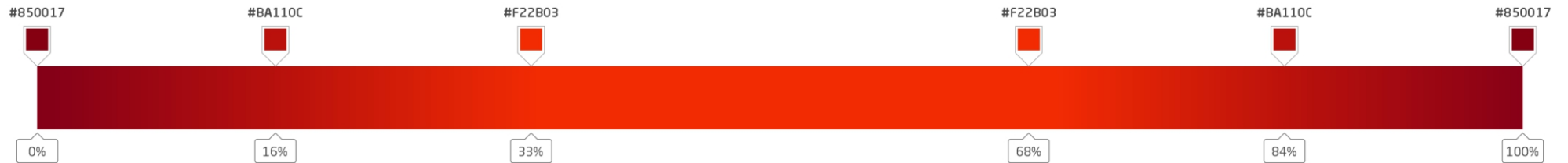
Gradiente utilizado no símbolo da “Câmara Municipal de Nisa” com as cores em hexadecimal e posicionamento percentual