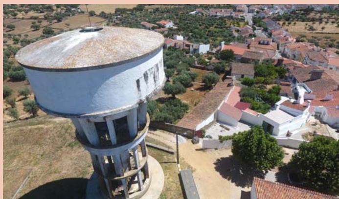
MONTALVÃO Reservatório de Águas