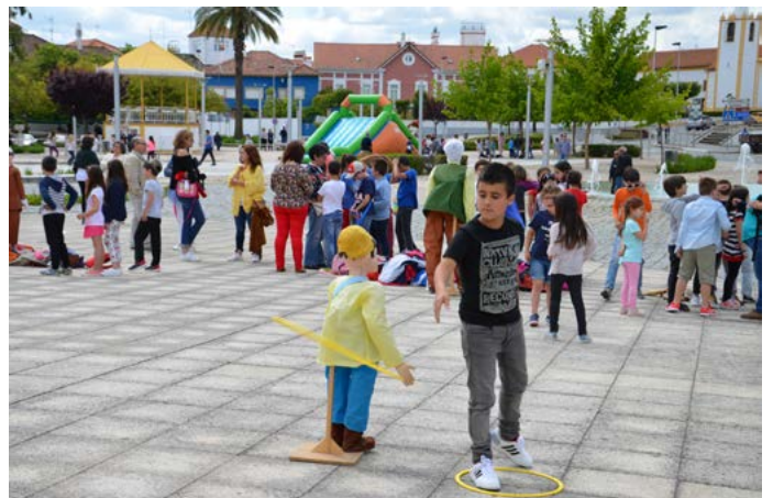
Festa da Criança - Gincana