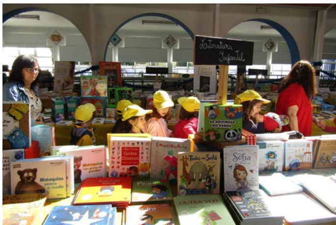
Festa da Criança - Visita à Feira do Livro