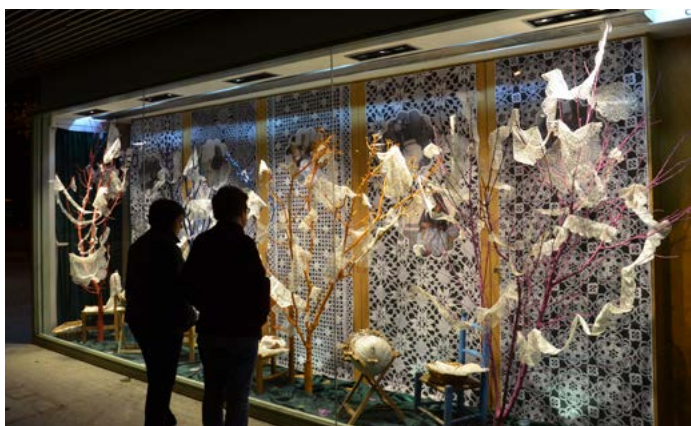
Frioleiras de São Matias