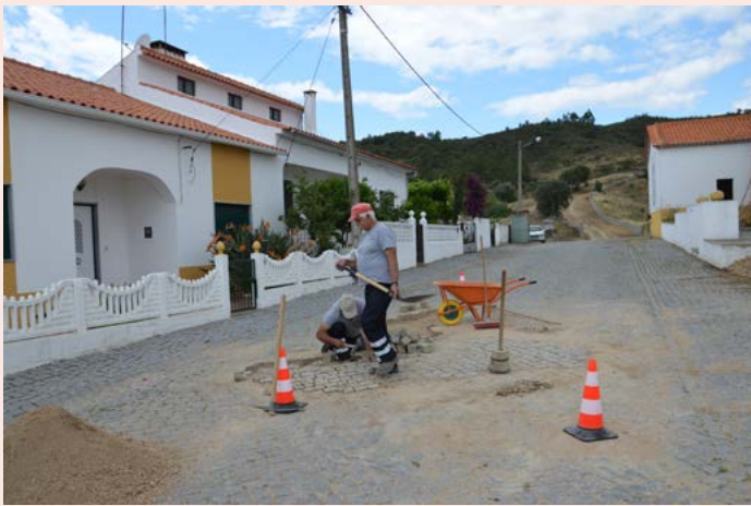
SANTANA Reposição de calçada