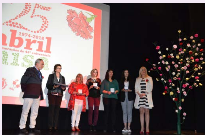
Homenagem aos aposentados e funcionários que celebraram 25 anos de serviço na Câmara Municipal de Nisa