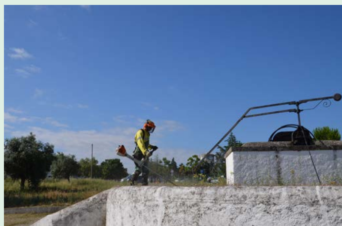
Limpeza da área envolvente ao Centro Escolar