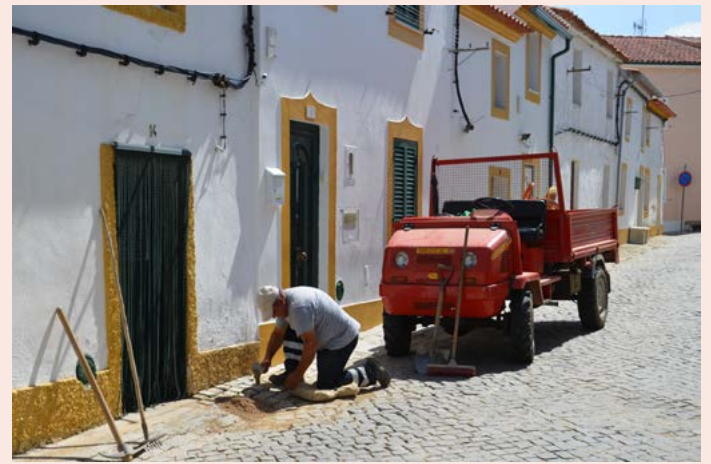
MONTALVÃO Reposição de calçada