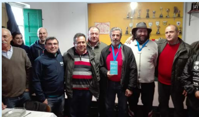
Tiro aos Pratos