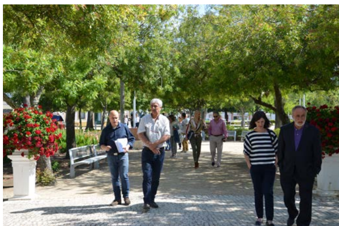
Praça da República