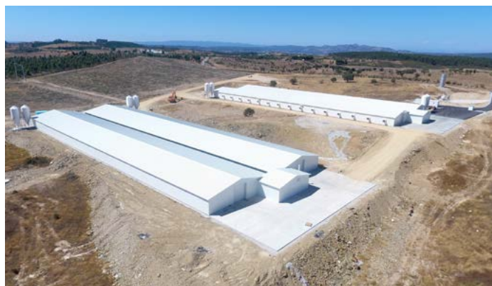
Aviários de São Matias