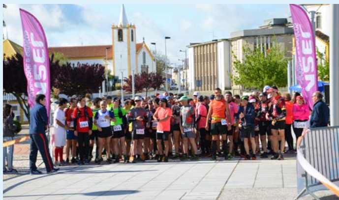
Encontro de Trail - Nisa