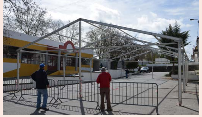
ALPALHÃO Montagem da Feira dos Enchidos