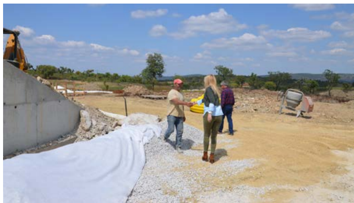
Visita da Presidente da Câmara às obras dos Aviários de São Matias (Grupo Kilom)