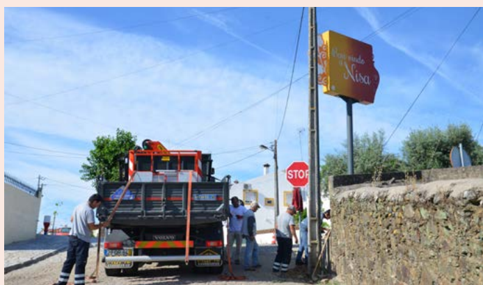
NISA Colocação de Totem na Entrada Norte