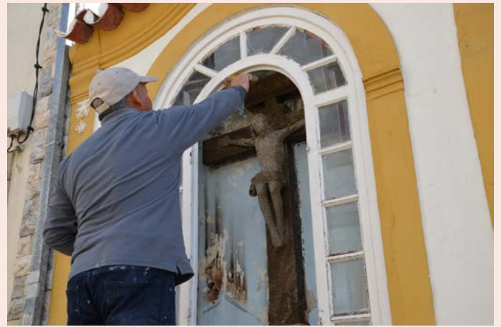
NISA Restauro do Oratório do Senhor dos Aflitos