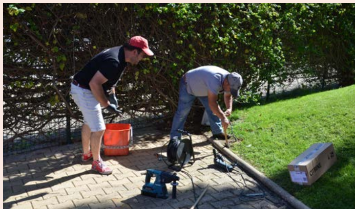
NISA Colocação de iluminação na Piscina Municipal