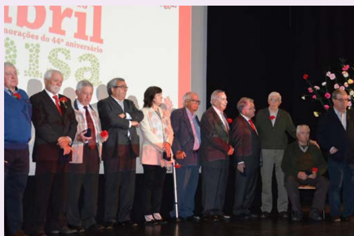
Homenagem aos Autarcas eleitos nas primeiras eleições autárquicas de 1976, com a Medalha de Honra do Município