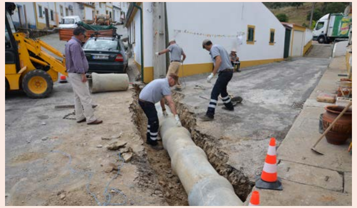
SANTANA Drenagem de Águas Pluviais