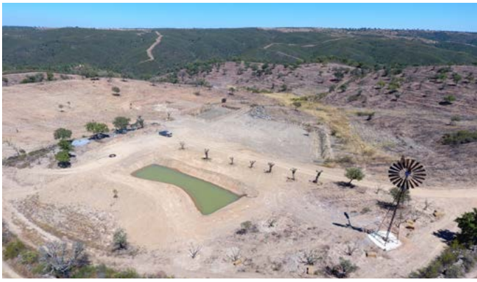
Obras de construção - FRUGAL Autocaravanismo e Agroturismo