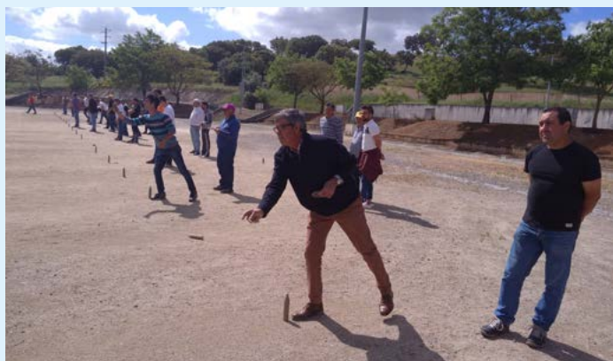
Jogo da Malha