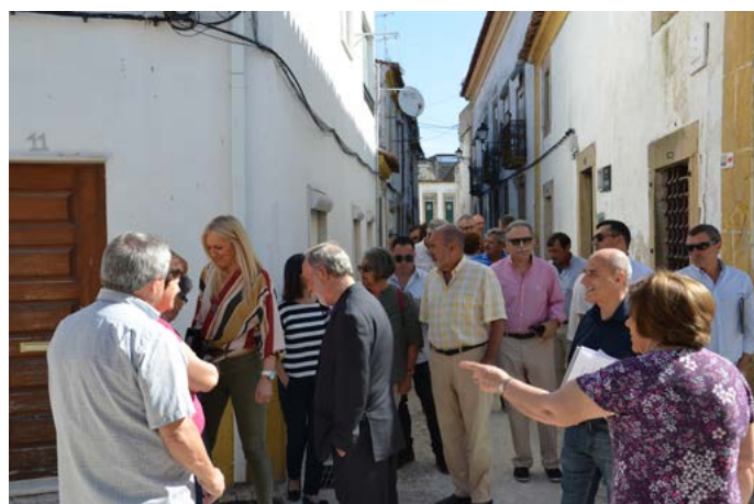
Centro Histórico de Nisa