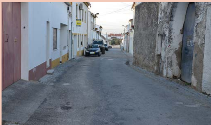
NISA Rua Professor Mendes dos Remédios