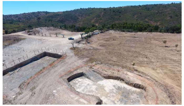
Obras de construção - FRUGAL Autocaravanismo e Agroturismo