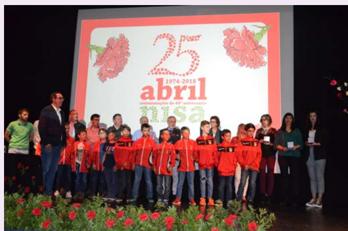
Medalhas de Reconhecimento Desportivo aos atletas/clubes que se destacaram entre abril de 2017/2018