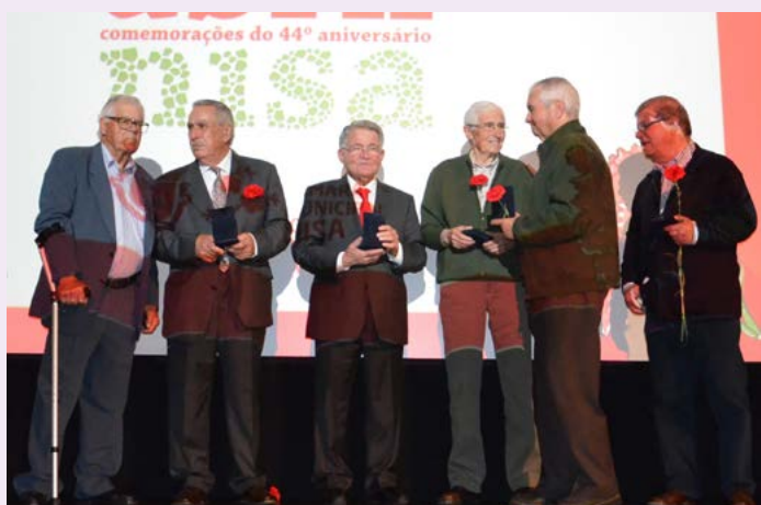
Homenagem aos Autarcas eleitos nas primeiras eleições autárquicas de 1976, com a Medalha de Honra do Município