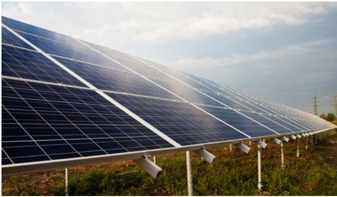
ExpoentFokus, Lda - Estação fotovoltaica (já licenciada)