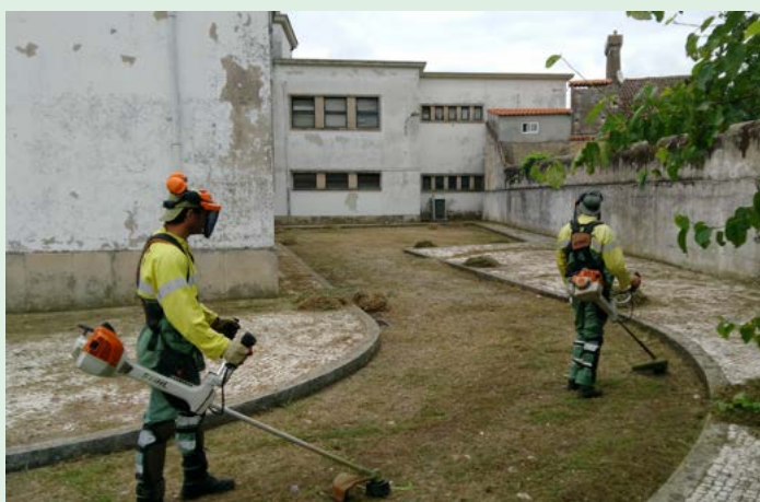
Limpeza de terrenos no Tribunal de Nisa