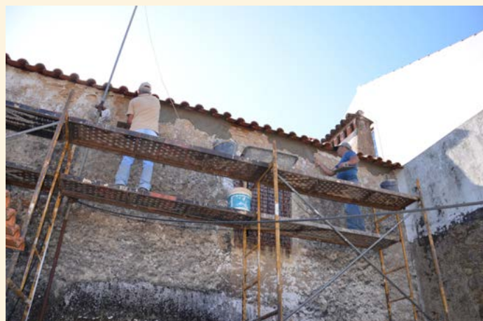
Intervenção (telhado) em Alpalhão