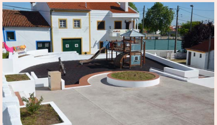
ALPALHÃO Pintura do parque infantil da Escola Primária