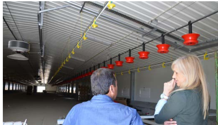
Visita da Presidente da Câmara às obras dos Aviários de São Matias (Grupo Kilom)