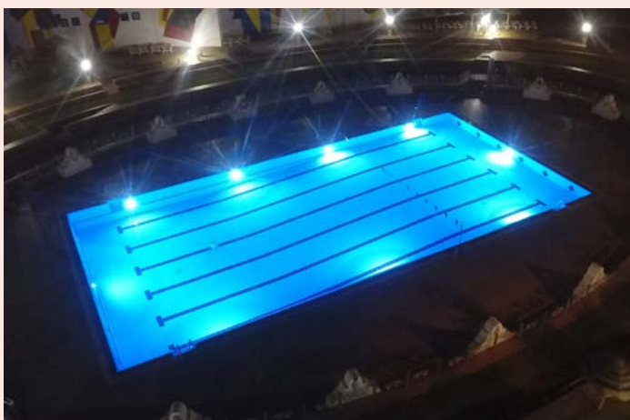
NISA Iluminação da Piscina Municipal