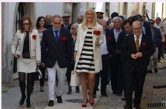
Desfile pelas ruas da vila com participação das entidades convidadas