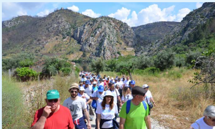
Caminhada - PR9 Trilho da Mina de Ouro do Conhal