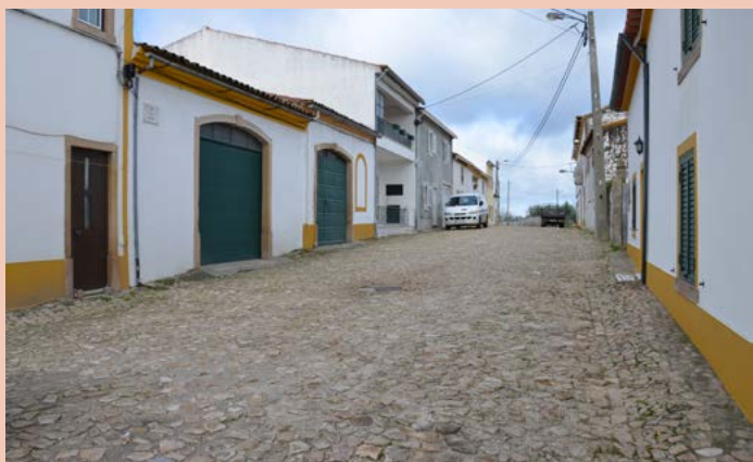
ALPALHÃO Rua das Safras