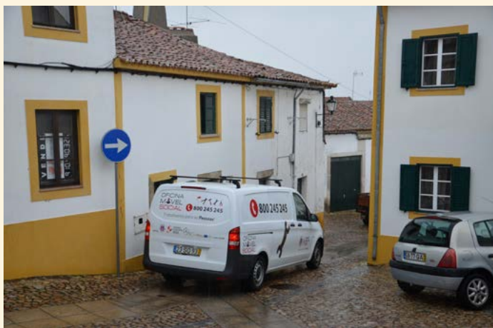
Intervenção na Rua do Mourato em Nisa