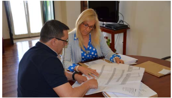
Elaboração e entrega de projeto para a instalação da empresa Nisagaz na ZAE de Nisa

Brevemente o Município irá criar uma incubadora de empresas na ZAE de Nisa , destinada a fomentar o aparecimento de novos projetos de cariz experimental e inovador, vocacionado para jovens empreendedores que desejem desenvolver a sua atividade neste local, tendo á sua disposição um conjunto de serviços de apoio: administrativos, salas de reuniões, formação, refeitório, bar, tabacaria e serviços de consultadoria.