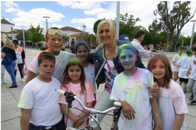
Festa da Criança - Color Run

Porque “o melhor do Mundo” são as crianças, celebrámos com entusiasmo e alegria o Dia Mundial da Criança organizando atividades multifacetadas que incluíram insufláveis, jogos de agilidade, desfile de moda, pinturas faciais, brincar aos super-heróis e o color run que pela primeira vez aconteceu neste evento num misto de cor e alegria contagiante.