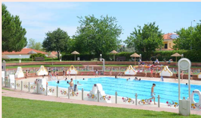
NISA Piscina Municipal