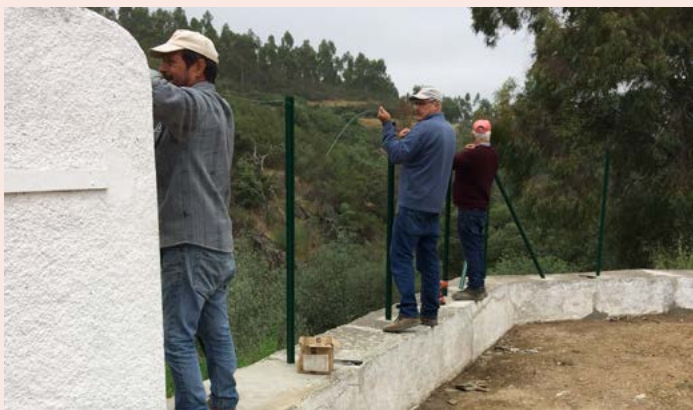
NISA Colocação de Rede de Proteção na Fonte da Tigela