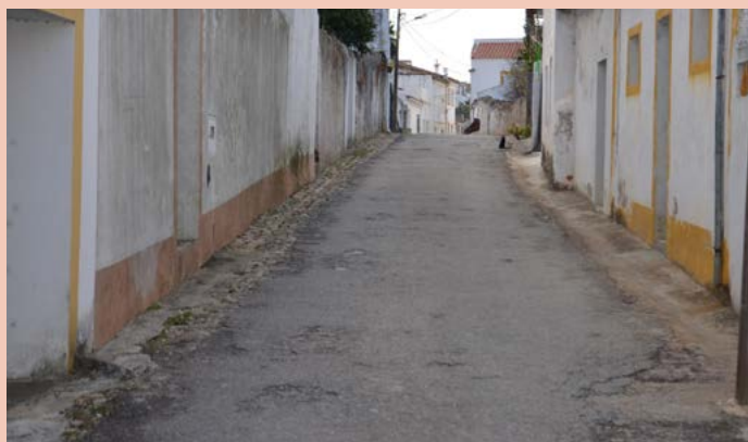
MONTALVÃO Rua das Traseiras