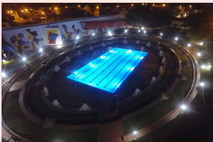
NISA Iluminação da Piscina Municipal