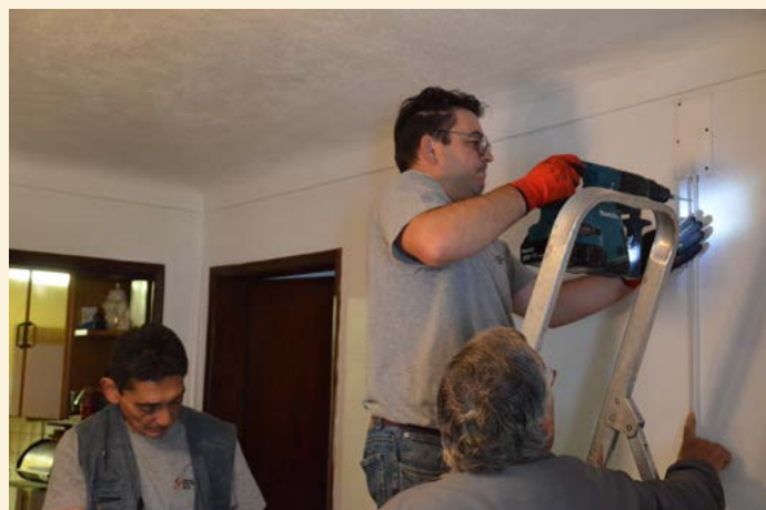
Intervenção (eletricidade) em Amieira do Tejo