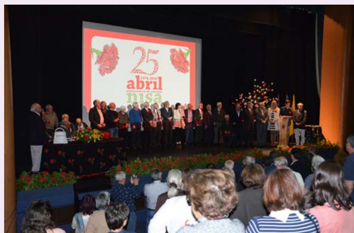
Homenagem aos Autarcas eleitos nas primeiras eleições autárquicas de 1976, com a Medalha de Honra do Município