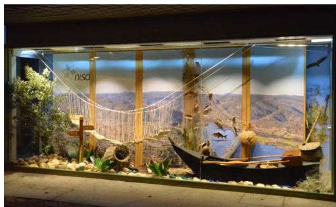
Conhal do Arneiro