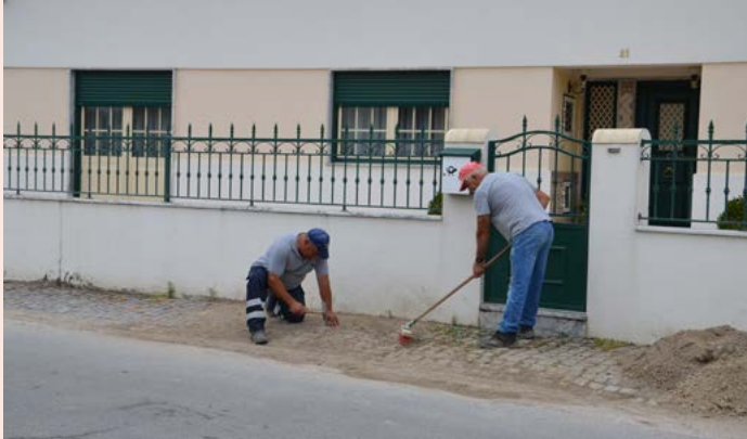
TOLOSA Reposição de calçada