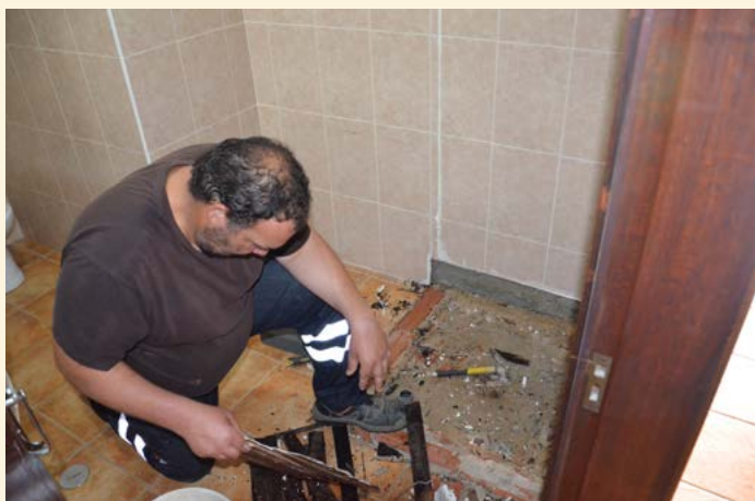
Intervenção na Rua do Convento em Nisa