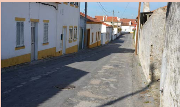
TOLOSA Rua da Nossa Sr a da Conceição