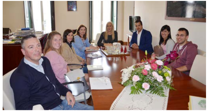
Equipa multidisciplinar do Projeto “Redução e Prevenção do Abandono Escolar Precoce e Promoção do Sucesso Escolar”

No âmbito da parceria entre o Município de Nisa e o Centro Qualifica de Elvas foi possível que, durante o presente ano letivo, um grupo de formandos concluíssem de forma ágil, flexível e com elevado grau de autonomia e responsabilização, melhor e maior qualificação escolar , que os constrangimentos profissionais, familiares ou pessoais não permitiram fazer de outra forma, e poder alcançar assim um novo horizonte de projetos de vida.