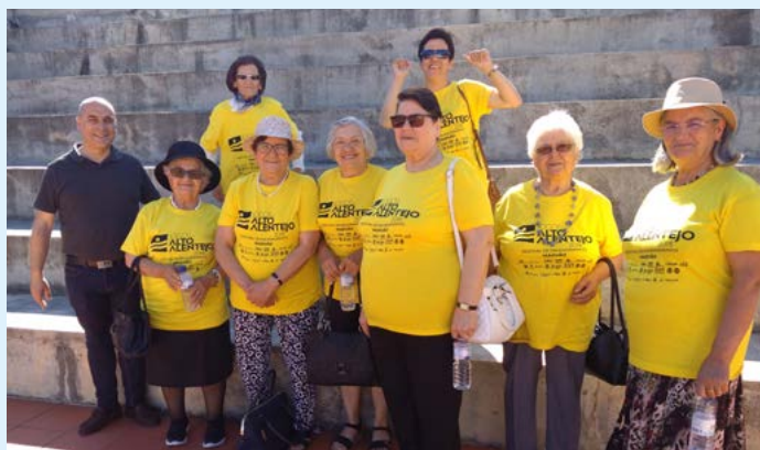
Encerramento das Atividades - Marvão