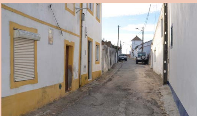
MONTALVÃO Rua da Cabine Elétrica