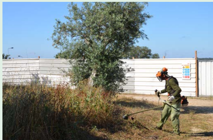
Limpeza de terrenos no Centro de Saúde de Nisa