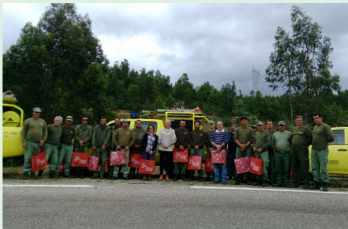
Ação de Sensibilização na área envolvente das nascentes da Galeana e na estação de captação de águas, com a colaboração de várias equipas de sapadores do distrito