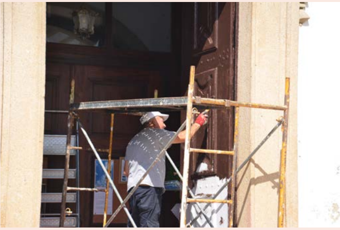
NISA Pintura da Porta da Igreja Matriz