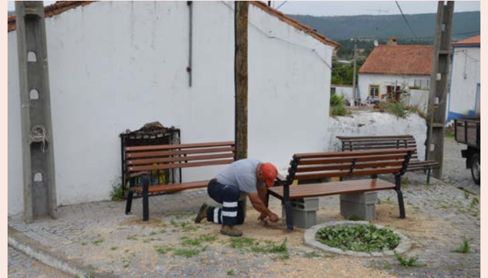
SANTANA Instalação de Bancos