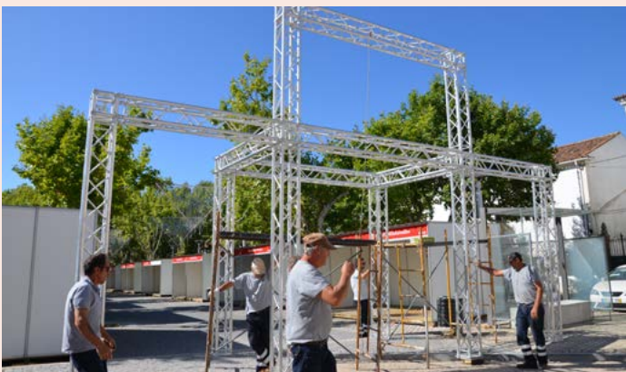
NISA Montagem do "Nisa em Festa"