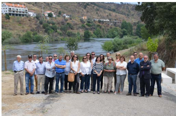
Zonas Ribeirinhas de Amieira do Tejo