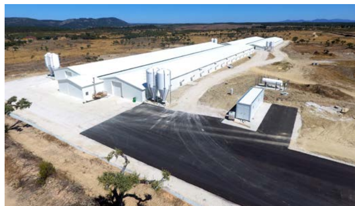
Aviários de São Matias