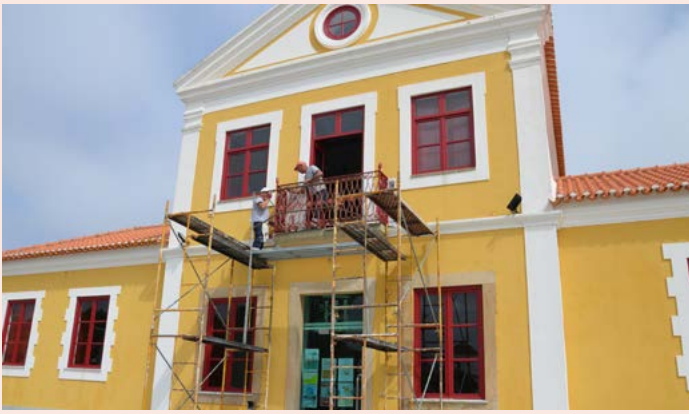
NISA Conservação e Restauro da Biblioteca Municipal