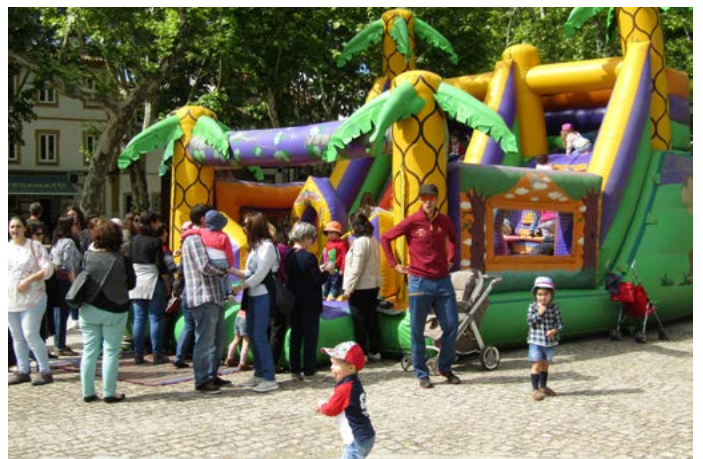
Festa da Criança - Insufláveis