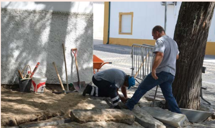
NISA Reposição de calçada