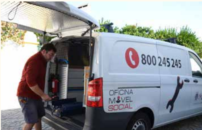
Oficina Móvel Social