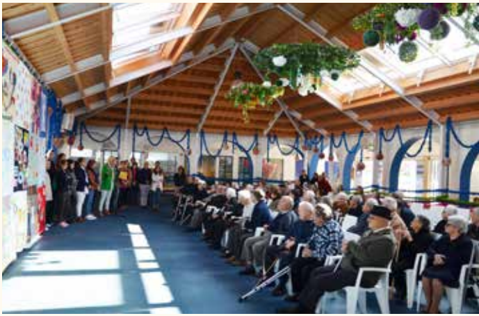
Dia Nacional da Erradicação da Pobreza em Nisa