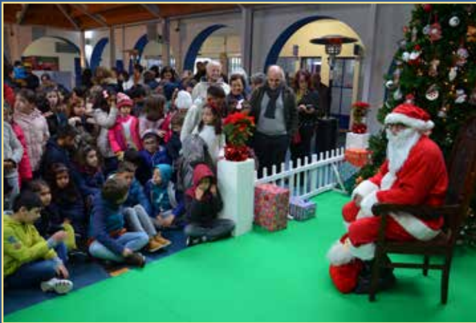
Chegada e inauguração da casa do Pai Natal