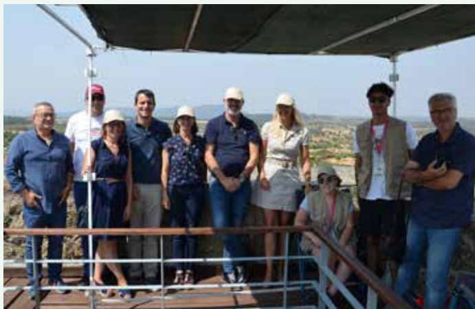
Voluntariado Jovem para a Floresta