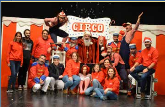
Espectáculo "Trenó de Sorrisos"