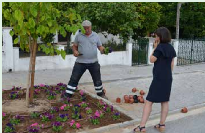
Entrada norte da vila de Nisa