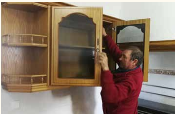
Oficina Móvel Social