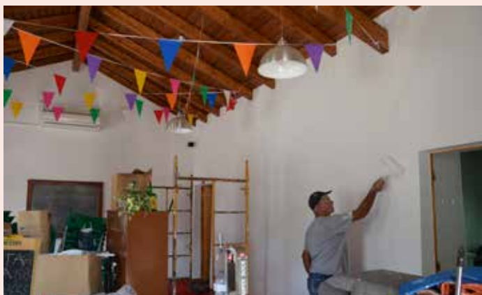
SALAVESSA Pintura interior da sede da Associação pela Salavessa