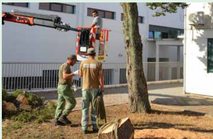
Limpeza dos espaços verdes do Centro Escolar de Nisa