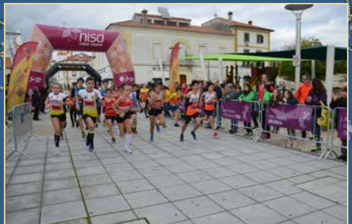
IV Corrida de São Silvestre de Nisa