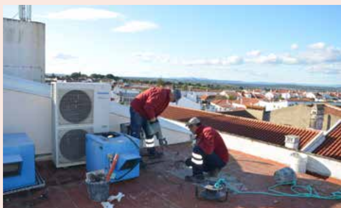
NISA Reparações na cobertura do Cine-Teatro