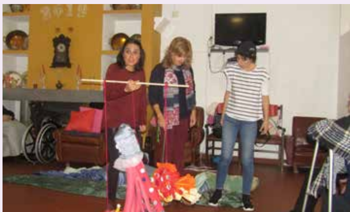
Leituras e Memórias