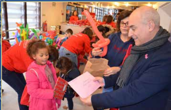
Espectáculo "Trenó de Sorrisos"