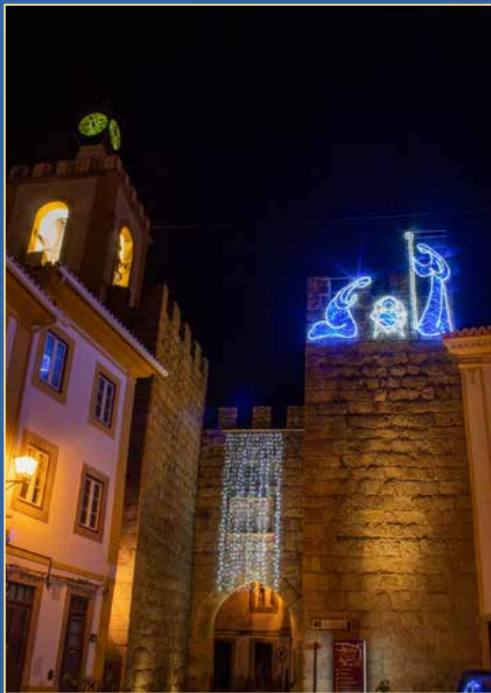
Presépio na Porta da Vila