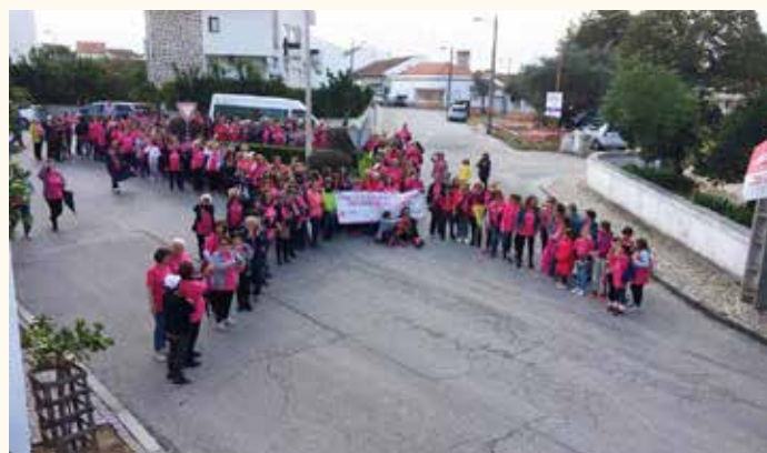
Caminhada Solidária Contra o Cancro da Mama