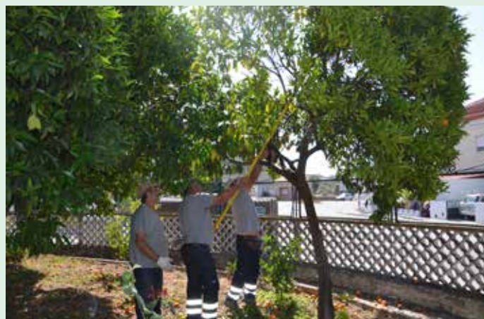
Manutenção do Espaço junto à antiga Casa do Povo