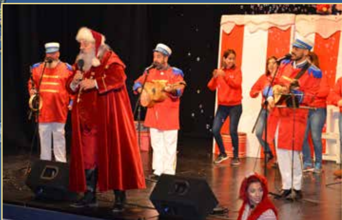
Espectáculo "Trenó de Sorrisos"