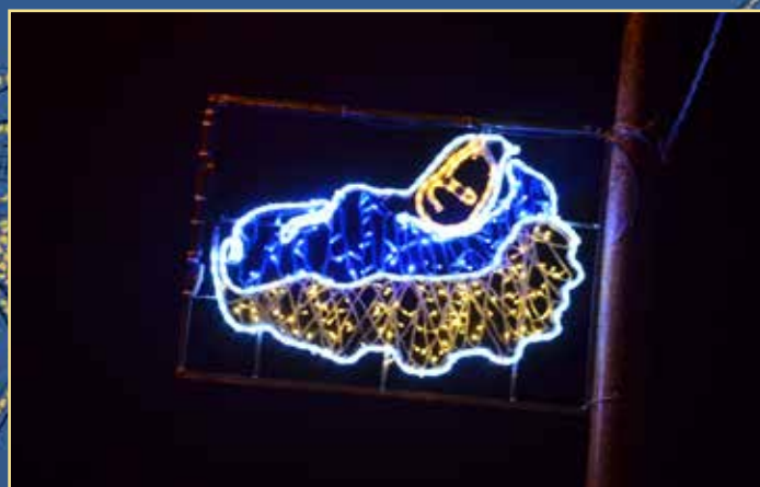
Menino Jesus na Rua dos Lusíados