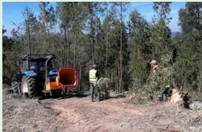
Manutenção de faixas de gestão de combustível na estrada do Arneiro