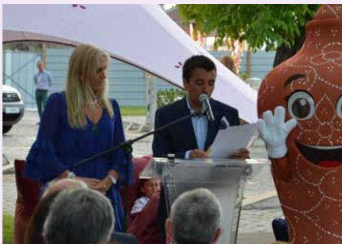
Cerimónia de Inauguração