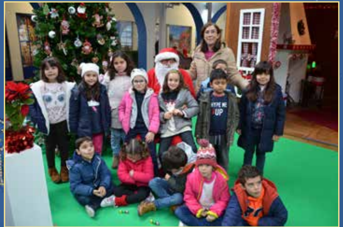
Chegada e inauguração da casa do Pai Natal