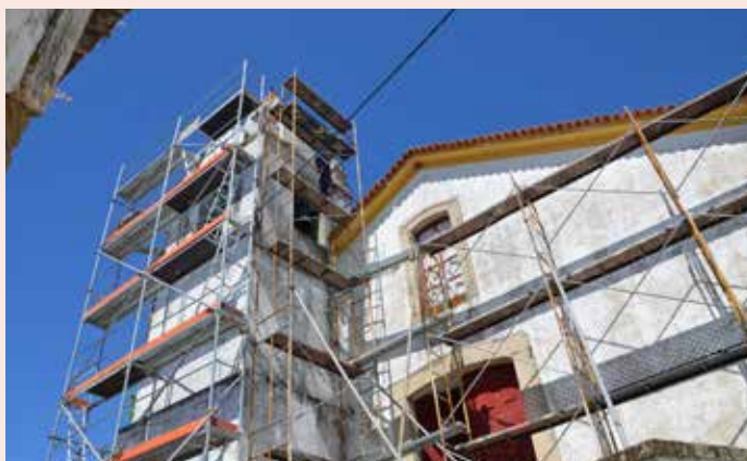
AMIEIRA DO TEJO Pintura da Igreja Matriz