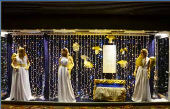
Montra de Natal do Posto de Turismo