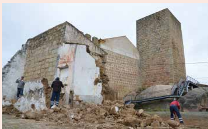
NISA Realce das Muralhas da Porta de Montalvão