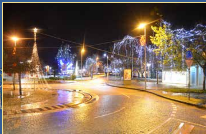
Decoração de árvores e rotunda na Praça da República