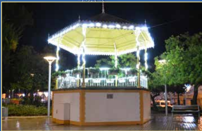
Decoração do Coreto