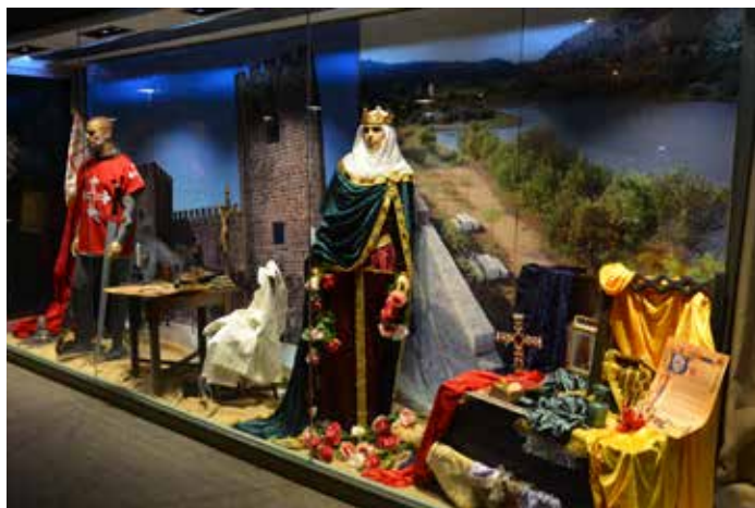
Amieira do Tejo