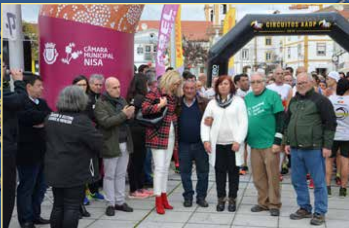
IV Corrida de São Silvestre de Nisa