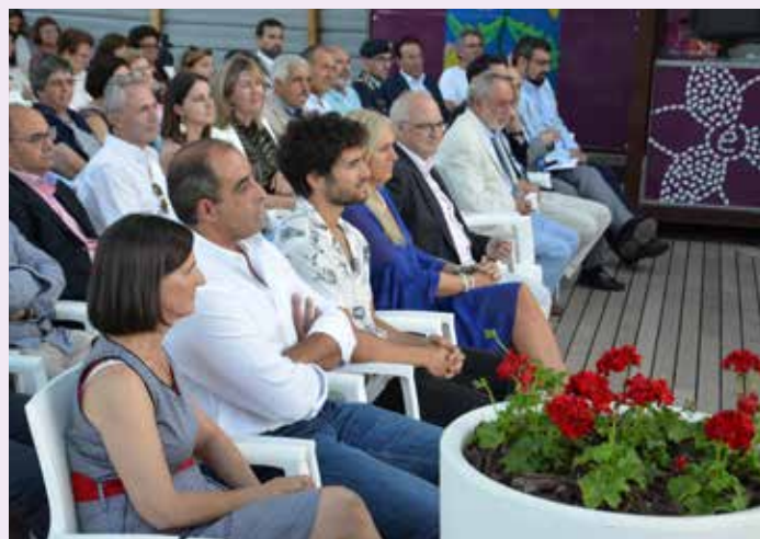
Cerimónia de Inauguração