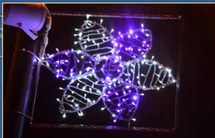
Marca éNisa na Rua Júlio Basso e Praça da República