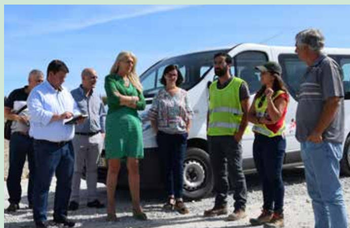
Parque fotovoltaico EFOKUS NISA (Freguesia de São Matias)