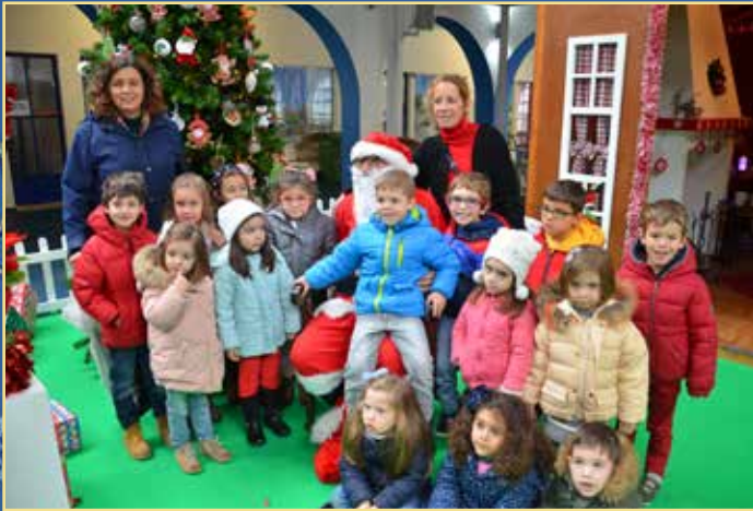
Chegada e inauguração da casa do Pai Natal