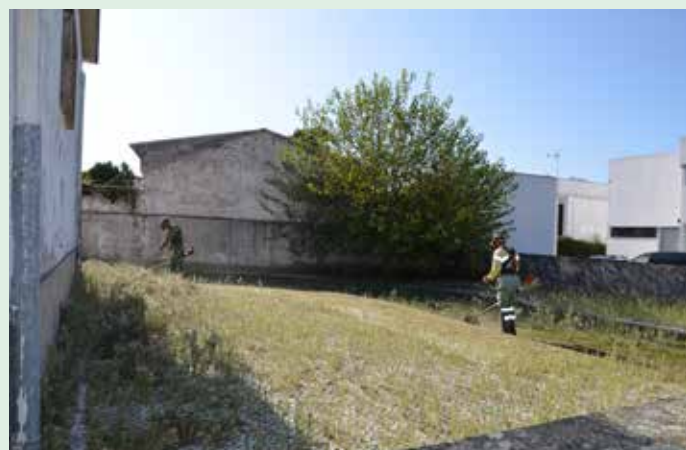
Limpeza dos espaços descobertos do Tribunal de Nisa