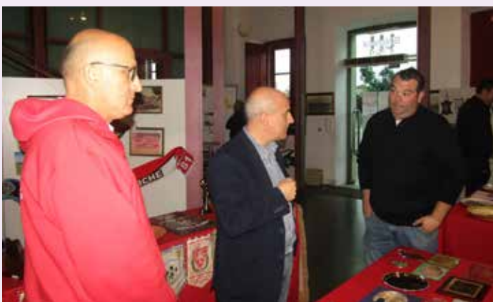
Exposição 25 anos da Associação de Veteranos do SNB