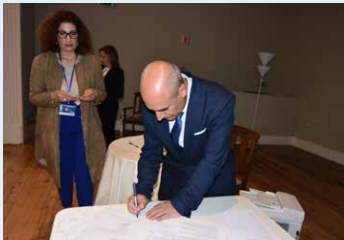
Cerimónia oficial - Assinatura de escritura

Caminhos esses que têm registado uma crescente afluência no troço que atravessa o concelho de Nisa, com uma extensão de cerca de 36 km, que se inicia em Alpalhão e termina no Rio Tejo, junto às Portas de Ródão.