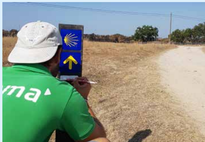
Instalação de sinalética no concelho de Nisa