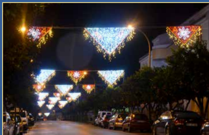
Xailes na Avenida D. Dinis e Praça da República