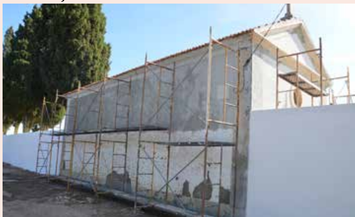
TOLOSA Intervenção no Cemitério