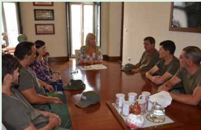
Nova brigada de Sapadores Florestais

No âmbito de um acordo de colaboração celebrado entre o Município de Nisa e a Comunidade Intermunicipal do Alto Alentejo (CIMAA), o concelho ganhou em setembro a sua 2.ª Brigada de Sapadores Florestais.