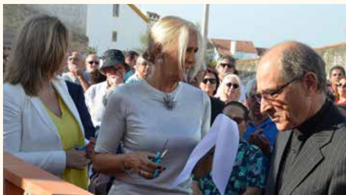
Inauguração da Casa do Cruzeiro em Arez

A ação social que a Câmara Municipal desempenha e quer continuar a desempenhar, passa ainda por outras iniciativas isoladas ( Comemoração do Dia Nacional da Erradicação da Pobreza, Caminhada Solidária Contra o Cancro da Mama, Comemoração do Dia do Respeito pela Pessoa Idosa... ) que têm como objetivo despertar a atenção para causas cuja reflexão cívica é essencial.