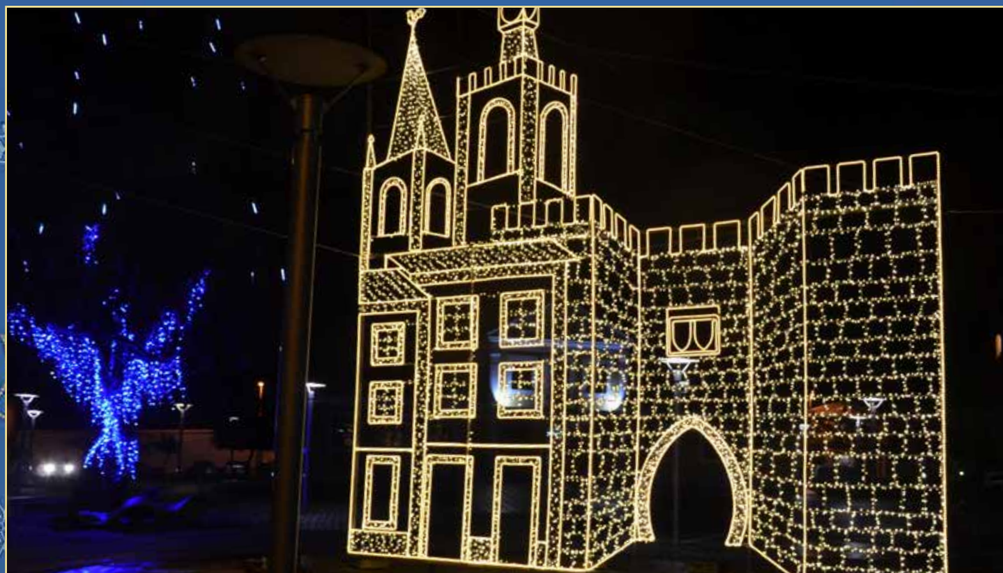
Porta da Vila e decoração do Eucalipto na Praça da República