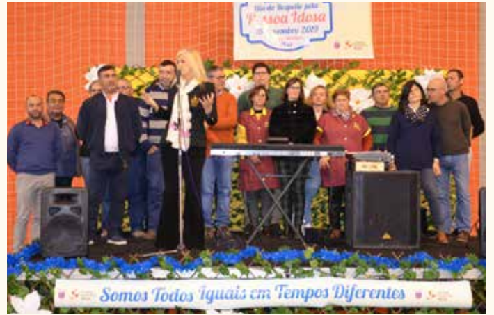
Comemoração do Dia do Respeito pela Pessoa Idosa