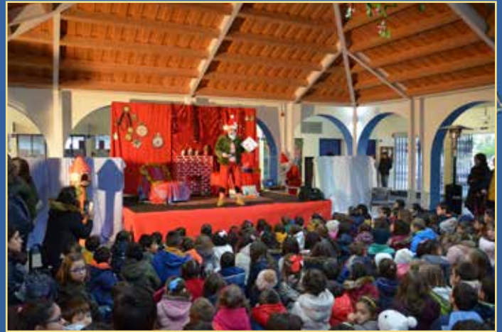
Chegada e inauguração da casa do Pai Natal