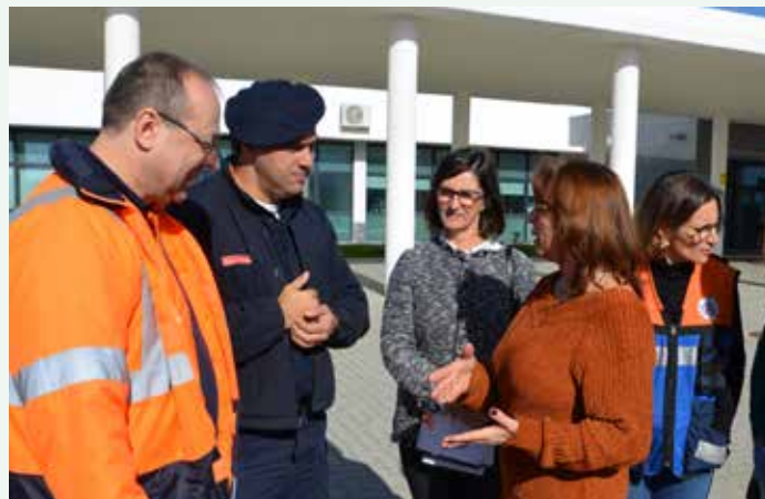
Ação de sensibilização "A Terra Treme"