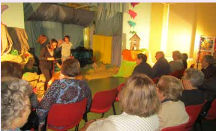
Chá com Letras