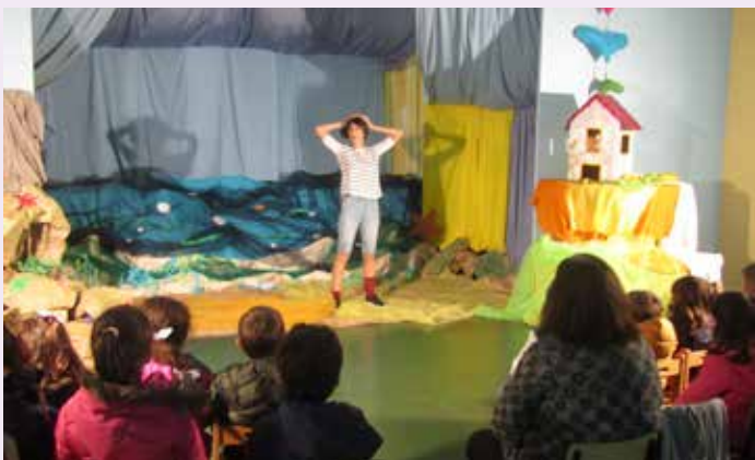
Sábados com Histórias / Hora do Conto