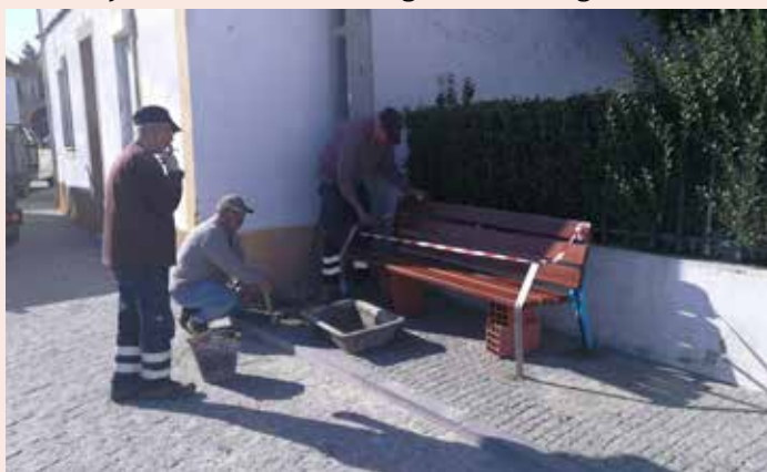
NISA Instalação de banco no Largo dos Postigos