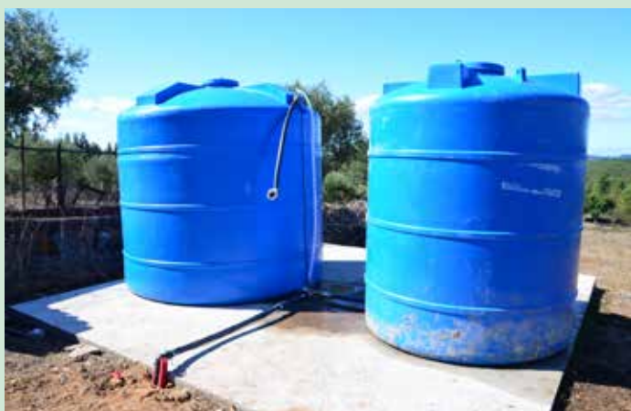
Novo reservatório de água no Cacheiro