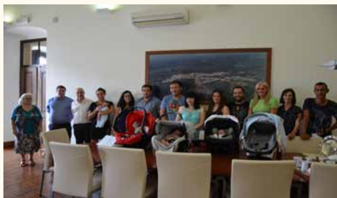
Nascer em Nisa