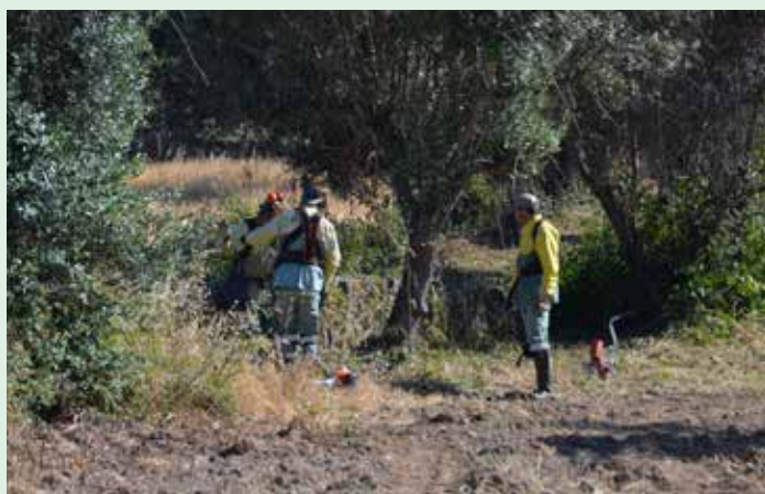
Limpeza de terrenos na ZAE de Nisa