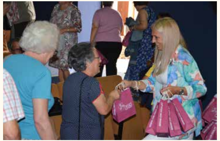
Abertura do Novo ano letivo Univ. Senior