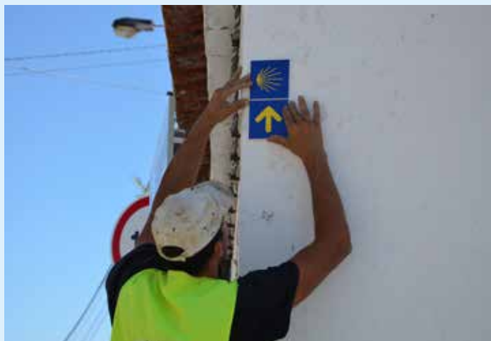
Instalação de sinalética no concelho de Nisa