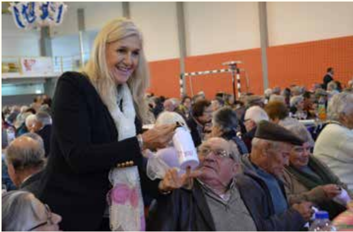
Comemoração do Dia do Respeito pela Pessoa Idosa