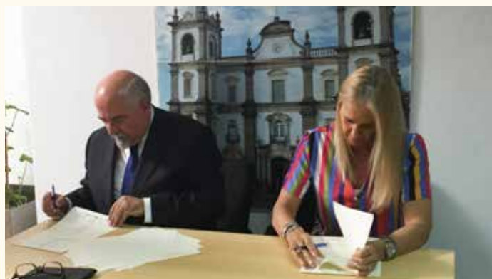
Assinatura do Protocolo para Apoio às Vítimas de Violência Doméstica