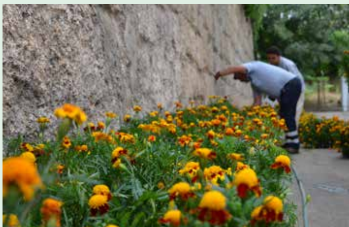
Muralha junto à Porta da Vila