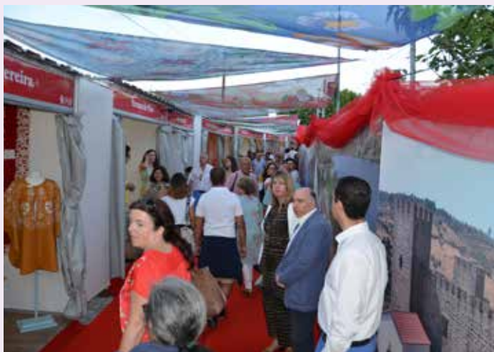
Avenida do Artesanato