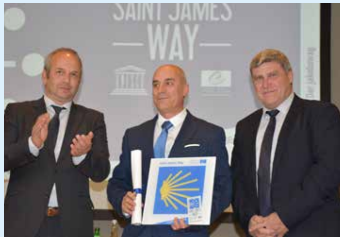
Cerimónia oficial - Entrega da placa identitária