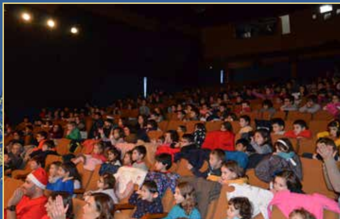
Espectáculo "Trenó de Sorrisos"