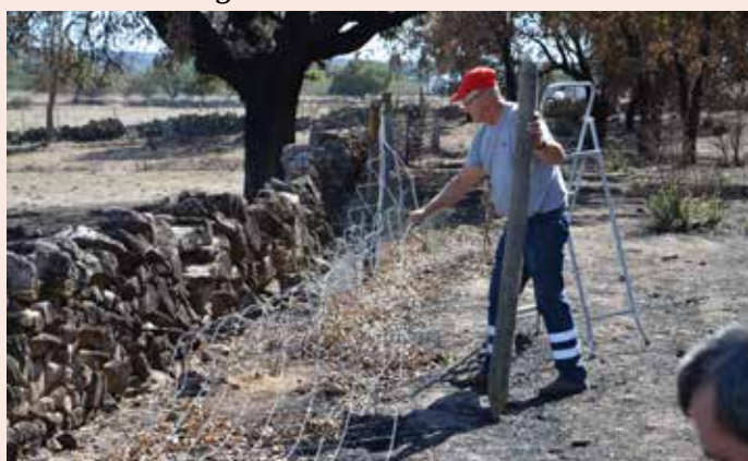
NISA Restauro após incêndio da zona envolvente à "Anta dos Saragonheiros"