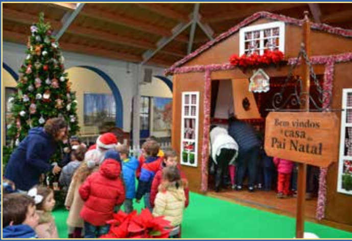
Chegada e inauguração da casa do Pai Natal