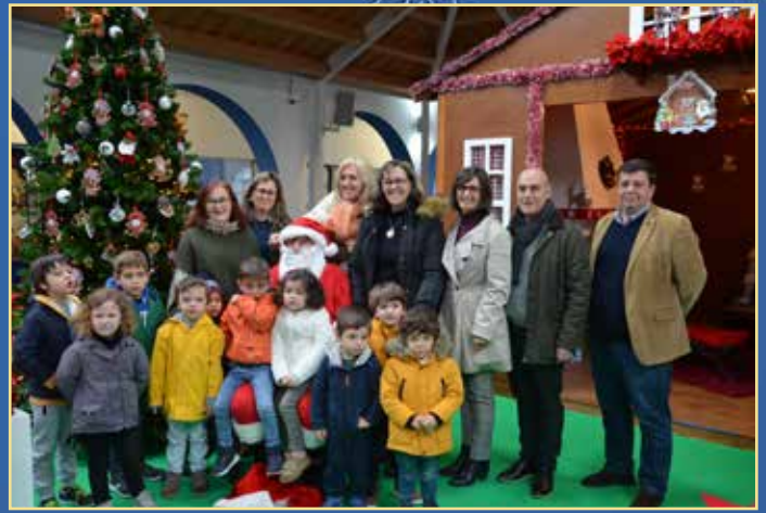
Chegada e inauguração da casa do Pai Natal