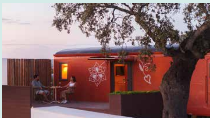
Imagem identitária de Nisa ultrapassa as fronteiras do concelho