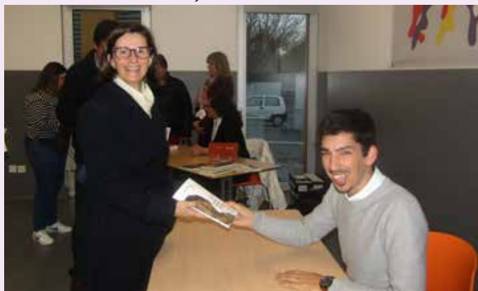
Sessão de lançamento do Livro "Eu, na idade de mudar o mundo"